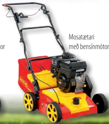
Mosatætari með bensínsmótor

garðinn en líka til að læra þetta gamla rötgróna íslenska handverk. „Þetta er fólk frá stofnunum og þjóðgördum, fornleifafræðingar og fleiri sem vilja læra að nota nærumhverfið til að græða upp svæði og búa til skjól bara með því að þekkja þessar gömlu torfstunguáferðir.“ Hann segir að námskeiðin byrji yfirleitt verklega. „Ég byrja á því að láta fólk snerta steinana og fá tilfinningu fyrir þeim, finna hvernig þeir passa í vegginn og hleðsluna. Daginn eftir útskýri ég með teikningum og myndum hvernig þetta er gert og þá skilur fólk þetta