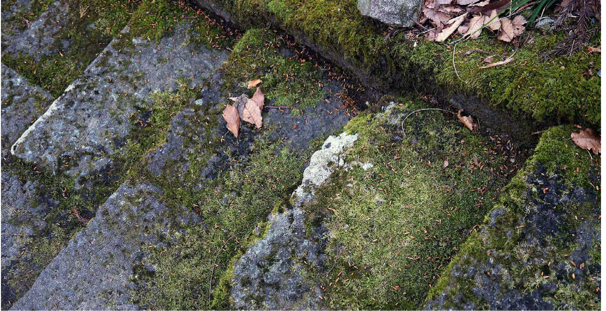
Mosavaxin stétt gefur til kynna að hún sé lítið notuð. Hreinsa má mosann af stéttinni með þartilgerðum efnum, skafa og skola.