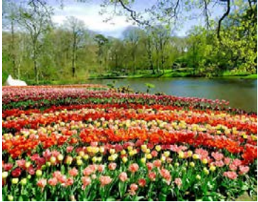
Litfagrir túlípanar í Keukenhof-garði.