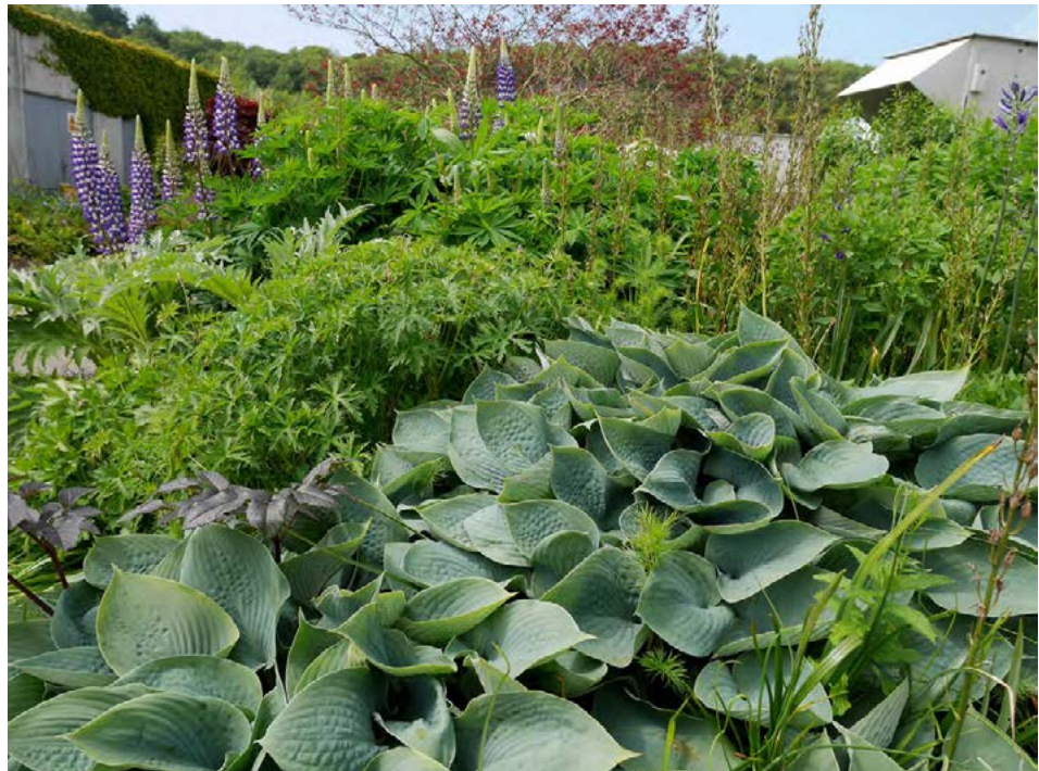
Fjölæringar í Cornwall á Suður-England.

heitum í garðinum hjá mömmu. Ég er sannfærð um að fjölæringar létu fólki garðverkin en það fer þó eftir því hvernig þeim er plantað. Um leið og fólk kynnist þeim og veit hvenær á að stíga inn og taka þá í sundur þarf ekki að vinna með þá á hverjum ári. Það þarf ekki að sá fjölæringum eða planta á hverju ári, þeir eru bara tilbúnir. Svo er hægt