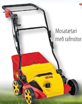
Mosatætari með rafmótor