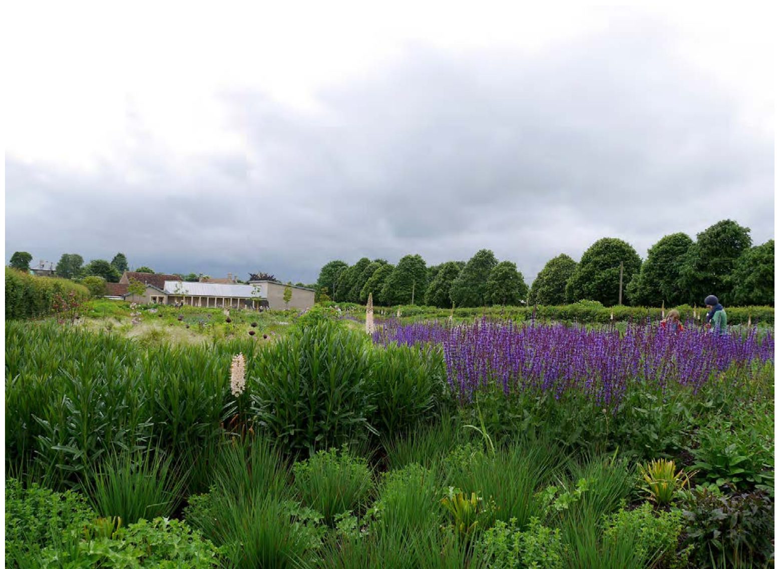
Sigríður Embla tók þessa mynd í Hauser&Wirth í Somerset. Garðurinn er hannaður af Piet Oudolf.

Um leið og gróðurinn verður farinn að njóta sín í stærri beðum má búast við að fleiri prófi sig áfram og fjölæringar fari að sjást enn meir í einkagörðum. „Þetta er gróður sem hentar vel í einkagörðum. Ég er ekki með garð sjálf en er svo heppin að fá að fíkra mig áfram í röleg-