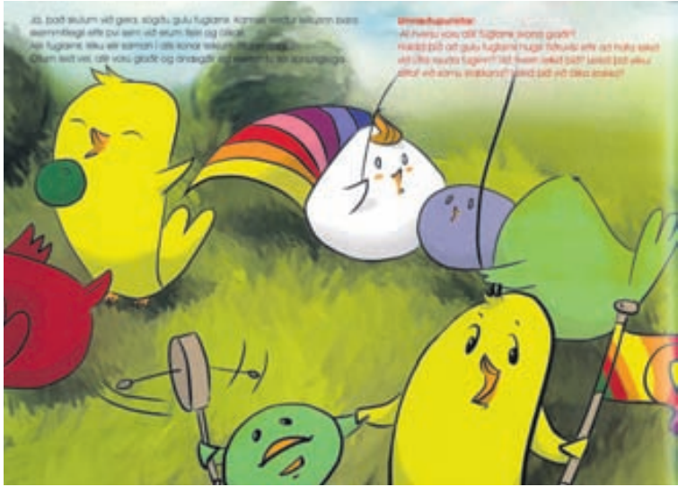
Regnbogafuglinn fær fugla í mismunandi litum og stærðum til að leika saman.