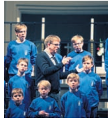
Margir drengjanna halda áfram tónlistarnámi eftir að kórstarfinu sleppir.

tvísvar í viku. Þá er farið í kórferðalag innanlands annað hvert ár og kórferðalag til útlanda hitt árið. Æfingabúðir eru yfir eina helgi að hausti og vori og bæði jóla- og vortónleikar. Þá syngur kórinn við messu að jafnaði einu sinni í mánuði yfir vetrartímann. Drengirnir kynnast öflugum tónlistarstarfi og hefur það sýnt sig að margir fyrrverandi kórfélagar halda áfram tónlistarnámi.