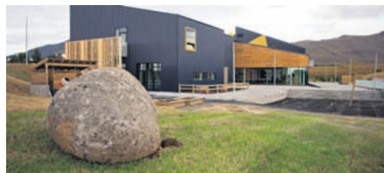
Nýja skólahúsnæðið hýsir grunnskólasvið sameinaðs grunn- og leikskóla Hvalfjarðarsveitar.

Hvaða áhrif mun sameiningin hafa? „Hjá sveitarfélaginu er hún ekki hugsuð sem niðurskurður eða sparnaður heldur sem faglegur