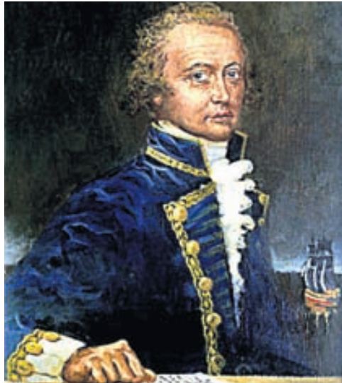
Eitt af því sem skipverjar á Bounty gerðu uppreisn gegn var slæmt fæði. Bligh skipstjóri trúði greinilega ekki á sítrónur og límónur.

ýmsum framámönnum sjóhersins, enda var það almenn skoðun að koma mætti í veg fyrir skyrbjúg með miklu hreinlæti, reglubundinni líkamsrækt og með því að leggja áherslu á góðan félagsanda um borð.