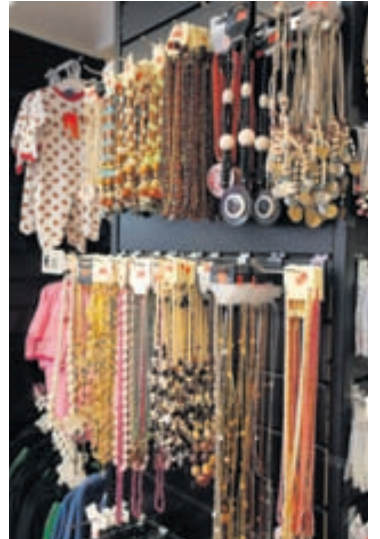
Hálsfestar og fleira skart.