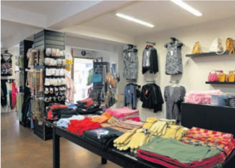
Fatnaður og töskur fyrir kvenþjóðina fást á góðu verði.