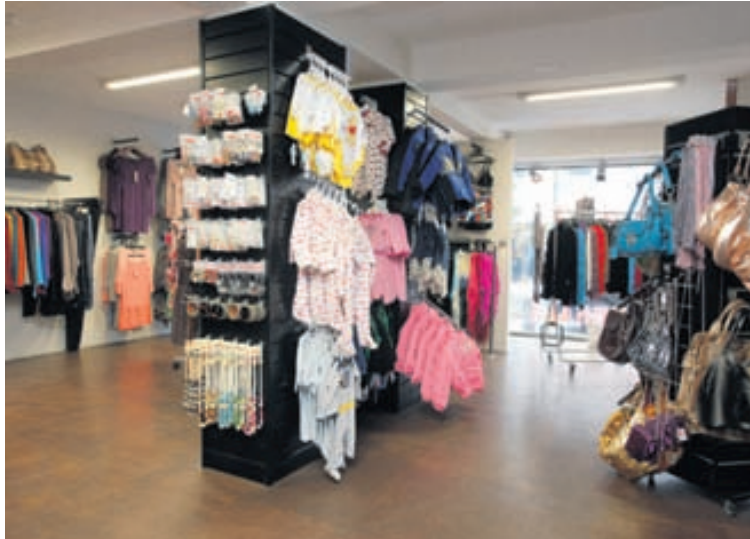
Barnaföt eru til í úrvali.