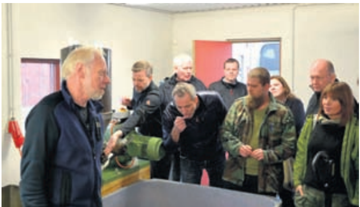
Í vorferðinni 2012 var Ólafur á Þorvaldseyri sóttur heim en í kjölfar „hrunsins“ og eldgossins í Eyjafjallajökli var haldið námskeið í áfallastjórnun.