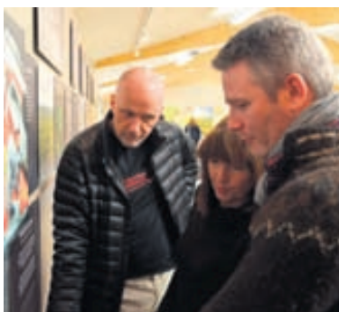
Nemndur hafa fjölbreyttan bakgrunn og miðla hver öðrum af reynslu sinni og þekkingu.