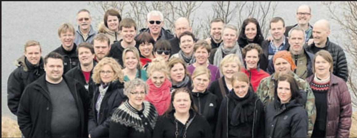
Nemendur á fyrra ári í MPM-námi Háskólans í Reykjavík.