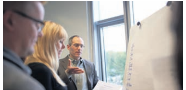
Fjöldi erlendra kennara koma að náminu og eru þeir í fremstu röð á sínu sviði. Þeir koma meðal annars frá MIT, Stanford, Middlesex University, Heriott-Watts, of víðar.

sjónarhorni skipuheimilda og hvernig auka má verkefnastjórnunarlegan þroska innan þeirra. Skoðaðar eru hefðbundnar aðferðir í verkefnastjórnun en einnig nýstárlegar aðferðir, s.s. Agile-aðferðir, sem koma úr hugbúnaðargeiranum og fela í sér sveigjanleika gagnvart breytingum. Í lokaverkefni skoða