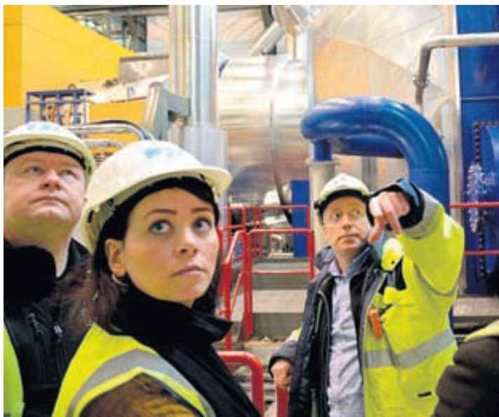
Í MPM-námi er lögð áhersla á bæði „harðar“ verkvísindalegar aðferðir og „mjúkar“ stjórnunaraðferðir.