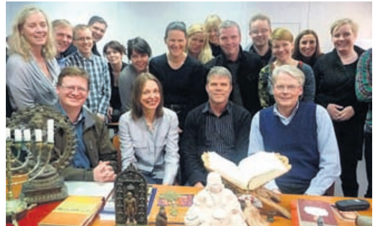
Námskeiðið Verkefnastjórnun á framandi slóð leiðbeinir um umgengni við fólk af ólíkum menningarheimum

MPM-nemendur læra um undirbúning og áætlanagerð í verkefnum og þeir fá þjálfun í að beita sígildum aðferðum við gerð og eftirfylgni áætlana. Þeir læra um gerð vallíkana til að velja á milli verkefna, með því að skoða fjárhagslega þætti og meta arðsemi, en einnig með því að skoða þætti sem erfiðara er að mæla. Rætt er um hvernig skipuheimildir marka sér stefnu og ráðast í verkefni til að raungera hana. Fjallað er um stjórnun og samræmingu verkefnastofna og verkefnaskráa og breytingastjórnun til að hrinda flóknum skipulagsbreytingum í framkvæmd. Hlutverk í verkefnum eru skoðuð ítarlega, meðal annars hlutverk verkefnaleiðtogans. Nemendur spegla sig í leiðtogafræðum, fræðast um þá þætti sem hafa áhrif á teymisvinnu og hvernig standa má með markvissum hætti að mótun verkefnisteyma svo þau verði skilvirk. Hlutverk og ábyrgð verkefnaleiðtogans er ígrunduð en einnig er rætt um samskipti og ólíka menningarheima og nauðsyn þess að skilja bakgrunn og menningu samstarfsaðila úr öðrum heimshlutum. Fjallað er um vörupróun og sjónum beint að hefðbundnum jafnt sem nýstárlegum aðferðum til að stjórna flóknum vörupróunarverkefnum. Rætt er um verkefnastjórnun út frá