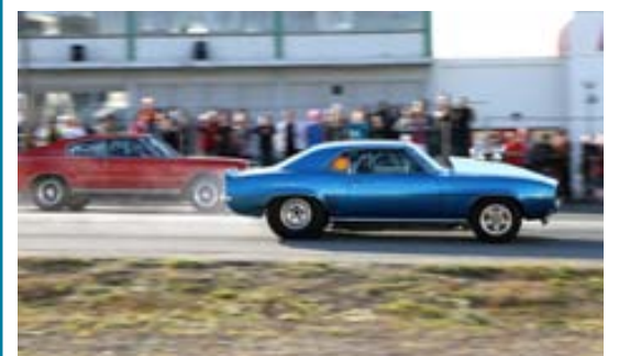
Frá Bíladögum í fyrra.