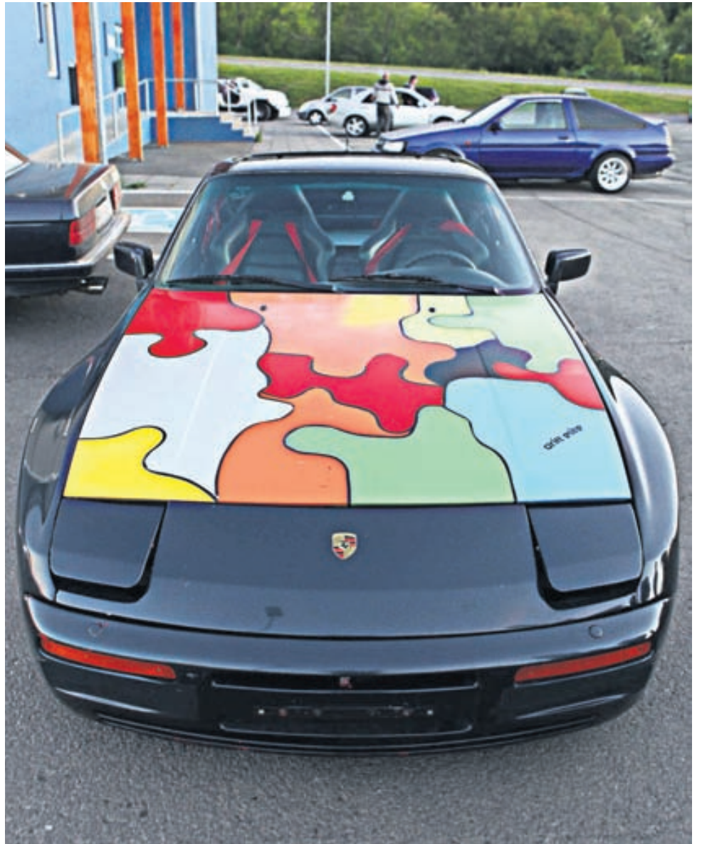
Margt skemmtilegt verður í boði fyrir bílaáhugamenn og alla aðra sem leið eiga um Akureyri um helgina.