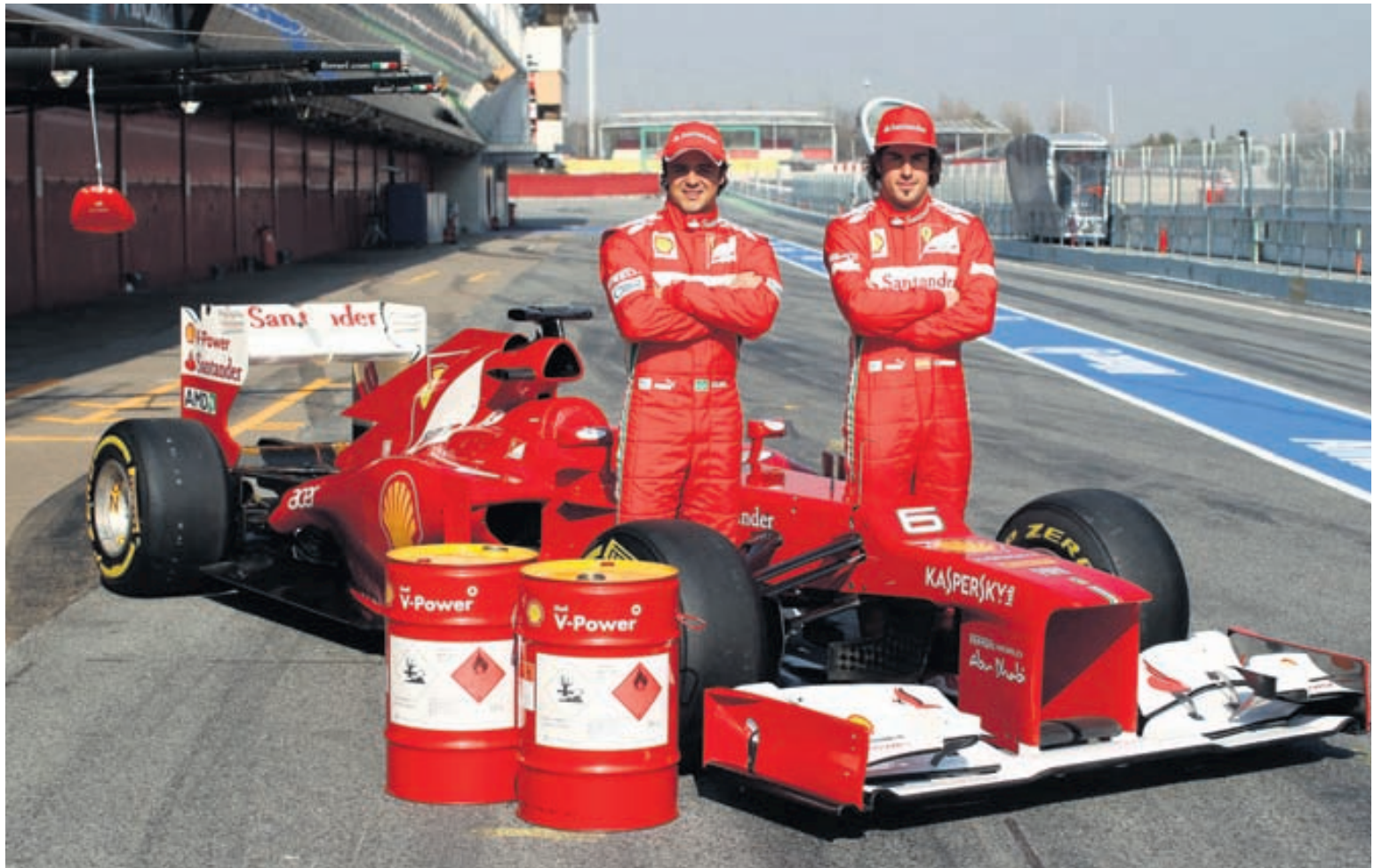
Áratuga samstarf Shell með keppnisliði Ferrari í Formúlu 1 kappakstrinum hefur gefið vísindamönnum tækifæri til að þróa Shell V-Power við mjög krefjandi aðstæður.

Með viðvarandi notkun getur Shell V-Power hjálpað til við að halda nýjum bíl lengur í topp-