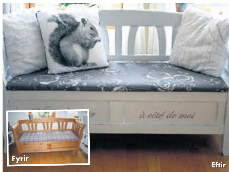
Sænski bekkurinn var málaður með grunni og hann fékk nýtt áklæði.