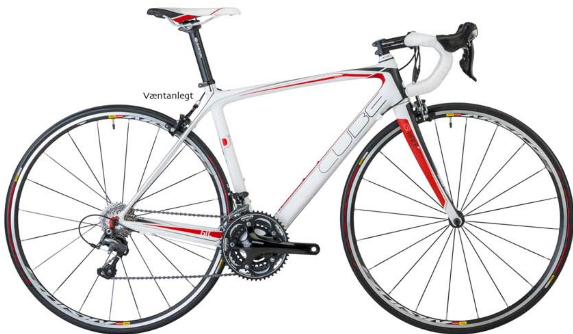
Til afgreiðslu strax