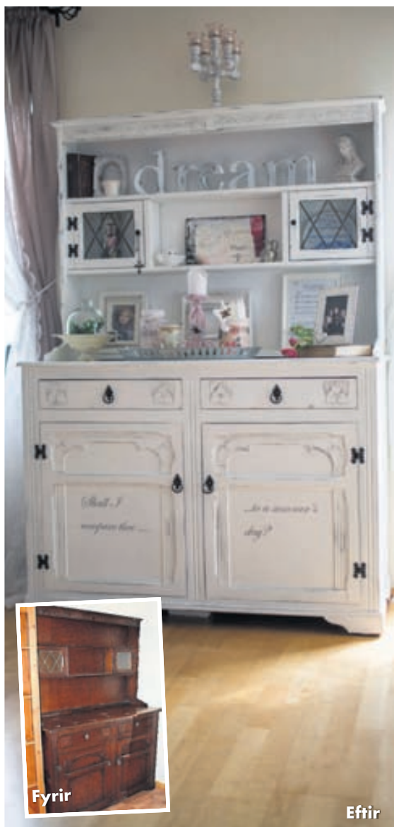
Skápurinn í stofnunni var áður brúnn.