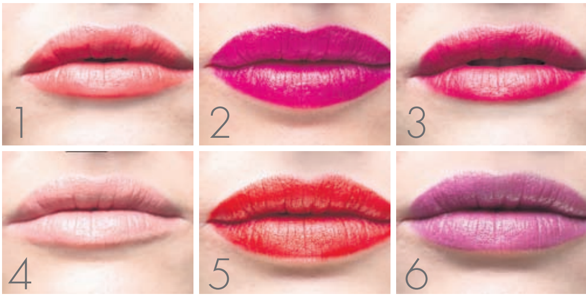
1 SHINE 20 EDITION