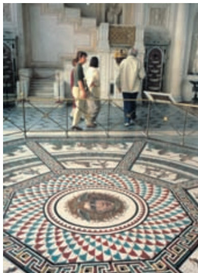
Þjóðminjasafnið í St. Pétursborg er eitt það stærsta og elsta í heimi. Katrín mikla stofnaði það árið 1764 og hefur það verið opið almenningi frá 1852. Hér má sjá fagurlega skreytt flísalagt gólf í Vetrarhöllinni en safnið er að hluta til í henni.