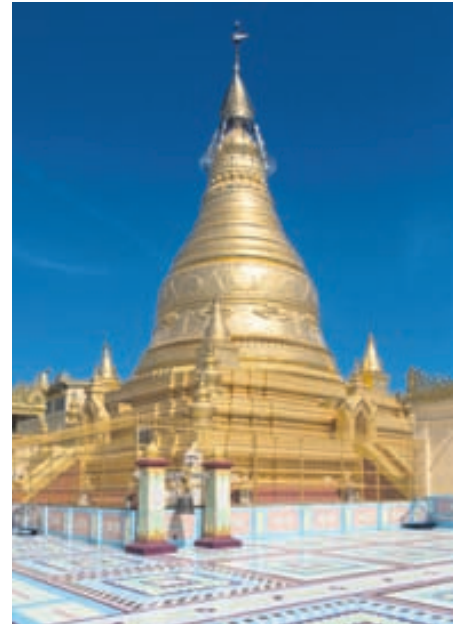
Flísalagt gólf og gylltur turn í U Ponya Shin-pagóðunni í Sagaing-hlíðum í Mjanmar.