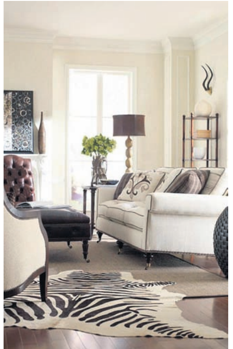
Skinn af sebrahesti þykir fallegt en það er dýrt.