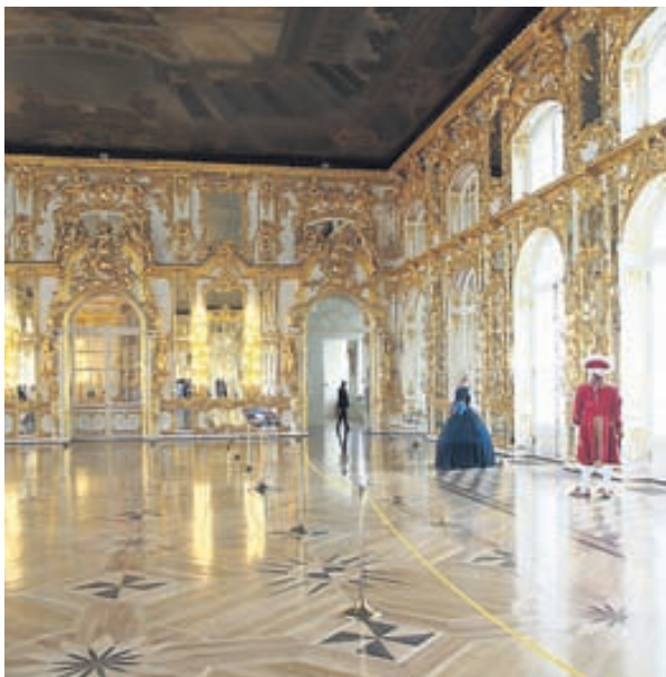
Íburðarmikill salur í Katrínarhöllinni í Tsarskoye Selo í nálægð við St. Pétursborg í Rússlandi. Höllin var sumardvalarstaður Romanov-keisaraættarinnar.