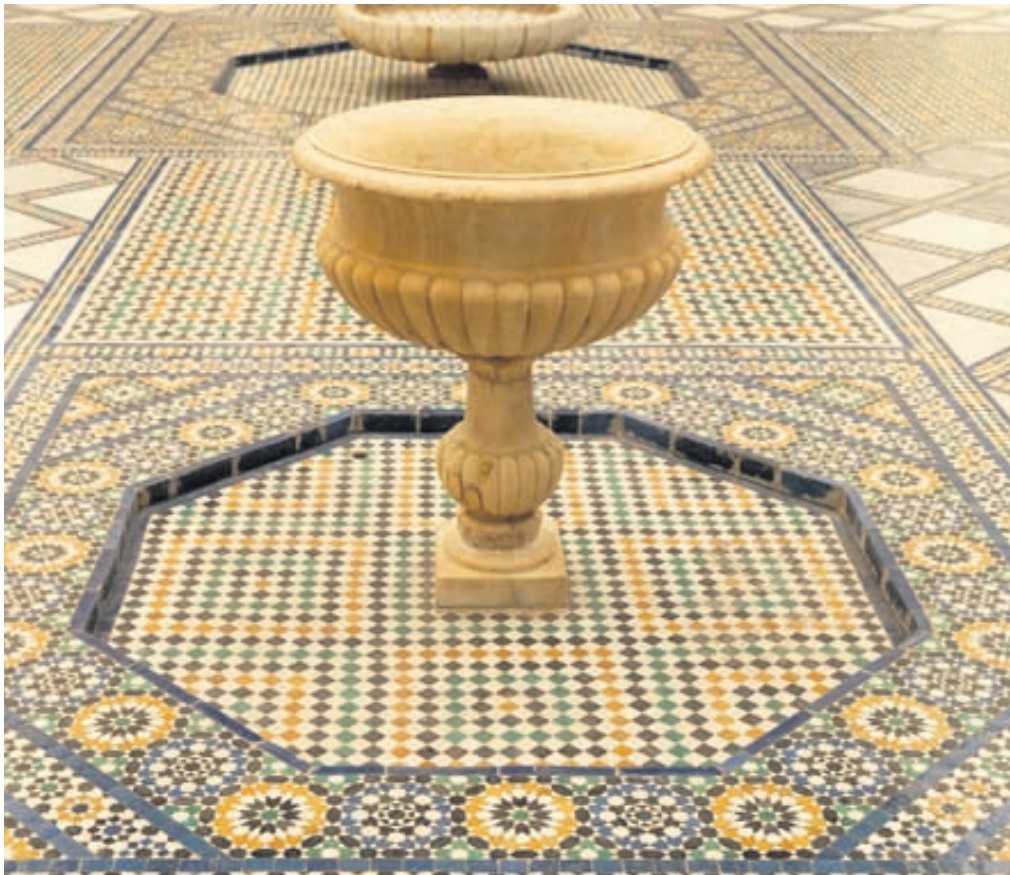
Marrakech-safnið í Marokkó er í Dar Menebhi-höllinni sem byggð var í lok nítjándu aldar. Byggingin endurspeglar andalúsíska arkitektúr með flóknum mynstrum úr flísam á gólfum og veggjum.