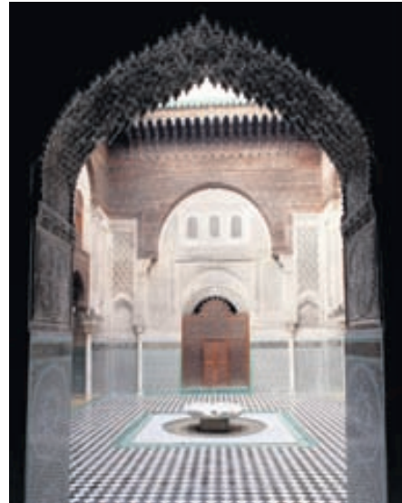
Hin forna bygging Medersa el-Attarine í Fes í Marokkó er trúarleg bygging sem byggð var af soldánum Uthman II Abu Said á árunum 1323-1325. Íburðarmiklar flísar og fagaðar gífs- og sedrusviðarskreytingar einkenna bygginguna.

Flest gólfefni eru hönnuð með endingu og nýtingu í huga. Þó eru til fjölmörg gólf um heim allan sem lögð voru með það markmið að gleðja augað.