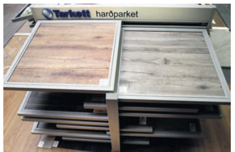
Nýjar gerðir af Tarkett-harðparketi með grófu plankauðliti.

Allar nánari upplýsingar um vörur og þjónustu Álfaborgar má finna á www.alfaborg.is .