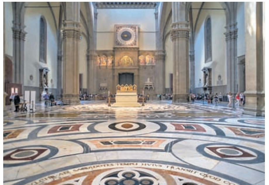
Sögulegar og fagrar byggingar eru á hverju strái í Flórens á Ítalíu. Hér má sjá fagurlega skreytt gólfíð í dómkirkjunni, Santa Maria del Fiore, í Flórens.