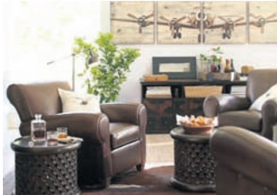
Nautshúð er vinsæl og getur sett fallegan svip á heimilið.