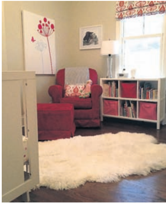
Íslenska gæran hefur aldrei verið vinsælli. Bæði Íslendingar og útlendingar hafa fallið fyrir henni.

Þeir voru margir sem vildu eignast skinnin. Einn kaupandinn sagðist hafa keypt skinn af tígrisdýri þar sem dóttur hans hafði lengi dreymt um að hafa slíkt skinn á baðherberginu sínu.