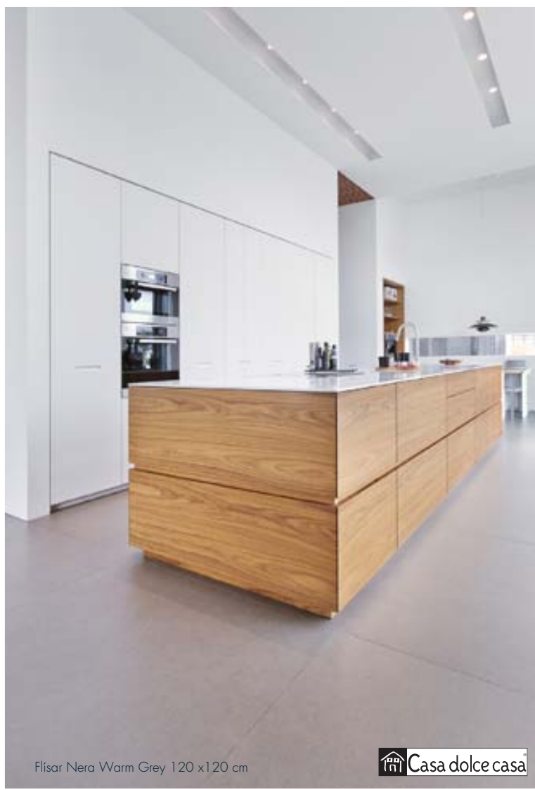
Flísar Nera Warm Grey 120 x 120 cm

„Við bjóðum viðskiptavini velkomna í sýningarsalinn í Ármúla 8. Við kappkostum að aðstoða og leiðbeina viðskiptavinum af fremsta megni. Allar vörurnar sem við bjóðum eru í hæsta gæðaflokki og á samkeppnishæfu verði. Starfsmenn okkar eru til þjónustu reiðubúnir,“ segir Egill hjá Birgisson ehf.