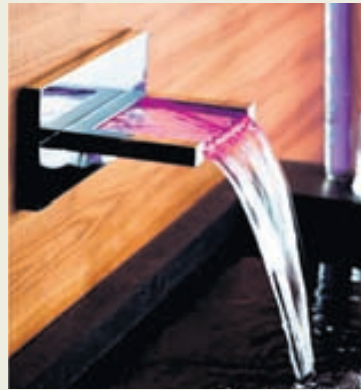
Ekki er gott að gleyma að skrúfa frá krana.

Í flestum nýrri húsum eru niðurföll í baðherbergjum og þvottahúsum en þeim þarf að halda hreinum til að koma í veg fyrir tjón. Ef niðurfallið stíflast gerir það lítið gagn ef flæðir á gólf. Ástæður vatnstjóna geta verið margar, lagnir geta gefið sig eða fólk gleymir óvart að skrúfa fyrir krana. Á veturna getur gert asahláku með þeim afleiðingum að það flæðir inn í hús. Óhöppin gera sjaldnast boð á undan sér og því er mjög gott að vera vel varinn.