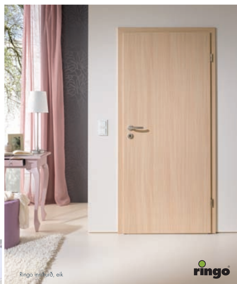
Ringo innihurð, eik