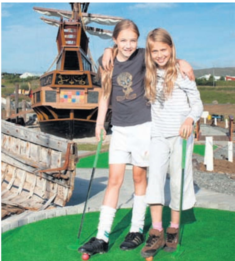
Minigolf fyrir allan aldur.