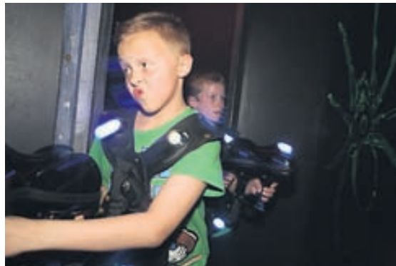
Spenna og einbeiting leynir sér ekki í andlitum þátttakenda í Laser Tag.