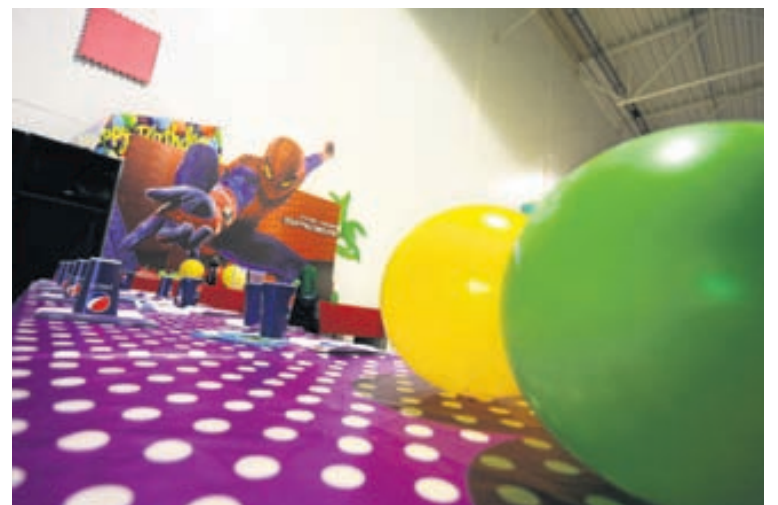
Frábær aðstaða fyrir afmæli. Verð á barn er 1.200 krónur með veitingum.

Einnig er hægt að koma með eigin veitingar í afmælið og kostar veislan þá 900 krónur á barn. Gott er að panta afmæli með viku fyrir-