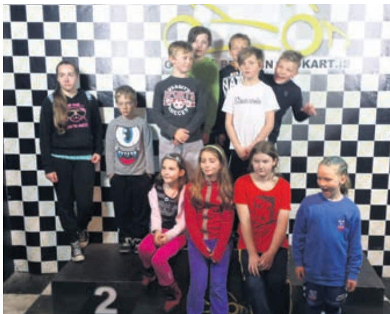
Eftir veitingarnar stilla börnin sér upp fyrir myndatöku.