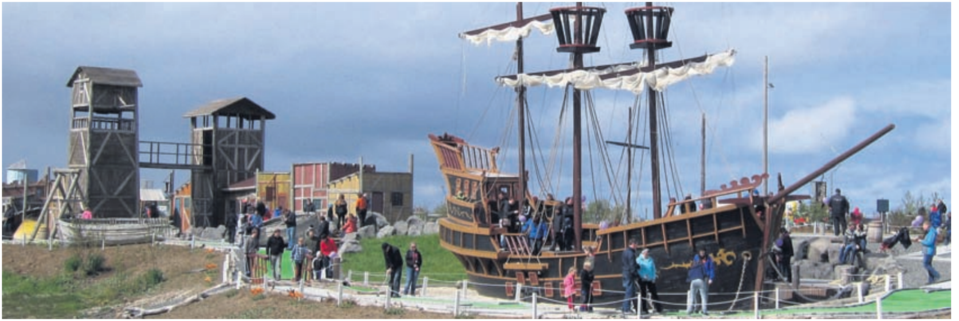
Spilað er í gegnum sjóræningjaborpið (sjá vinstri) og í kringum sjóræningjaskipið.