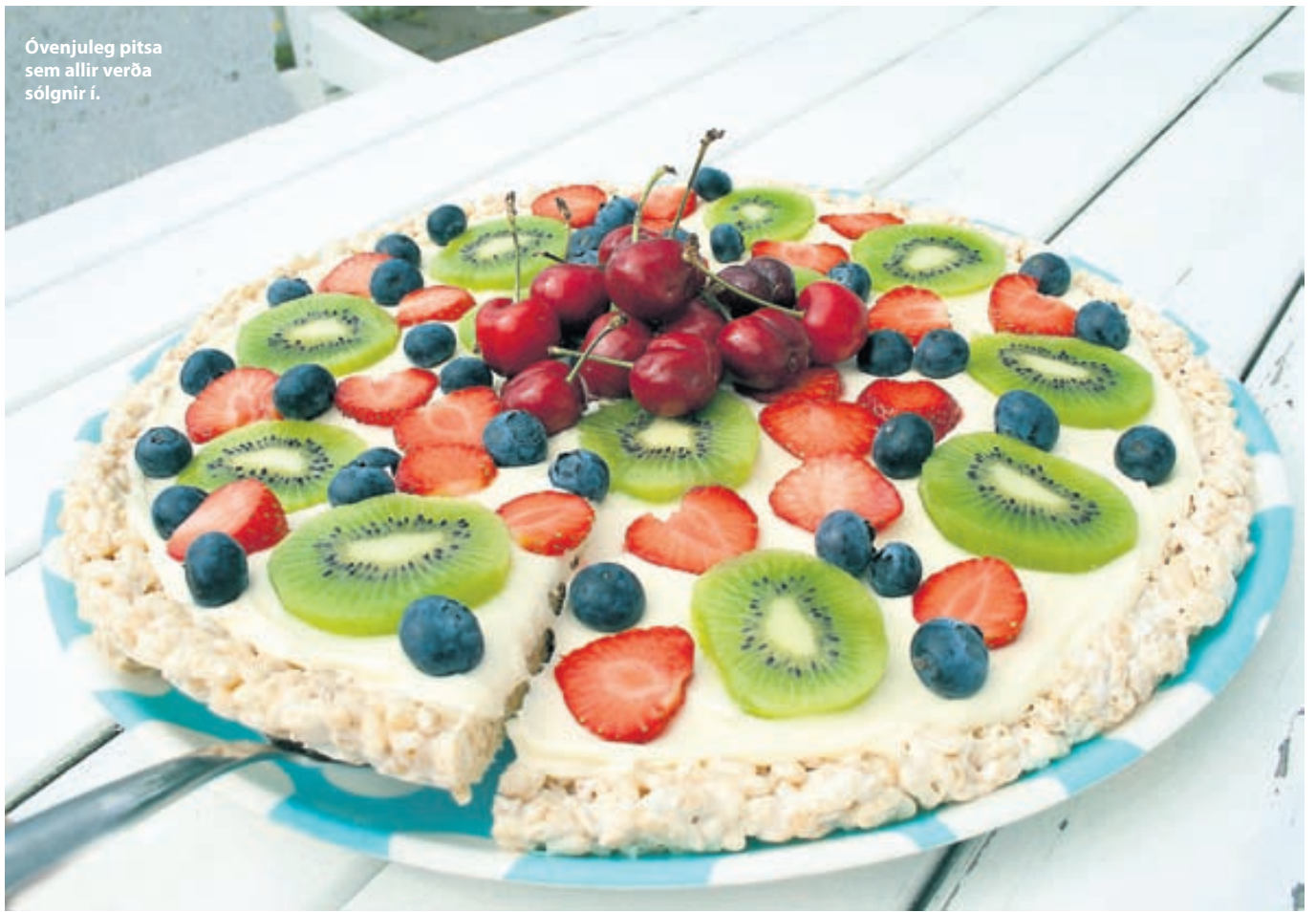
Óvenjuleg pitsa sem allir verða sólgirnir í.

Skreytt með ferskum ávöxtum og berjum að vild.