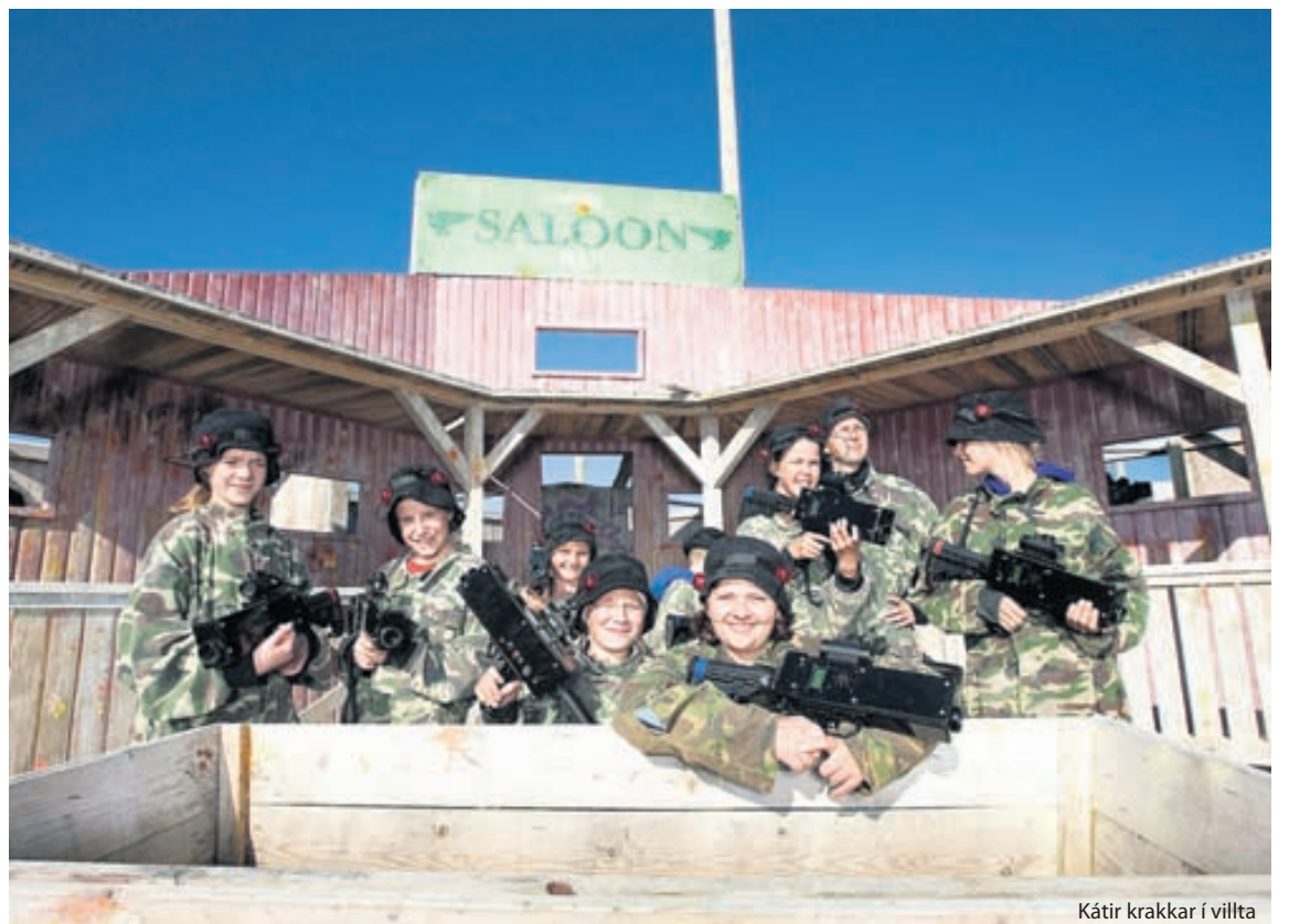
Kátir krakkar í villta vestrinu.