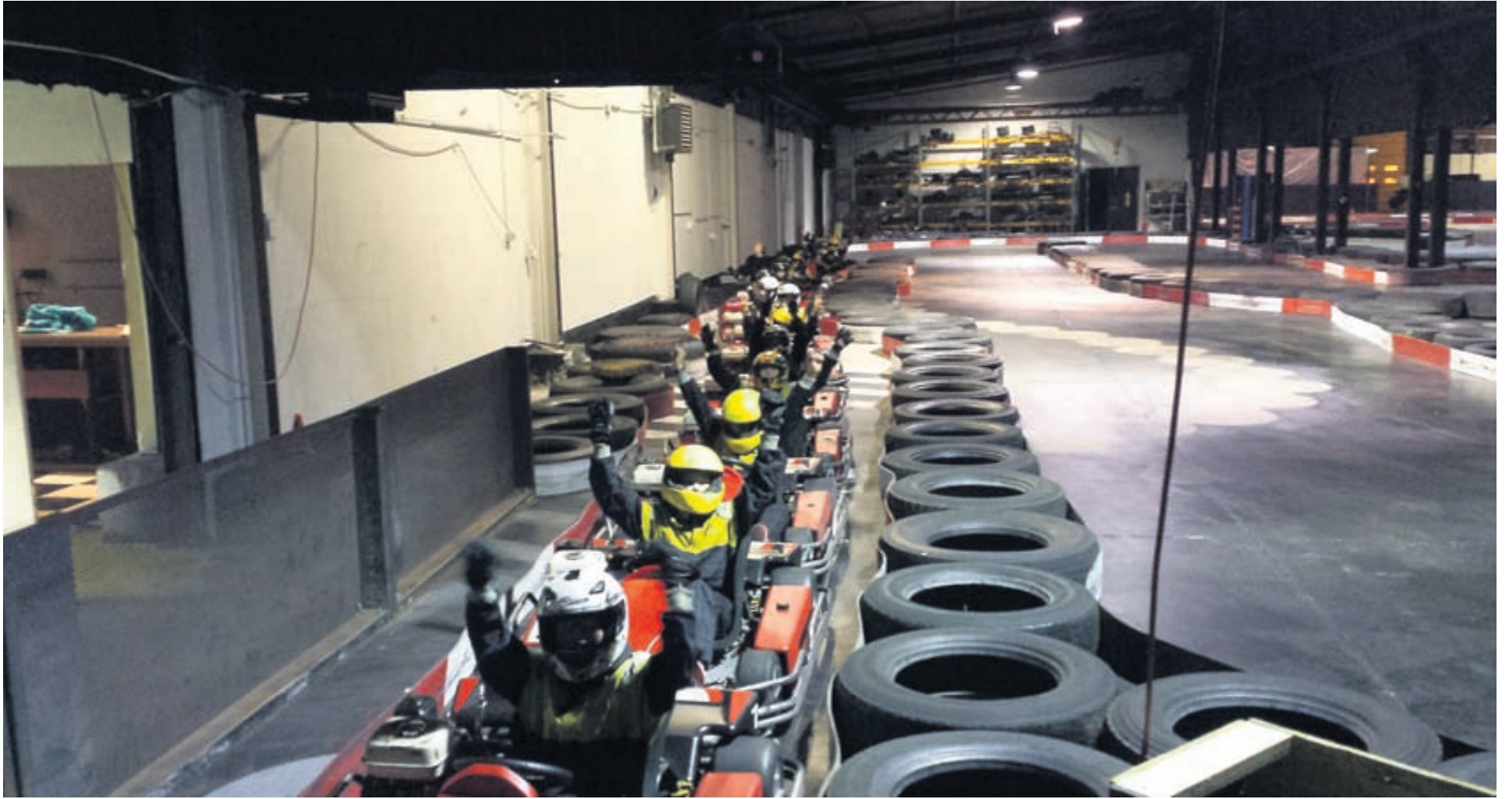
Afmælisbarnið skemmtir sér vel á gokart-brautinni með félögum sínum.