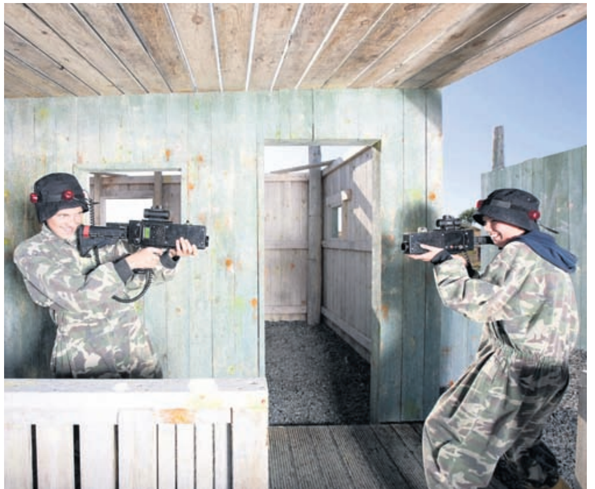
Það vilja allir standa uppi sem sigurvegarar.

Í Skemmtigarðinum er opið allan ársins hring. Allar nánari upplýsingar er að finna á www.skemmtigarður.is/grafarvogur/ eða í síma 587 4000.