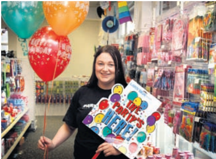
Í versluninni er að finna afmælisborðbúnað og tilheyrandi í miklu úrvali fyrir alla aldurshópa.

Partýbúðin var fyrsta verslunin á Íslandi sem flutti inn hinar vinsælu Wilton-bökunarvörur. „Nú eru þær fánlegar í ýmsum stórmörkuðum og höfum við því ákveðið