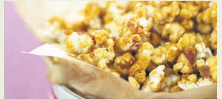
Einfalt og ódýrt afmælisnakk.