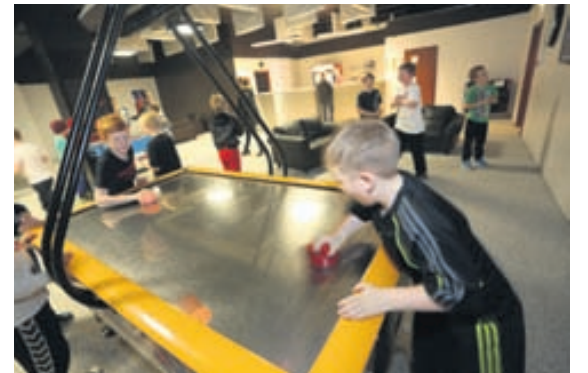
Í Laser Tag er gnótt skemmtilegrar afþreyingar fyrir afmælisgesti.