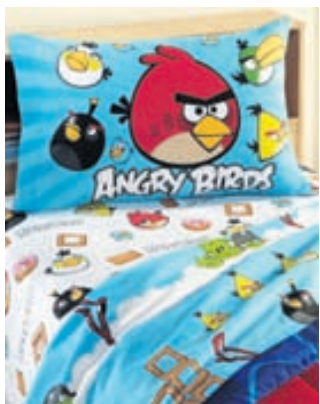
Angry Birds þekkja allir krakkar.

Náttföt, fatnaður, skór eða húsgögn, gluggatjöld og teppi. Allt er til með myndum af þekktum kvikmyndastjörnum.