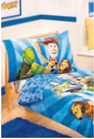
Hver vill ekki hafa Vidda, Bósa og Dísu í herberginu sínu?