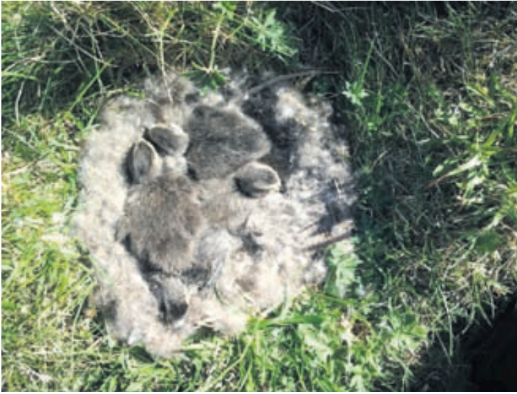
Æðarfugl kemur jafn mörgum ungum á legg, hvort sem hann fær að halda dún sínum alla áleguna eða fær hey í hreiðrið eins og tíðkast við dúntekju.