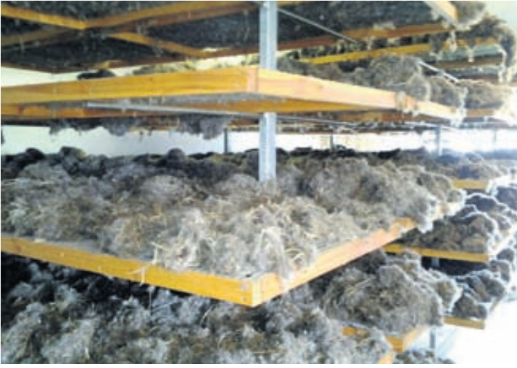
Dúnninn er hitaður, krafsaður, fjaðurtíndur, sápuþveginn og þurrkaður í dúnframleiðslunni.