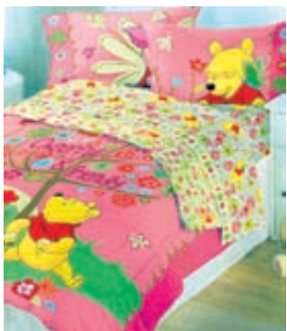
Bangsímón er alltaf vinsæll hjá yngstu kynslóðinni.