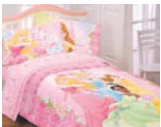
Fyrir litlar prinsessur.

Börnin heillast af ákveðnum persónum úr Disney-myndunum. Viddi, Bósi og Dísu úr Toy Story heilla öll börn, hvort sem það eru strákar eða stelpur. Prinsessumyndir höfða yfirleitt frekar til stelpnanna en Bílar, Flugvélar og Skrímsli til stráka. Þannig erum við bara þótt margir myndu vilja breyta því.