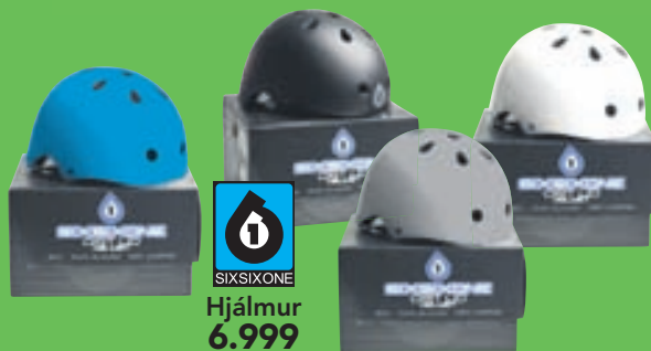
SIXSIXONE Hjálmur 6.999

FRÍ YFIRFERÐ & ÁSTANDSSKOÐUN** ÞJÓNUSTA & GÆÐI