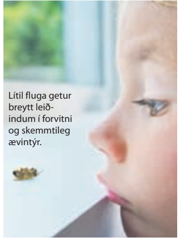
Lítill fluga getur breytt leiðindum í forvitni og skemmtileg ævintýr.

● Bakið sykursæta sumarköku og leyfið börnunum að hjálpa til við baksturinn.