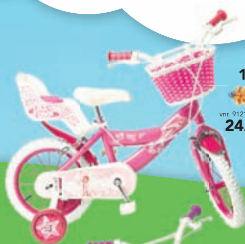
14" vnr. 912192, 912191 24.999