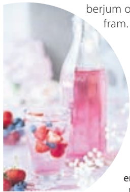
Girni- legur sumar- drykkur sem einfalt er að gera.