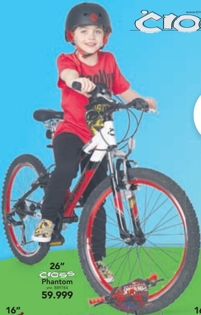
26" Cross Phantom vnr. 889784 59.999