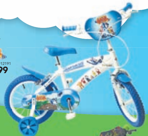
16" TURTLES vnr. 912190 29.999