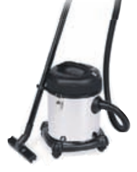
Drive Biskúrsryksugan 1200W, 20 lítrar 7.490,-