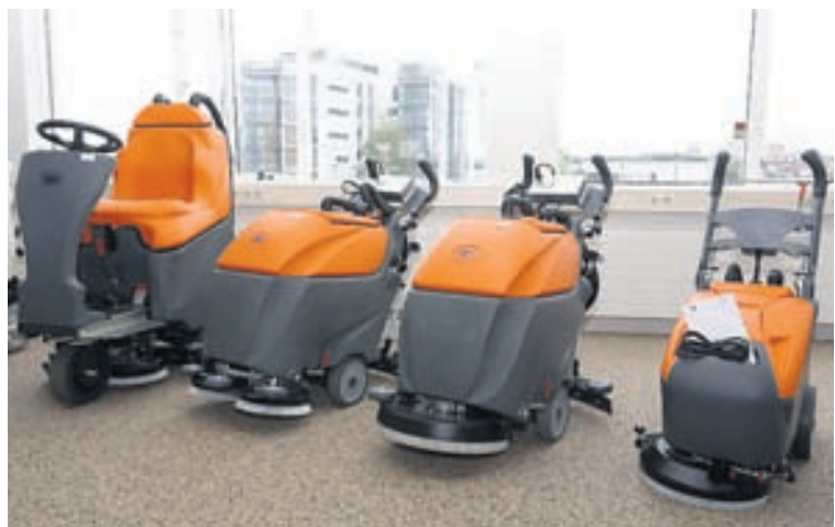
Marpól selur vélar til stofnana og fyrirtækja.