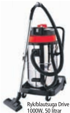
Ryk/blautsuga Drive ZD10-50L 1000W, 50 lítrar 28.900,-