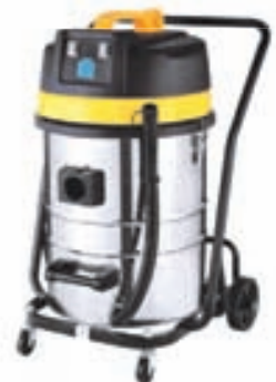
Ryk/blautsuga Drive ZD98A-2B 2000W, 70 lítrar 44.900,-