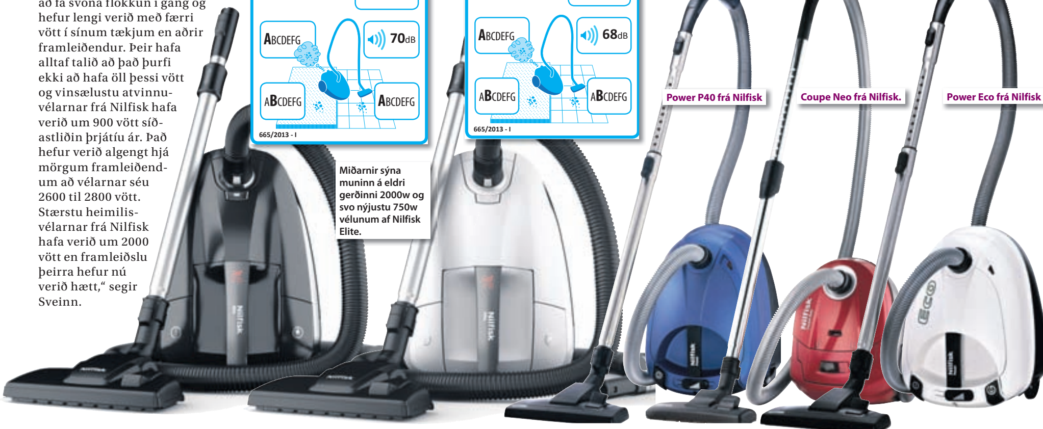
Power Eco frá Nilfisk