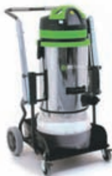
Soteco Topped 515, Longo pac 165.990,-