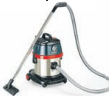
Arges HKV-100GS15 1000W, 15 lítrar 25.900,-