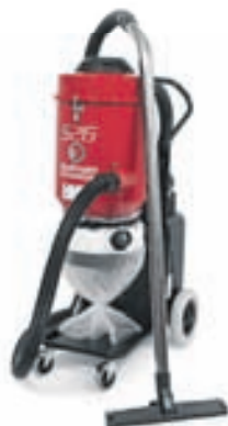
Ermator Pullmann S13 1300W 254.600,-