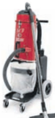
Ermator Pullmann S26 2600W 349.900,-