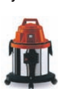
Soteco Base XP 315 1300W 35.990,-