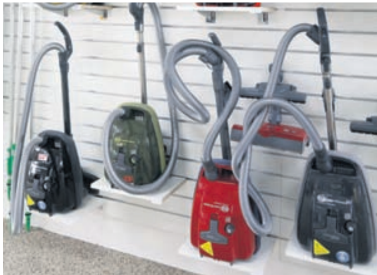
Heimilisryksugurnar frá Sebo eru búnar góðu filterkerfi og henta fólki með ofnæmi. Sérstakur stuðpúði er utan um vélarnar sem takmarkar skemmdir á húsgögnum og innréttingum.