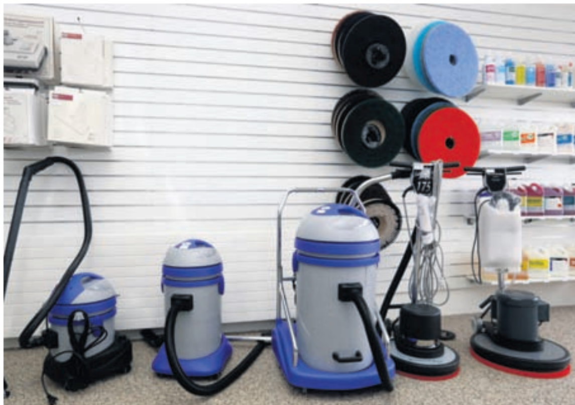
Ryksugurnar frá Sebo þarf ekki að endurnýja fyrr en eftir 10 til 20 ár að sögn Gunnars. Gott úrval af fylgihlutum, stútum og burstum fæst í versluninni.