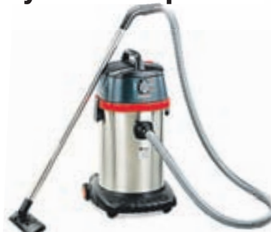
Arges HKV-100GS30 1000W, 30 lítrar 29.900,-