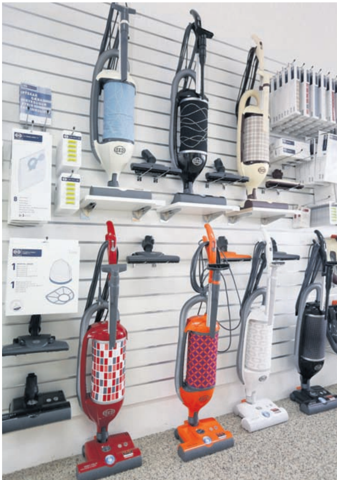
Sebo Felix-ryksugan er vinsæl í brúðkaups- og innflutningsgjafir. Hún er eina burstaryksugan á markaðnum með liðamótum á haus svo auðvelt er að ryksuga í hornum og undir húsgögnum.

Allar nánari upplýsingar er að finna á heimasíðunni www.marpol.is .