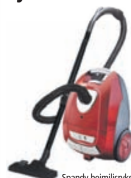
Spandy heimilisyksuga 1600W, HEPA Plter 6.690,-