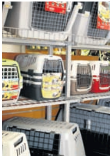
Lífland er með eitt besta úrval hunda- og kattabúra á landinu. Þar má fá stór sem smá búr bæði í bíl og á heimili.