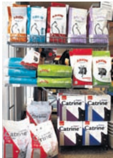
Arion-línan er afar fjölbreytt og hægt að fá fóður eftir aldri, þyngd og eftir því hve hundurinn er hreyfður mikið.