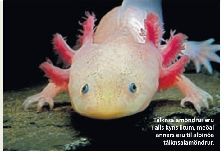
Tálksalamöndrur eru í alls kyns litum, meðal annars eru til albinóa tálksalamöndrur.

Tálksalamöndrur geta orðið allstórar eða um þrjátíu sentimetrar. Þess má geta að þær fást í gæludýrabúðum héraendis.