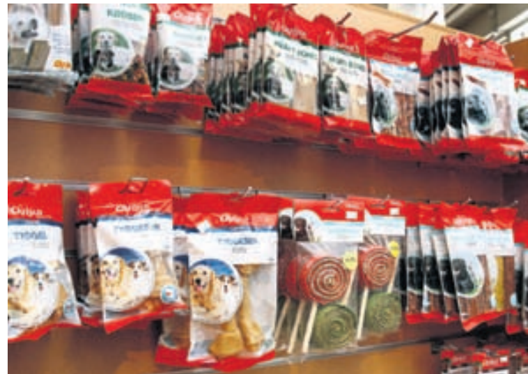
Chrisco-gæludýranammið er vinsælt meðal okkar ferfættu vina. Á laugardögum er 50% afsláttur af öllu Chrisco-nammi í Líflandi.