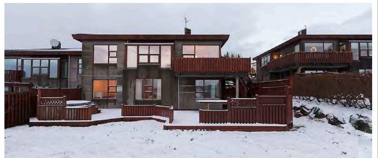
Parhús við Bakkahjalla í Kópavogi er til sölu.

Eldhúsið er stórt, flísalagt og með mjög fallegum eikarinnréttingum og eyju. Quartz er á borðum og vönduð Smeg tæki, m.a. spanhelluborð með hangandi háfi yfir og örylgjuofn. Innbyggð uppvottavél. Mjög rúmgóð borðaðstaða er í eldhúsi og útgengi á svalir til vesturs og suðurs.