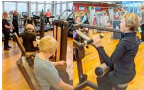
Styrktarþjálfun í World Class tvisvar sinnum í viku.

Þjálfunin sjálf hefur annars vegar verið