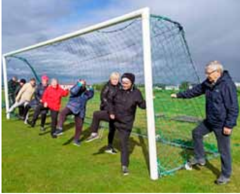
Upphitun og liðleikaæfingar á Valhúsarhæðinni.

Innleiðingin sem hófst í byrjun sumars gekk mjög vel, bæði mælingar á hópnum sem framkvæmdar voru í íþróttahúsinu sem og þjálfunin. Skráðir