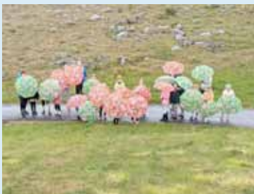
Fimleikakrakkar af Nesinu. Að þessu sinni undir berum himni.

Mikið líf og fjör er búið að vera í fimleikasalnum í hjá Gróttu í allt sumar. Keppnishópar í áhaldafimleikum og hóp fimleikum hafa verið að æfa mest allt sumarið. Fimleika- og leikjaskólinn var á sínum stað en haldið voru 8 námskeið í sumar. Iðkendur voru í fimleikum fyrir hádegi og eftir hádegi var fjölbreytt dagskrá þar sem meðal annars var farið í hjólaferð, sundferð og fjöruferð.