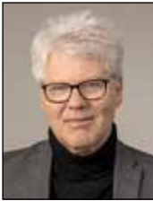
Guðmundur Andri Thorsson.

Guðmundur Andri Thorsson og þingmaður Samfylkingarinnar í Suðvesturkjördæmi og skipar annað sæti listans í komandi kosningum