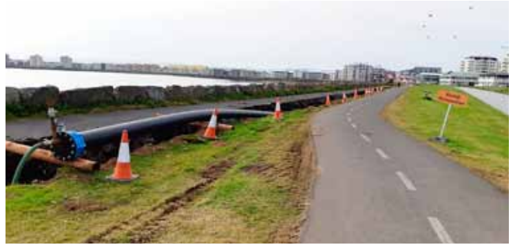
Fráveiturör bíða þess að verða lögð í jörð við Norðurströnd.

Fráveita bæjarins er í umsjá Bygginga- og umhverfissviðs og Áhaldahús Seltjarnarness sér um daglegan rekstur og viðhald.