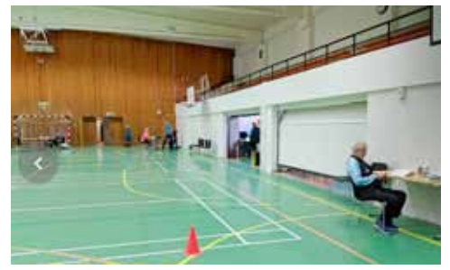
Fjölbreyttar mælingar framkvæmdar í íþróttahúsinu.

Það er ánægjulegt hversu vel heilsueflingin hefur gengið sem án efa skilar sér í aukinni orku og bættri líðan þátttakenda.