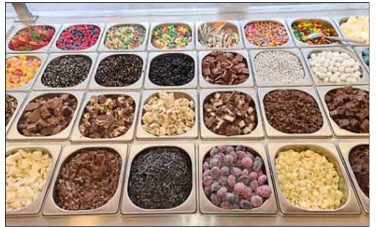
Margar tegundir góðgætis eru fánlegar með Brynjuísum.

miðja síðustu öld. Brynjuísinn í Hólagarði er framleiddur í Engjahjalla og engin aukaefni eru notuð. Segja má að hann komi beint