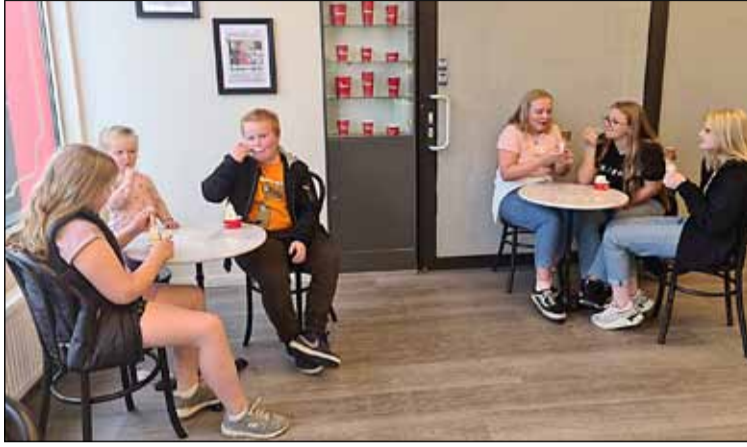
Unga fólkíð nýtur lífsins og borðar Brynjuís.

Brynjuís er löngu landsþekkt lostæti og varla farið sá ferðalangur um Akureyri án þess að koma við í Brynju í innbænum og fá sér ís bragð. Heimamenn hafa líka oft staðið í röðum fyrir utan íbúðina. Brynja er ein af elstu og þekktustu ísbúðum landsins. Hún var fyrst opnuð árið 1939 sem lítil kjörbúð á Akureyri og varð fljótt þekkt innan bæjarins og síðar út fyrir bæjarmörkin vegna ferska íssins sem þar var seldur. Alla tíð