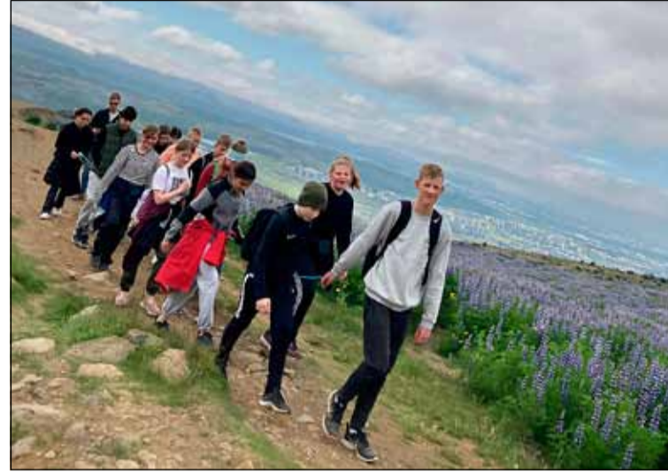
Krakkar úr áttunda bekk í gönguferð.

útilegu félagsmiðstöðvanna í Breiðholti. Útilegan í ár var virkilega vel heppnuð og fóru rúmlega 100 unglingar og starfsfólk úr Bakkanum, Hólmaseli og Hundrað og Ellefu saman í Borgarfjörð,