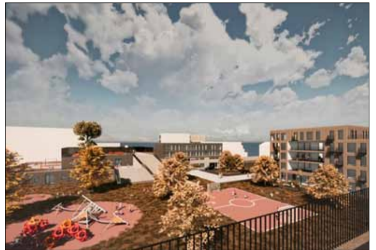
Sumarstemning eins og hönnuðir sjá Fellagarða fyrir sér í framtíðinni.

Í hinu nýja skipulagi Arnarbakkans er meðal annars kveðið á um að verslun og þjónusta verði í hverfiskjarnanum. Þar er gert ráð fyrir stórra matvöruverslun og fjölbreyttri verslun og þjónustu sem geti þjónað heilu hverfi. Veitingastaðir verða heimildir og íbúðir verða á efri hæðum bygginga. Í skipulaginu kemur fram að byggingar munu taka mið af núverandi byggð og fléttast áreynslulaust inn í byggðamynstrið. Græn svæði verða betur skilgreind með skýr hlutverk. Bjart og skjólríkt torg mun verða við verslanir til að auka aðdráttarafl. Bent er á að verslun og þjónusta, gróðurhús, matjurtagarðar og íbúðir á stúdentagörðum, sem og aðrar íbúðir, muni verða vinsæl innan og utan hverfis. Skipulagði gengur út á vistvænar ferðavenjur þar sem stutt verður í hágæða