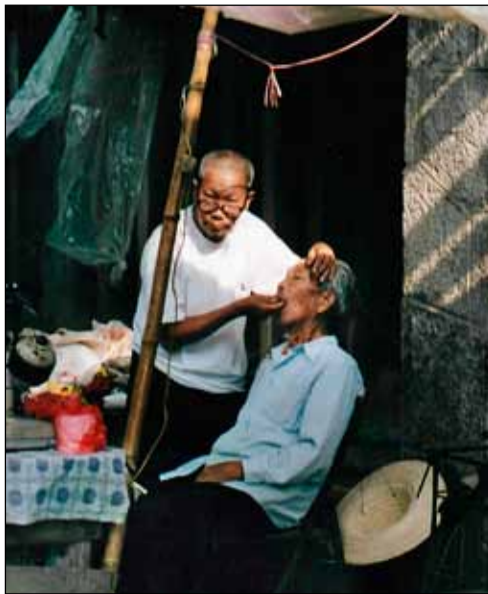
Tannlækningastofa í Kína. Tannlæknirinn var ekkert hrifinn að ég væri að taka myndir af honum. Hann hljóp á eftir mér og ætlaði að ná myndavélinni. En ég hvarf í mannfjöldann.