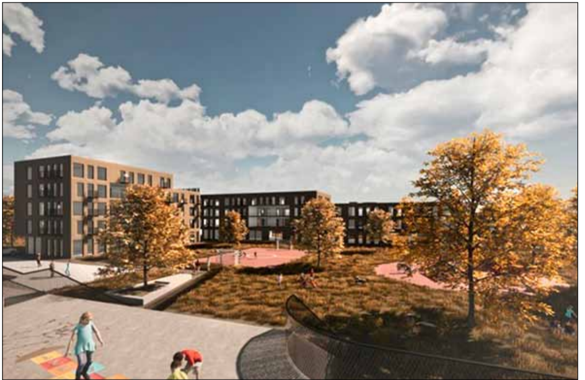
Umhverfi eins og gert er ráð fyrir við Arnarbakkann að lokinni uppbyggingu.

Miklar breytingar munu verða í hverfiskjörnunum í Breiðholti á næstu árum. Í nýju skipulagi Breiðholts er gert ráð fyrir svo miklum umsvifum að svæðin munu verða nánast óþekkjanleg frá því sem nú er. Ekki þarf að fara mörgum orðum um þá niðurníðslu sem margra ára stöðnum hefur haft í för með sér. Atvinnustarfsemi dróst saman og hvarf sumstaðar að mestu og atvinnuhúsnæði sem ekki var alltaf vandað nægilega vel til í upphafi tók að grotna niður. Þjónustukjarninn við Arnarbakka hefur farið einna verst út úr þeirri hugmyndafræði afskiptaleysis sem lengi ríkti um Breiðholtið.