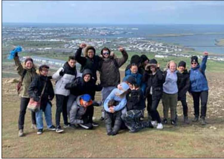
Frá vel heppnaðri útilegu í sumar.

Einnig voru starfræktir þrjár sumarvinnuhópar fyrir unglinga í 8. og 9. bekk í öllum félagsmiðstöðvum í Breiðholti, blandaður 8. bekkjarhópur úr Bakkanum, Hólmaseli og Hundrað og Ellefu, og 9. bekkjarhópar bæði í Hólmaseli og blandaður hópur úr Bakkanum og Hundrað og Ellefu. Markmiðið með hópunum var að efla sjálfstraust, samvinnuhæfni og núvitund barna. Hóparnir