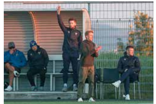
Þjálfarateymi meistaraflokks karla í knattspyrnu hjá Gróttu.

félaginu í vetur eftir góða frammistöðu í sumar en það kemur maður í manns stað. Við munum æfa eins og brjálaðingar og ætlum okkur að vera með samkeppnishæft lið sem vinnur helling af leikjum. Hverju það skilar nákvæmlega kemur svo í ljós.