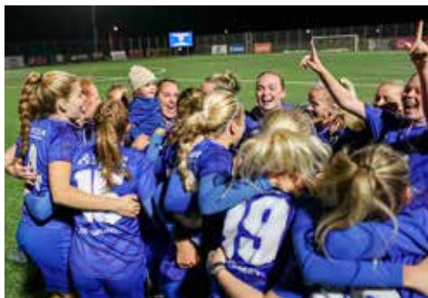
Gróttustelpurnar fagna sæti í Lengjudeildinni.

það var hins vegar lið Fram sem kom á óvart og vann fyrstu átta leiki sína. Fljótlega var ljóst að Fram kæmist upp um deild og þá var aðeins eitt sæti laust. Eftir góða byrjun fór að halla undan fæti hjá Gróttukonum og tap gegn Völsungi í byrjun júlí þýddi að var liðið komið með bakið upp að vegg.