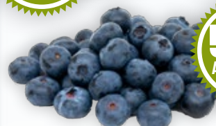
Bláber (125 g)