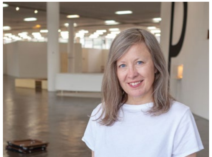
Myndin er birt með leyfi listakonunnar og Sao Paulo Tvíæringnings