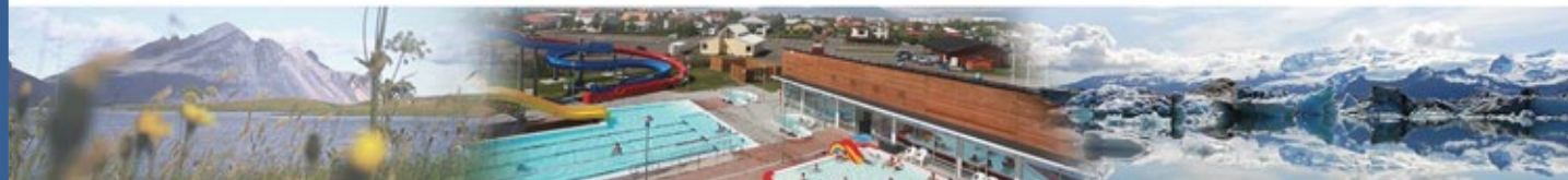
Sveitarfélagið Hornafjörður / Hafnarbraut 27 / S: 4708000 / www.hornafjordur.is