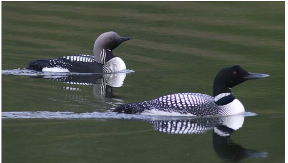
Frændurnir Glitbrúsi(t.v) og Himbrimi(t.h). En Himbriminn er einn þeirra fugla sem hægt er að velja sem fugl ársins 2021.

Þeir 20 fuglar sem keppa um titilinn í ár hafa allir orðið sér úti um kosningastjóra. Það er fjölbreyttur og fagur hópur fólks úr öllum áttum og á öllum aldri sem hefur tekið að sér að stýra oddaflugi hinna fuglanna í keppninni. Margir hafa komið upp samfélagsmiðlasíðum fyrir fuglana sína sem Fuglavernd hvetur fólk eindregið til að fylgja.