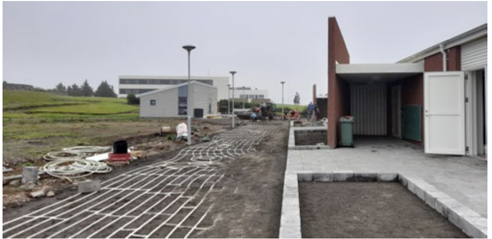
Verið er að ljúka framkvæmdum á lóð nýs húsnæðis velferðarsviðs

samkomulag eftir skilnað (SES) sem felur í sér ráðgjöf í skilnaðarmálum, forsjár- og umgengismálum, barnanna vegna.