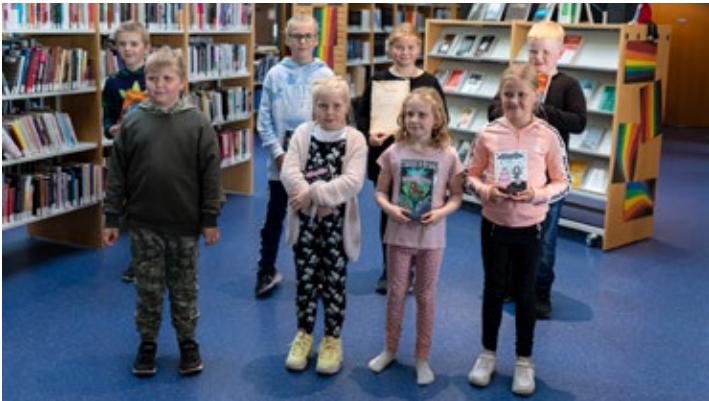
Hér má sjá alla vinningshafana