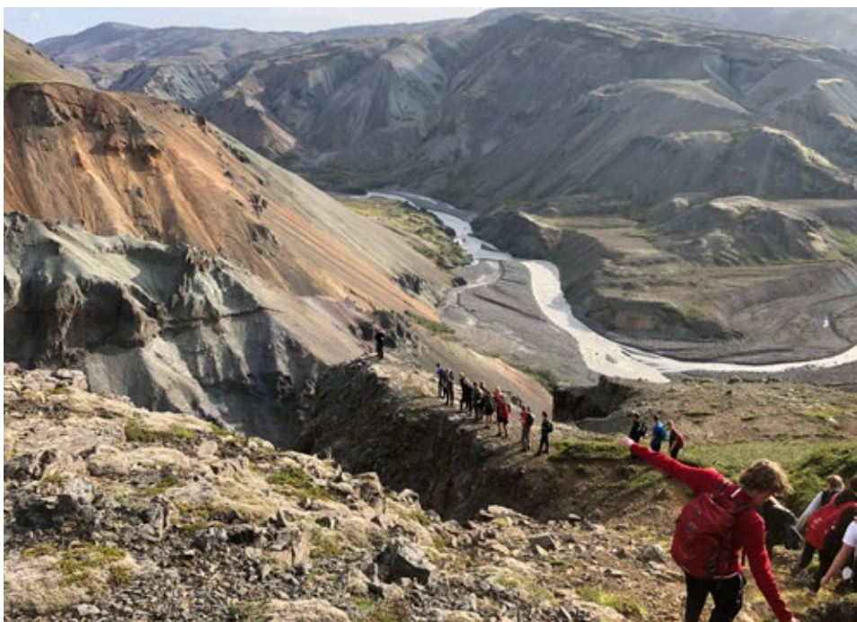
Náttúran er stórbrotin