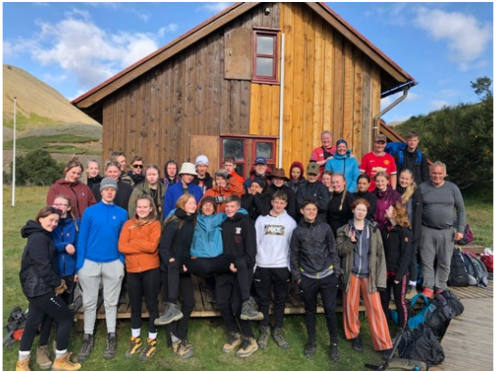
Hópurinn fyrir utan Múlaskála