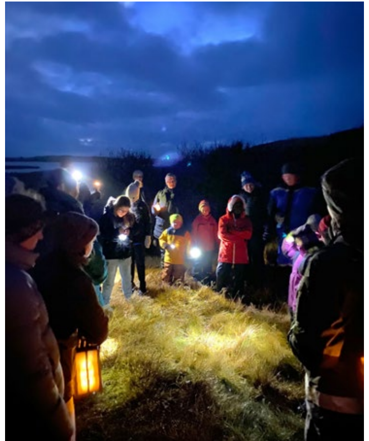
Við Óslandstjörn.

Margir ungir þátttakendur voru með í för og því var endað á umfjöllun um að hræðsla væri ein af grunntilfinningum manneskjunnar og hluti af varnarviðbrögðum hennar. Börnin voru dugleg að koma með leiðir til að takast á við hræðsluna; ljós, mamma og pabbi, vinir og að tala um hvernig manni líður. Landverðir þakka kærlega fyrir þátttökuna í myrkragöngunni og senda ljóskveðjur inn í veturinn sem framundan er.