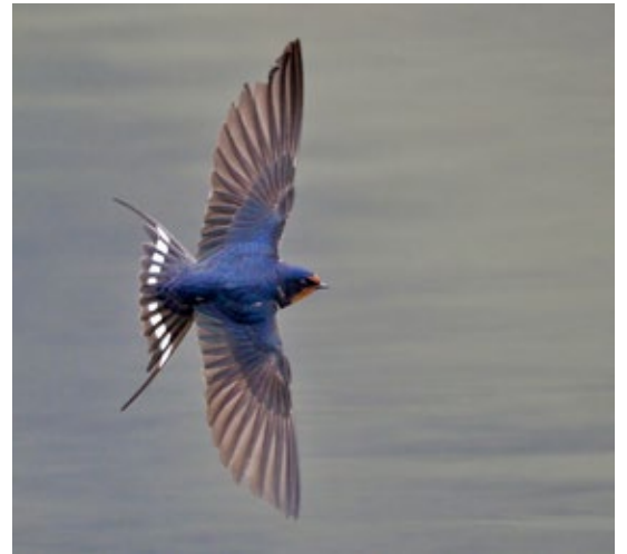
Landsvala. Önnur heiti fuglsins eru svo hagasvala, hússvala og svala.

Bókin er í litlu og handhægu broti og það er Bókautgáfan Hólar ehf. sem gefur hana út.