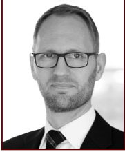
Frímann 897 2468