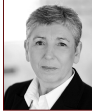
Ólöf 898 3075

Stapahrauni 5, Hafnarfirði Sími: 565 9775 www.uth.is - uth@uth.is