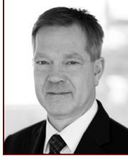
Hálf dán 898 5765