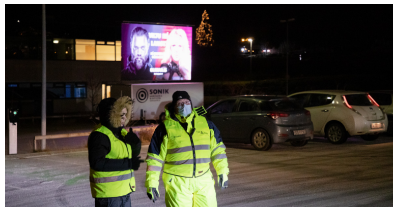
Myndir: Eva Ágústa