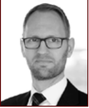
Frímann 897 2468