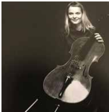
▲ Komin með selló sem átti eftir að eiga stóran þátt í að gera Hildi heimsfræga.