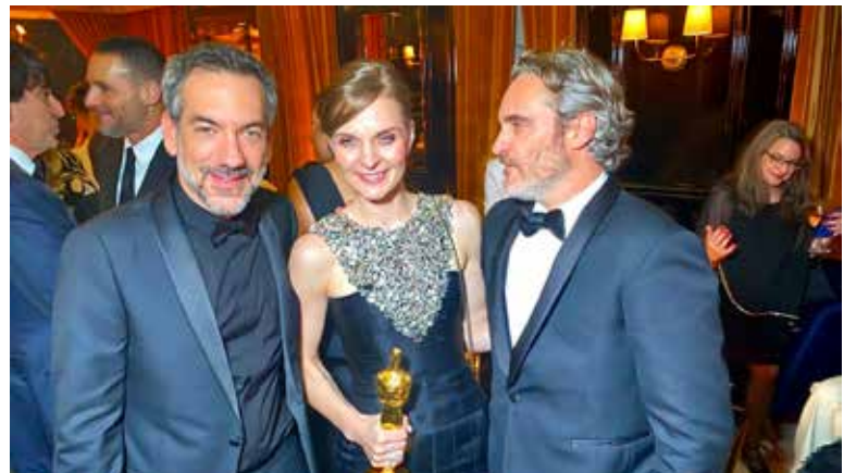
Hildur ásamt leikstjóra og framleiðanda Joker, Tod Phillips og leikaranum Joaquin Phoenix.

Hamingjan er Hildi hugleikin og hún segir hana í raun vera lykilinn að veltgengni. „Það er mikilvægast af öllu að eiga hamingjusamt líf og líka vel við sjálfan sig. Reyna að hafa það að leiðarljósi að hafa gaman af því sem maður færst við hverju sinni. Líka heima hjá sér. Eyða ekki of miklum tíma í það