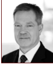
Hálf dán 898 5765