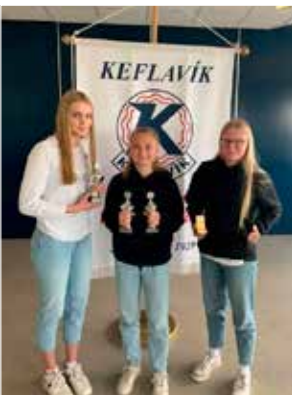
9. bekkur stúlkna.