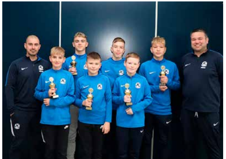
4. flokkur drengja