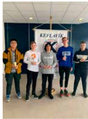
9. bekkur drengja