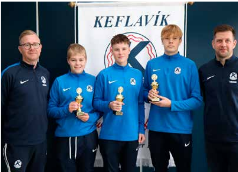
3. flokkur drengja yngri