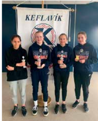
7. bekkur stúlkna.

Auk verðlauna fyrir mestu framfarir, besta varnarmanninn og besta leikmanninn þá voru einnig veitt sérverðlaun fyrir það að