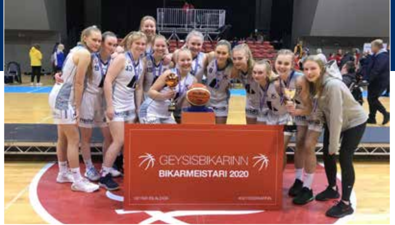
10. flokkur stúlkna bikarmeistarar 2020

Barna- og unglíngaráð Körfuknattleiksdeildar: