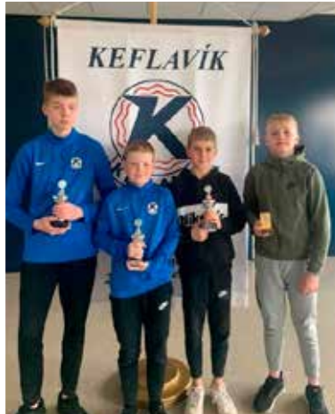
7. bekkur drengja

Nettómótið hefur verið haldið með góðum styrk frá Nettó og svo hefur Reykjanesbær lánað út öll íþróttamannvirki, sem og grunnskóla til gistingar fyrir iðkendur. Auk þess koma fjölmörg önnur fyrirtæki í Reykjanesbæ að mótinu með beinum og