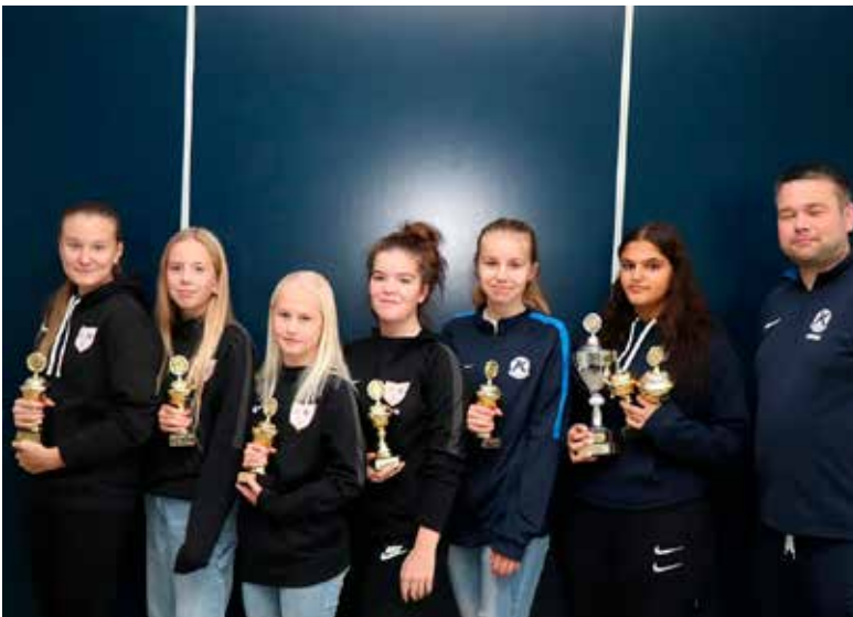
4. flokkur flokkur stúlkna