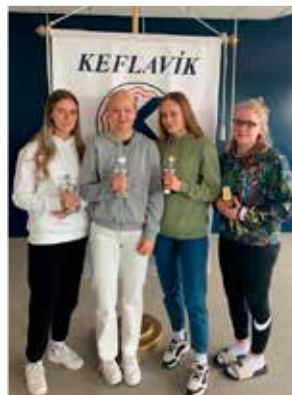
10. bekkur stúlkna