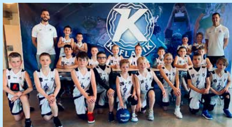
5. og 6. bekkur drengja