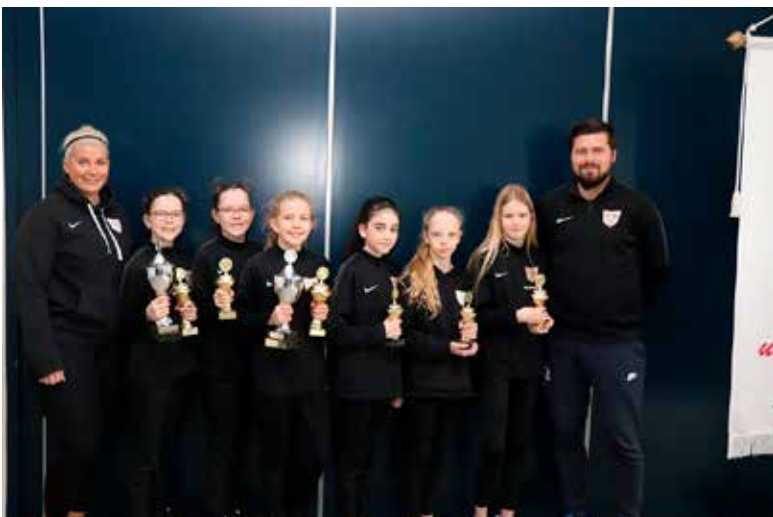
5. flokkur flokkur stúlkna