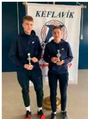
10. bekkur drengja