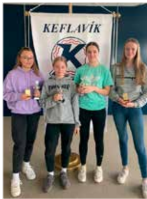
8. bekkur stúlkna