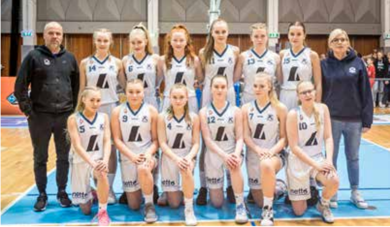
9. flokkur stúlkna bikarmeistarar 2020