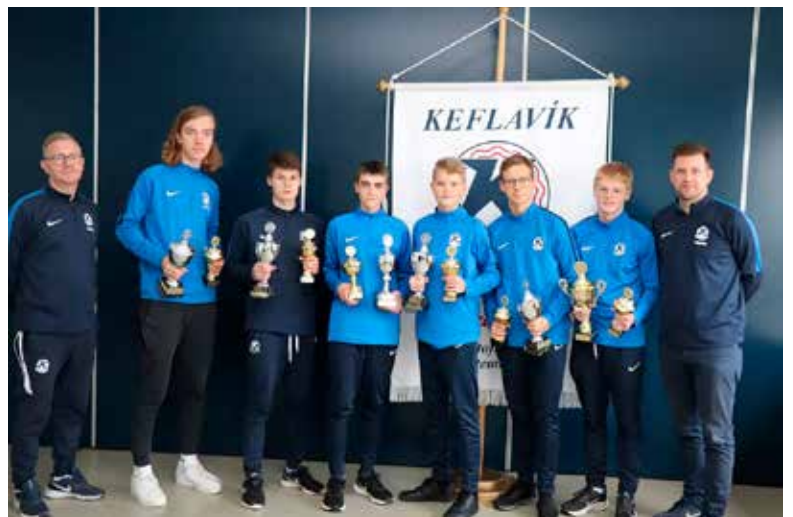
Bestu leikmenn drengja