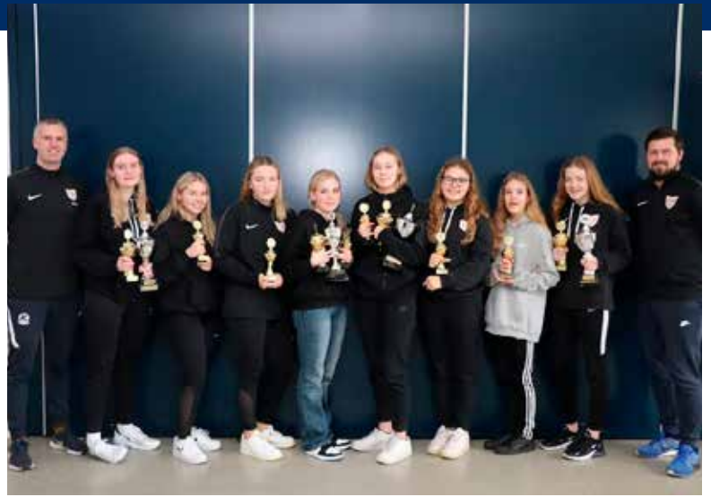
3. flokkur stúlkna ásamt nokkrum af bestu leikmönnum stúlkna