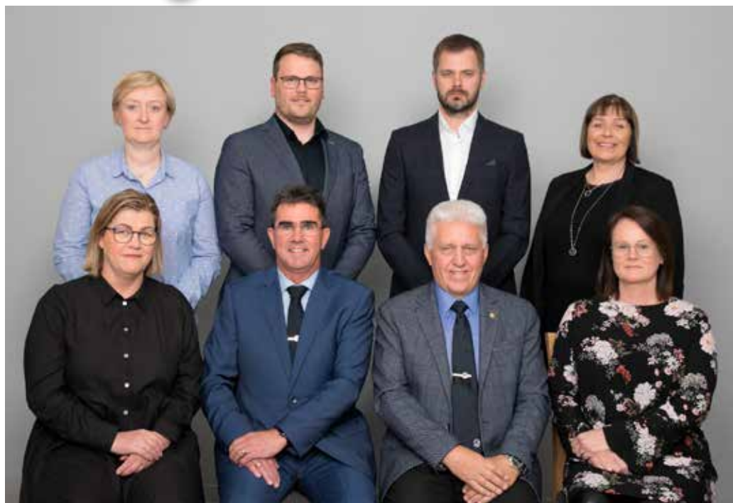
Aðalstjórn Keflavíkur 2020 - 2021.

Þessi vágestur hefur komið illa við okkur eins og flest alla þjóðina og allan heiminn. Allt íþróttastarf hefur farið úr skorðum bæði fjárhagslega og íþróttalega auk margra nýrra áskorana. Flest allar deildir hafa þurft að fresta skipulögðum mótum og orðið fyrir miklum tekjumiss vegna þess. Nettómótinu var frestað um ár, úrslitakeppnin í körfu blásin af, knattspyrnan var blásin af þegar tvær umferðir voru eftir af mótinu, en okkur til mikillar ánægju voru bæði meistaraflokkur karla og kvenna búnir að tryggja sér rétt til þátttöku í efstu deild að ári. Umhverfisdagur Keflavíkur sem fyrirhugaður var í maí var frestað. Stjórnarfolk,