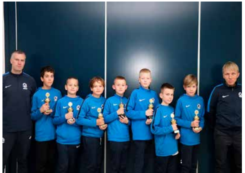
5. flokkur drengja