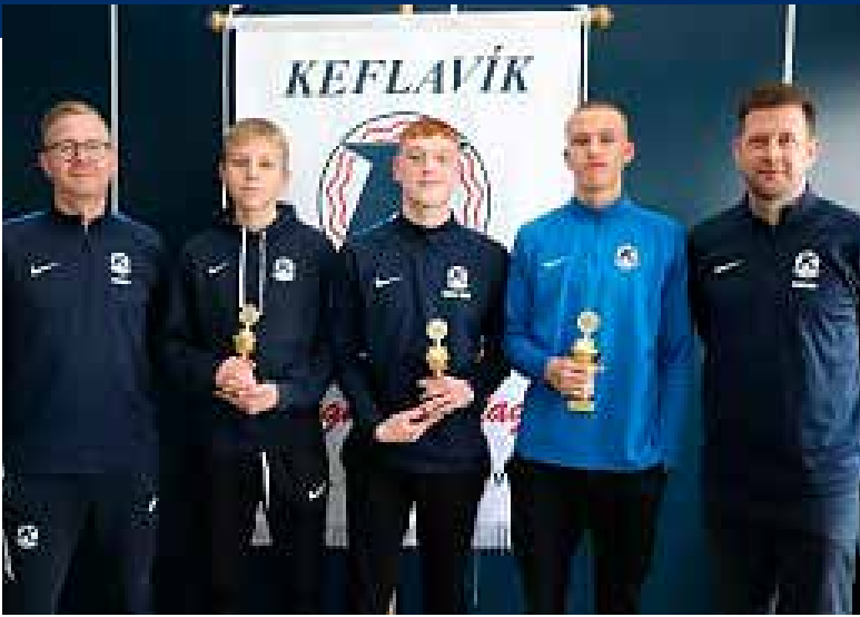
3. flokkur drengja eldri