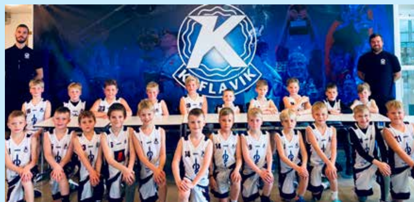
3. og 4. bekkur drengja