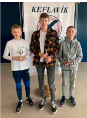
8. bekkur drengja