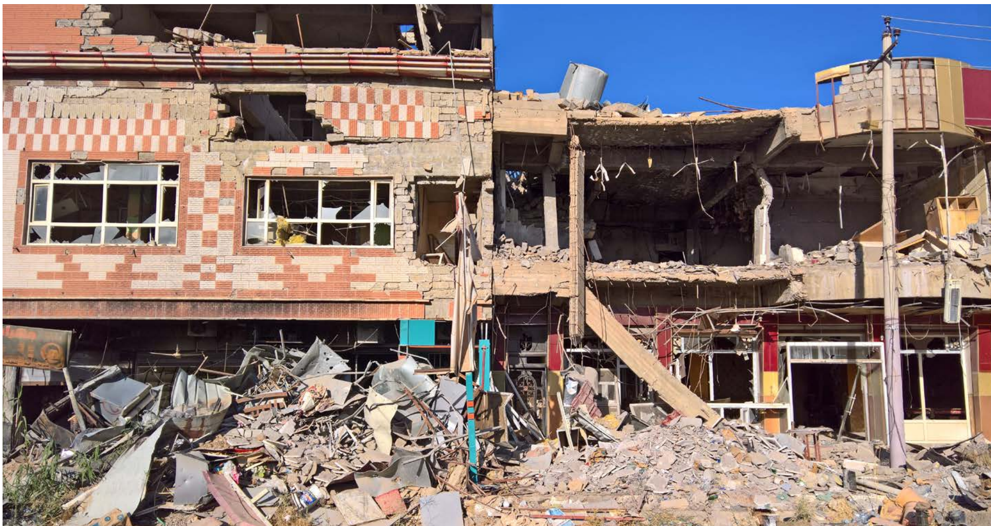
Alþjóðlegt Hjálparstarf kirkna, ACT Alliance, áætla að 6,1 milljón Sýrlendinga séu nú á vegangi og að 11 milljónir íbúa séu í brýnni þörf fyrir aðstoð.