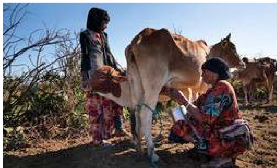
Konur hafa tekið þátt í sparnaðar- og lánahópum og fengið fræðslu um það hvernig best sé farið af stað með eigin rekstur. Eftir fræðslu og þjálfun hafa margar kvennanna hafið rekstur og reka litla búð, stunda geita- og hæmsnarækt og rækta grænmeti. Konur sem hafa tekið þátt í verkefninu tala um að þær hafi fjárráð og ákvörðunarvald en það var nær óþekkt að konur hefðu slíkt á verkefnasvæðunum áður en samvinnan hófst.