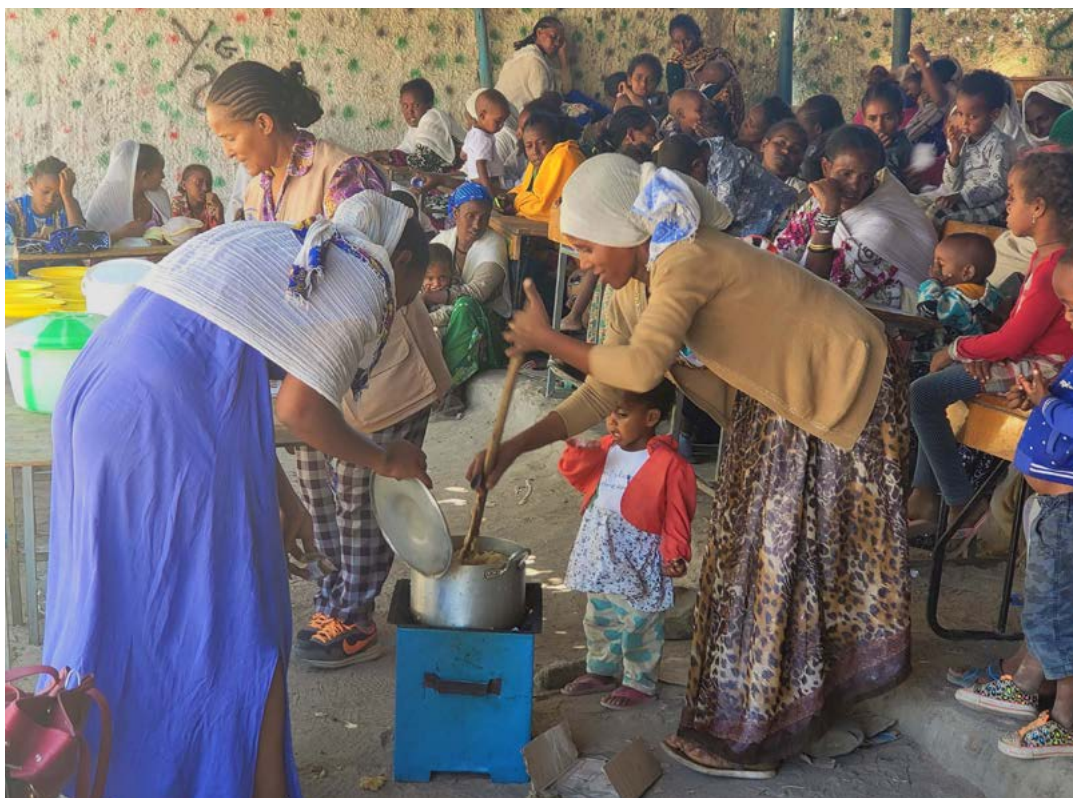
Mæður og börn fá mataraðstoð hjá Hjálparstarfi Lútherska heimssambandsins í Tigray.

Undanfarin tvö ár hafa reynst fólkinu í Eþíópíu erfið. Versti engisprettufaraldur í 25 ár eyðilagði uppskeru og jók á fæðuöryggi í landinu, verstu flóð í manna minnum fóru yfir hluta landsins í kjölfar þurrka og í apríl 2020 lýsti forsætisráðherra yfir neyðarástandi vegna kórónuveirufaraldursins. Samkvæmt upplýsingasíðu Sameinuðu þjóðanna hafa nú fleiri en 277 þúsund manns sýkst af COVID-19 og 4.349 látist í landinu af völdum veirunnar.