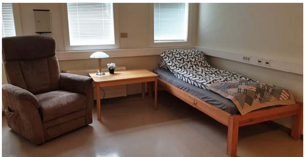
Í Skjólínu fá konurnar að borða og þær geta farið í sturtu og þvegið af sér. Þær geta lagt sig í hvíldarherbergi, farið á netið í sameiginlegu rými og prjónað og púslað í tómsundaherbergi.