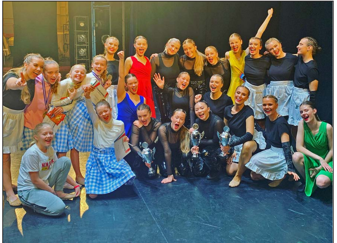
Allir Keppendur dansskólans unnu til verðlauna í undankeppni fyrir heimsmeistaramót í dansi sem haldið er á Spáni.

Í dansskólanum er boðið uppá fjölbreytt dansnám en einnig er starfandi við skólann söngleikjædeild þar sem nemendur læra leiklist, söng og dans. Söngleikjædeildin er alltaf að stækka og hún spilar virkilega stóran þátt í nemandasýningu dansskólans ár hvert í Borgarleikhúsinu sem er hápunktur ársins! Nemandasýning 2021 verður Mary Poppins þar sem öllu verður til tjaldað! Einnig bjóðum við upp á barnadansa