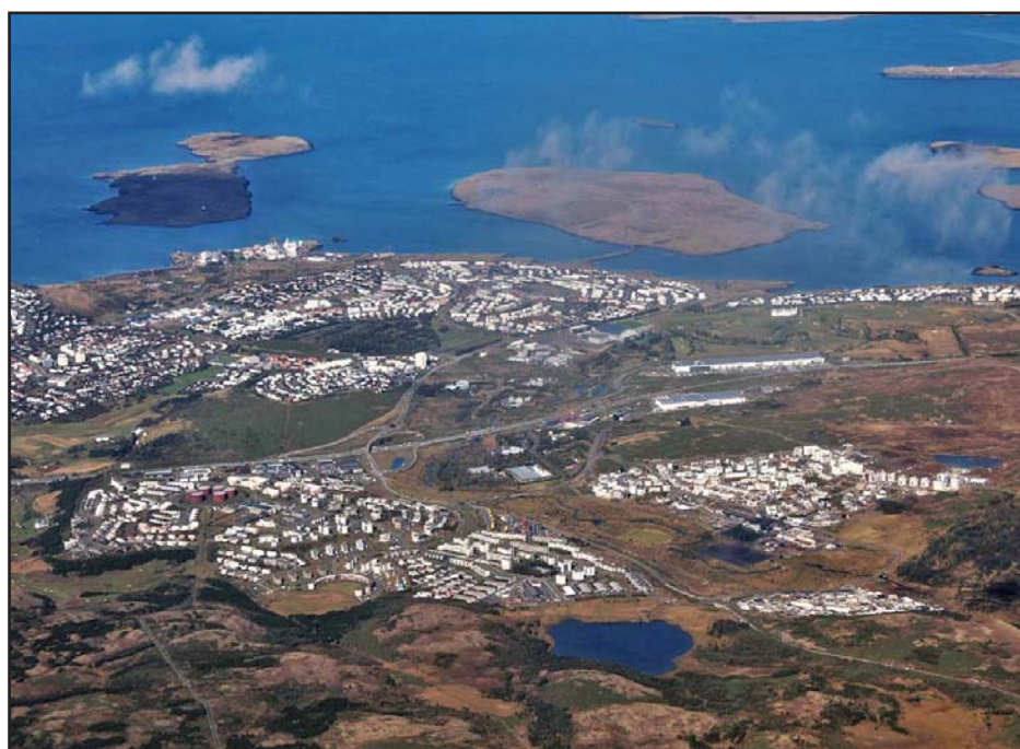
M-22 reiturinn er til hægrri á myndinni.