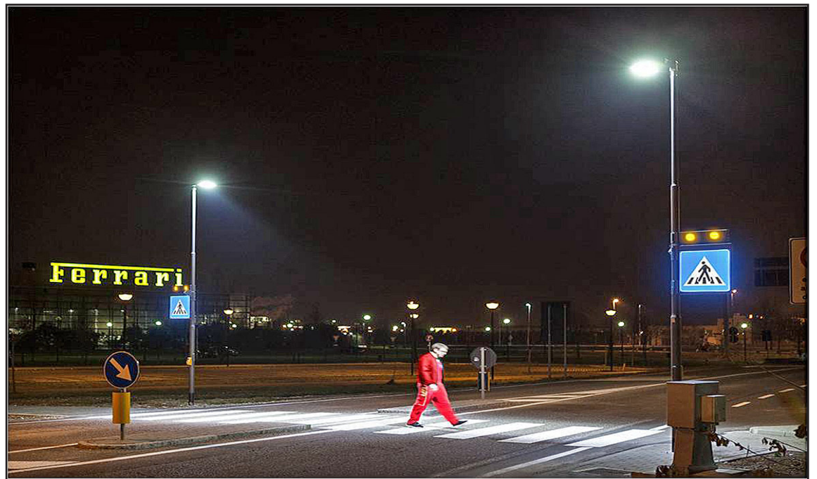
Nýr tæknibúnaður skynjar þegar gangandi vegfarendur nálgast gangbraut og kveikir þá LED götulýsingu. Þá kviknar einnig lýsing í gangbrautarmerkinu og viðvörnarljós fyrir akandi umferð.