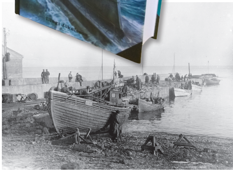
Ys og þýs við höfnina í Bolungarvík einhverntíma fyrir miðja 20. öld.