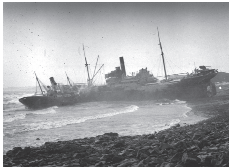
Portúgalska flutningaskipið Ourem og danska skipið Sonja Mærsk á strandstað í Rauðarárvík.