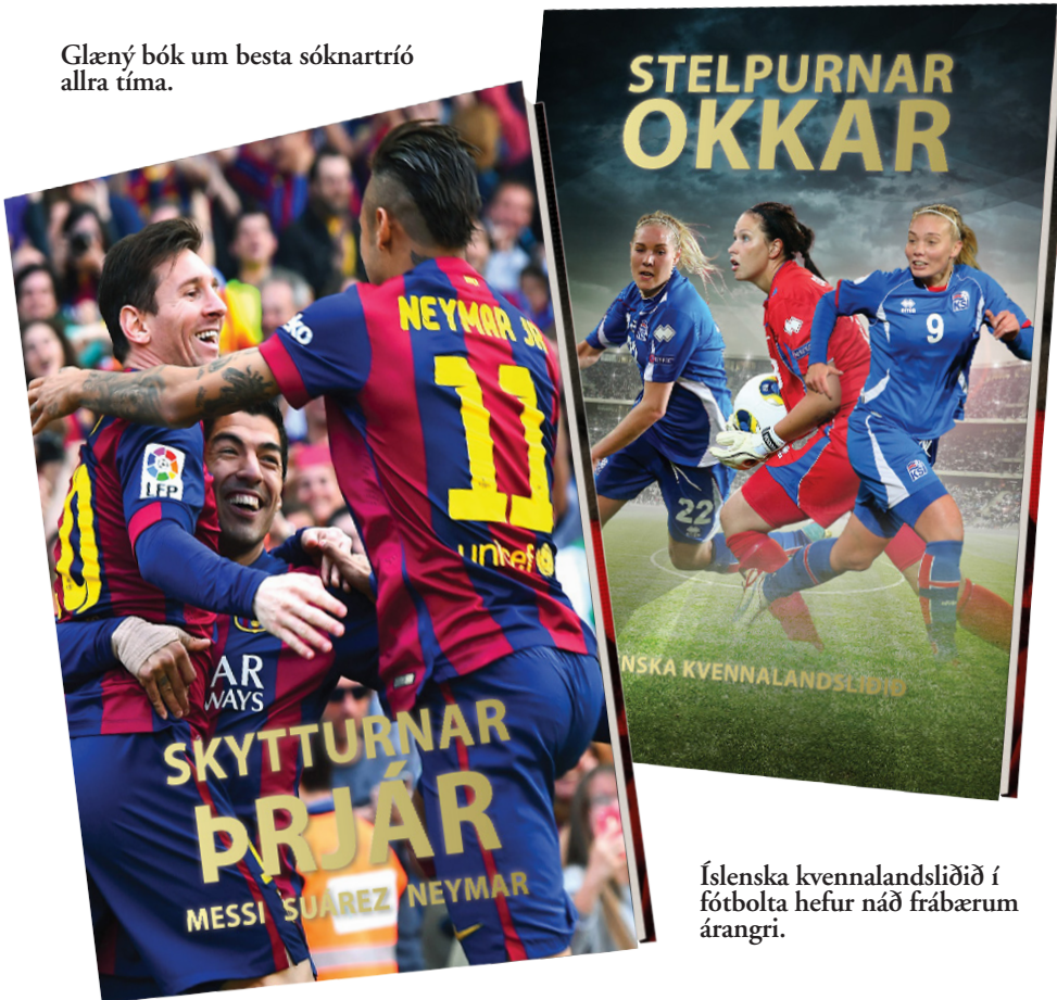
Íslenska kvennalandsliðið í fótbolta hefur náð frábærum árangri.

Glæný bók um besta sóknartrió allra tíma.