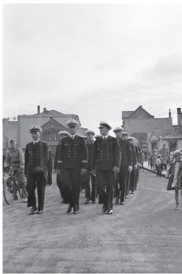
Sjólíðar af þýska herskipinu Emden ganga niður Bankastræti í ágúst 1938.