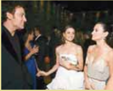
NEI, HÆ ÞÚ HÉR! Clive Owen spjallar við latnesku gyðjurnar Miu Maestro og Penelope Cruz.