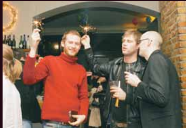
TALIÐ NIÐUR Gestir Apóteksins töldu niður og fögnuðu nýju ári.