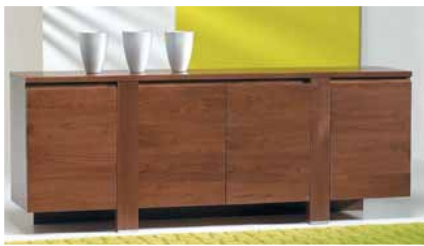
Laura 4ra hurða skenkur 144.300 kr.