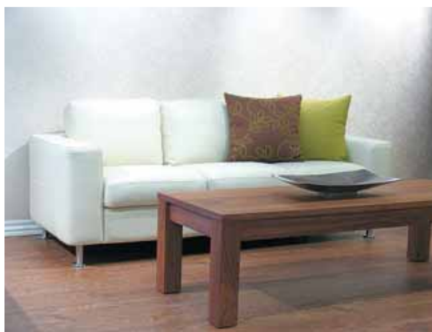
3ja sæta leðursófi 107.800 kr.