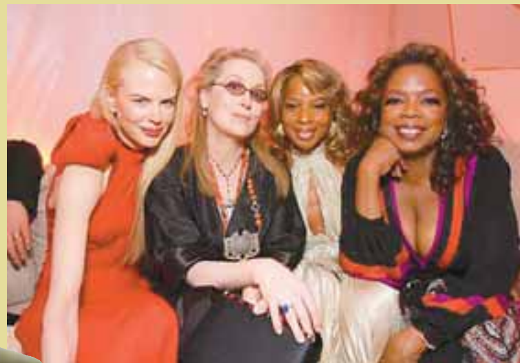
SÚPERKONUR Nicole Kidman, Meryl Streep, Mary J. Blige og Oprah tóku sig vel út saman.