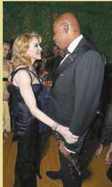
ÞÚ ERT SNILLINGUR Madonna hrósar leikaranum Forest Whitaker fyrir frammistöðu sína í kvikmyndinni The Last King of Scotland. En hann hefur sópað að sér hverjum verðlaununum á fætur öðrum fyrir frammistöðu sína.