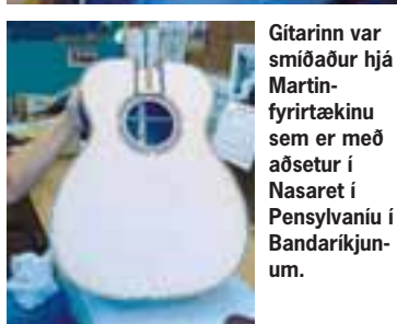
Gítarinn var smíðaður hjá Martin-fyrirtækinu sem er með aðsetur í Nasaret í Pensylvaníu í Bandaríkjunum .

Þ etta er besti gítar sem ég hef átt. Það er bara þannig," segir Bubbi Morthens um nýja sérsmíðaða Martin-kassagítarinn sem hann keypti fyrir skömmu. Martin-gítararnir þykja þeir bestu í heimi en gítarinn hans Bubba er einstakur. „Þetta er Rollsinn í gítarum – eins og að fá handsmiðaðan bíl. Það var engin maskína sem smíðaði gítarinn," segir Bubbi sem á fyrir þrjá aðra Martin-kassagítara , einn Gibson og einn Ovation .