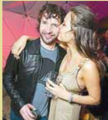
KOSS Á KÆRASTANN Petra Nemcova kysir kærasta sinn, James Blunt.