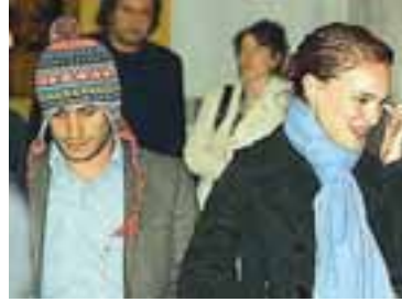
Natalie Portman og Gael García Bernal koma út af hóteli í Berlín á dögunum. Mörg íslensk hjörta verða kramin með þessari mynd.