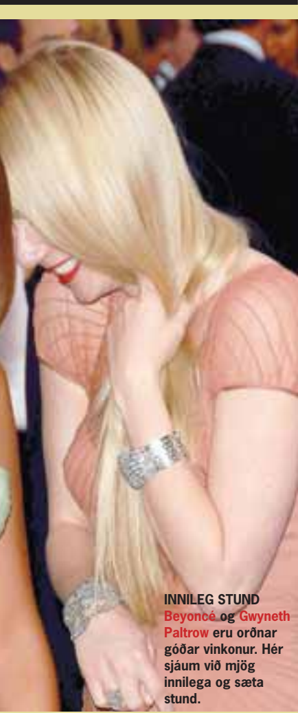
INNILEG STUND Beyoncé og Gwyneth Paltrow eru orðnar góðar vinkonur. Hér sjáum við mjög innilega og sæta stund.

Reese Witherspoon heillaði alla á Óskarsverðlaunahátíðinni. Hún hefur sjaldan litið jafn vel út.