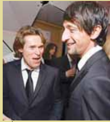
BRÁÐMYNDARLEGIR William Dafoe og Adrien Brody slógu á létta strengi á Óskarskvöldinu.