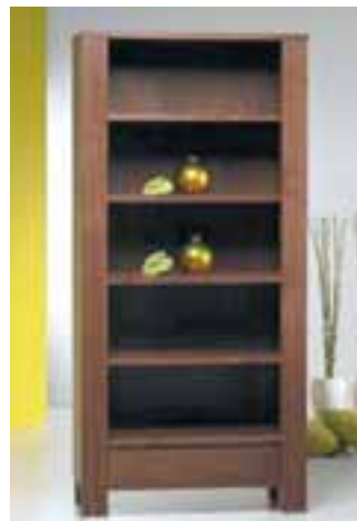
Laura Bókahilla 107.200 kr.