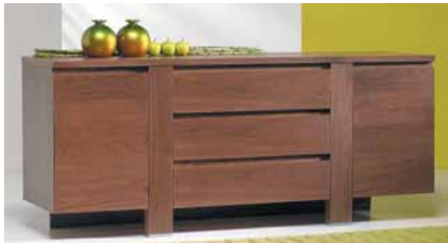
Laura Skenkur með skúffum 131.900 kr.