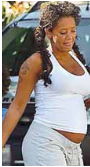
Melanie Brown er komin sex mánuði á leið.

Natalie Portman og Gael García Bernal sáust koma saman út af hóteli í Berlín á dögunum. Það eina sem hægt er að segja við þessu er nei! Af hverju eru þau byrjuð að hittast aftur? Hann er orðinn Íslandsvinur og margar íslenskar stelpur eflaust búnar að láta sig dreyma um að kynnast kappanum næst þegar hann kemur til landsins. Lífið getur verið svo óréttlátt.