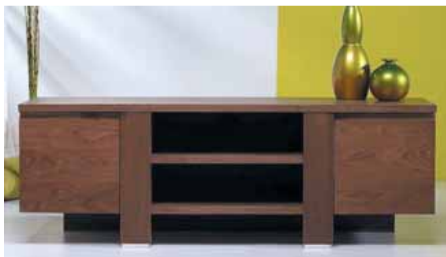
Laura Tv skenkur 83.800 kr.