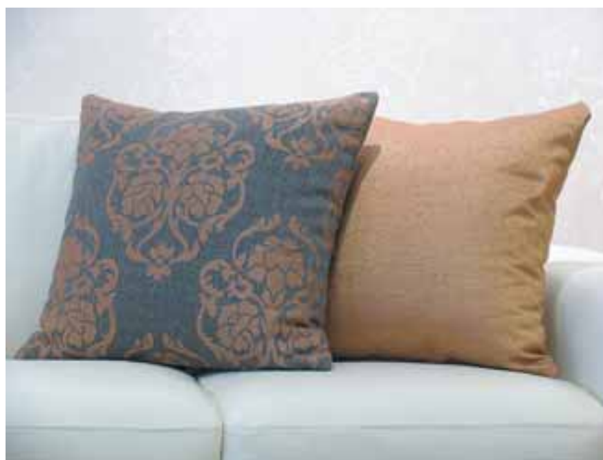
Frábært úrval af flottum púðum