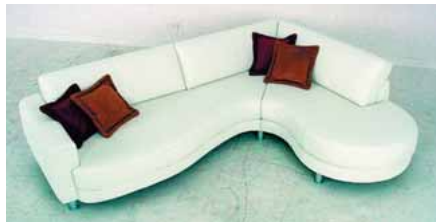
Leðurhornsófi 199.800 kr.