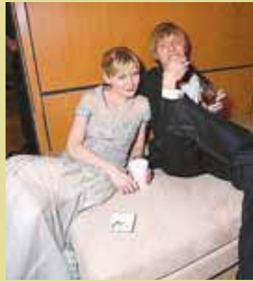
TJILLAD Leikkonan Kristen Dunst og bróðir hennar létu fara vel um sig í Vanity Fair-veislunni.