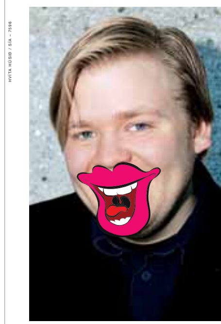
Háskólanemar í SKO eru ánægðir með lífið.