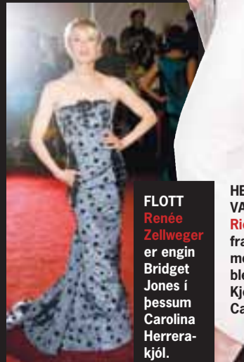
FLOTT Renee Zellweger er engin Bridget Jones í þessum Carolina Herrera-kjól.