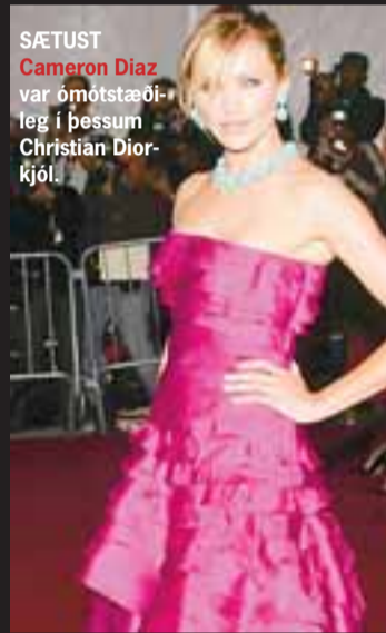
SÆTUST Cameron Diaz var ómóttstæðileg í þessum Christian Dior-kjól.

Ef það er eitthvert kvöld sem Hollywood-liðið vill alls ekki missa af þá er það Costum Institute Gala sem haldið er árlega í Metropolitan-safninu í New York. Ef þú ert alvörustjarna þá mætirðu þangað. Adalatriði kvöldsins er að vera í flottasta kjólnum og mæta með hönnuð upp á arminn. Þetta er svo vinsælt kvöld að mamma ársins í Hollywood, Jennifer Garner, skildi dóttur sína eftir hjá Ben Affleck til að mæta og Sandra Bullock lét einnig sjá sig þrátt fyrir að einhver kolklikkuð kona hafi nýverið reynt að drepa mann hennar. Njótið kjólanna.