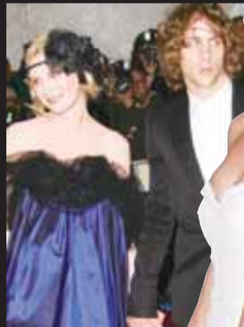
EKKI SMART Kirsten Dunst er nú yfirleitt mjög töff týpa, en þessi kjöll er ekki alveg að gera sig. Nýi kærastinn er samt sætur.

Ef það er eitthvert kvöld sem Hollywood-liðið vill alls ekki missa af þá er það Costum Institute Gala sem haldið er árlega í Metropolitan-safninu í New York. Ef þú ert alvörustjarna þá mætirðu þangað. Adalatriði kvöldsins er að vera í flottasta kjólnum og mæta með hönnuð upp á arminn. Þetta er svo vinsælt kvöld að mamma ársins í Hollywood, Jennifer Garner, skildi dóttur sína eftir hjá Ben Affleck til að mæta og Sandra Bullock lét einnig sjá sig þrátt fyrir að einhver kolklikkuð kona hafi nýverið reynt að drepa mann hennar. Njótið kjólanna.