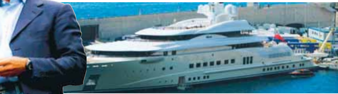
RISASTÓR Pelorus, snekkja Romans Abramovich, er gríðarlega stór og kostar um átta milljarða.