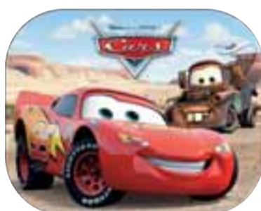
Cars sólskyggni McQueen+Matter