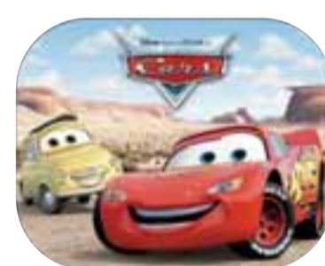
Cars sólskyggni McQueen+Luigi