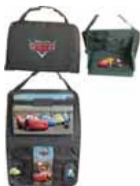
Cars sætishlíf með borði og vösum