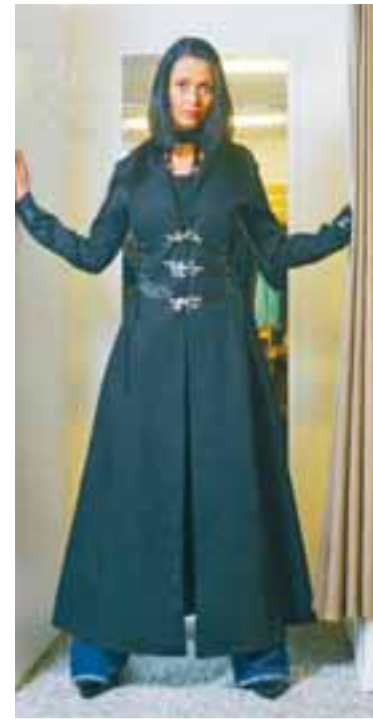
VAN HELSING KÁPAN „Þetta er uppáhaldskápan mín. Ég keypti hana í San Francisco á sínum tíma og finnst hún rosalega flott.“