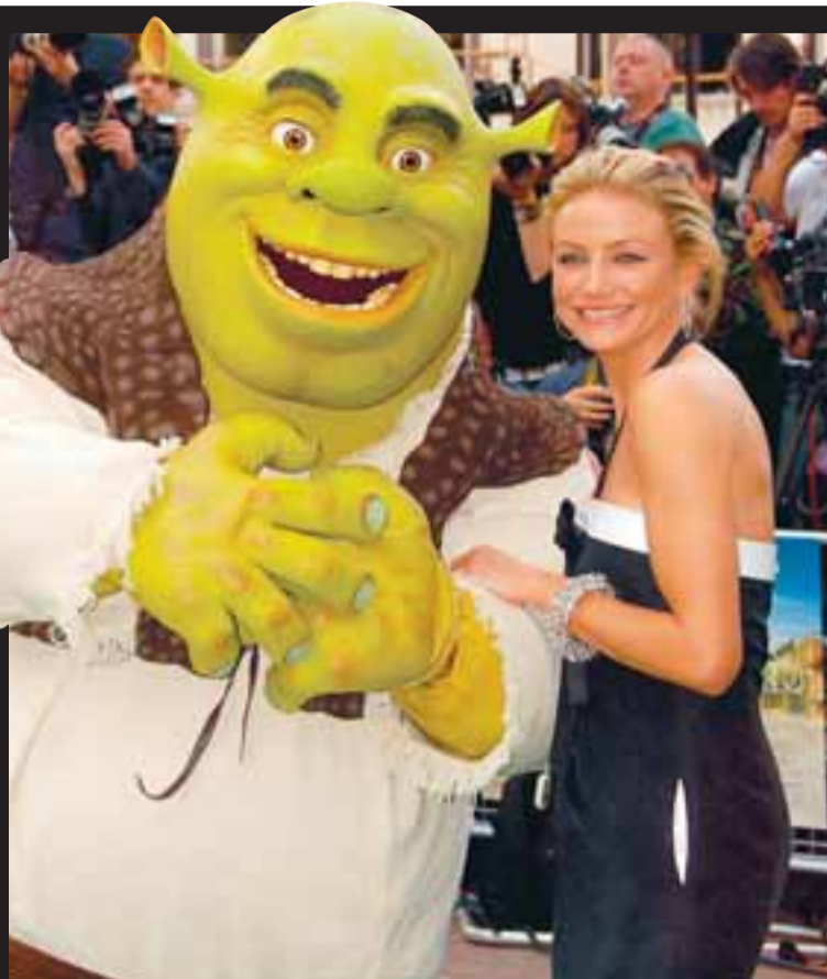
SÆT SAMAN Shrek ásamt Cameron sem ljær prinsessunni rödd sína.

STJÖRNURNAR SKINU SKÆRT Á FRUMSÝNINGU SHREK 3 Í LONDON.