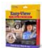
Easy View Stór og góður spegill sem hægt er að snúna 360° auðvelt að festa -afar skýr