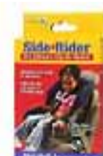
Side-Rider Clip-On karfa - úr mjúku efni sem gefur vel eftir. Hægt að smella eða krækja. Passar á öll sæti.