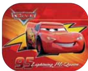
Cars sólskyggni McQueen