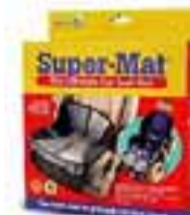
Super-Mat Motta til að setja undir barna- bílstól.