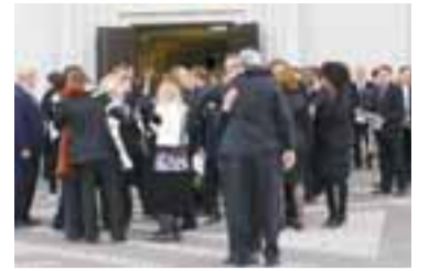
ERFIÐ STUND Það ríkti mikil sorg við Hallgrímskirkjuna á mánudag enda erfið að kveðja ástvin.