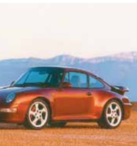
900 HESTÖFL Billinn sem Róbert keypti er 900 hestöfl sem er með því kraftmesta sem gerist í fólksbílum.