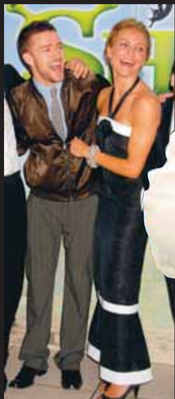
GÓÐIR VINIR Ekki er annað hægt að sjá en að Cameron og Justin Timberlake séu góðir vinir þótt þau hafi slitið fjögurra ára sambandi sínu.