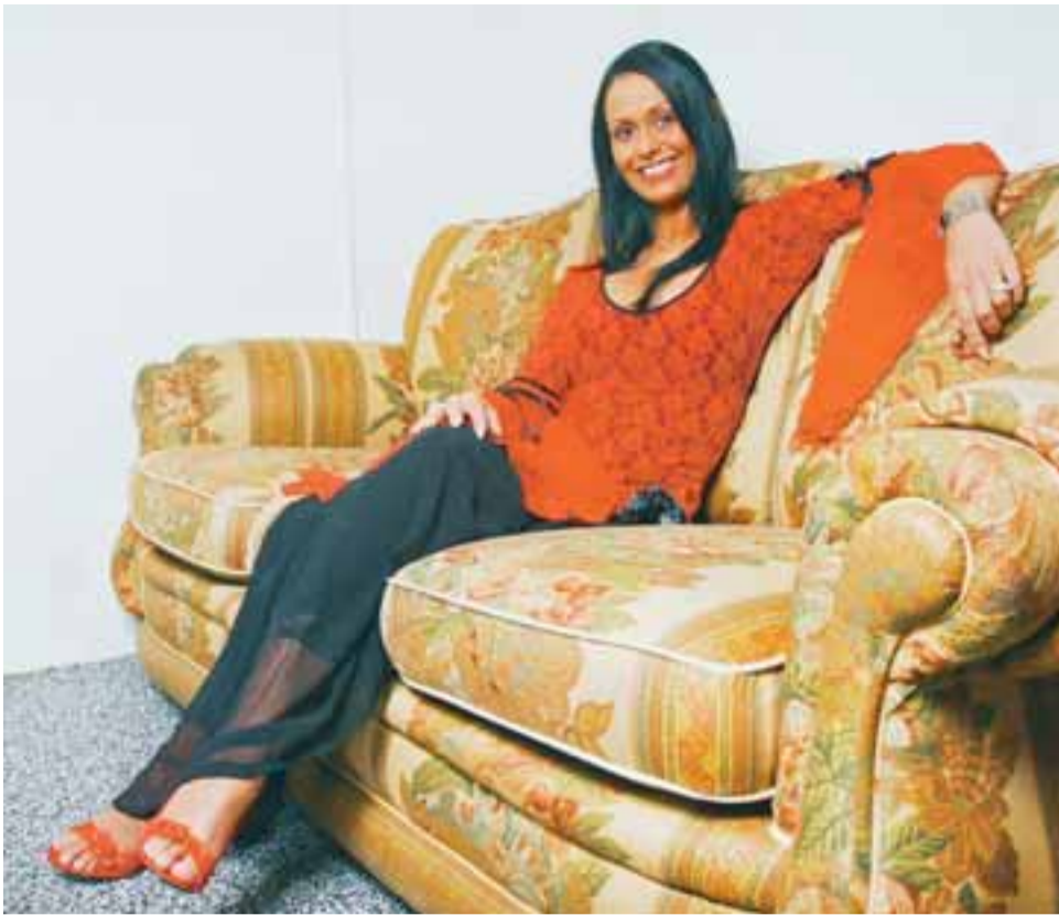
SENJÓRITUKJÖLLINN „Þetta er nýjasta uppáhaldið mitt. Ég fann hann á heildsölu sem ég versla við fyrir búðina og varð alveg veik og hef ekki séð eftir því. Svo keypti ég skó í stil, maður má ekki klikka á því.“