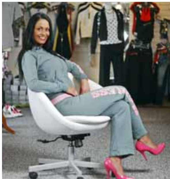
DJÚSÍ GALLINN „Ég nota þetta mikið heima, þetta eru þægileg fót en samt töff og ég get druslast í þessu.“