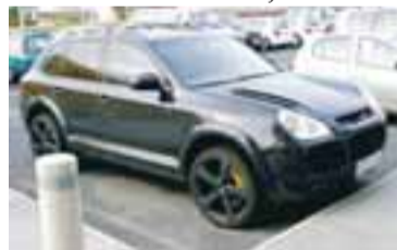
EINN SÁ KRAFTMESTI Porsche Cayenne jeppi Róberts er hlaðinn aukabúnaði og einn dýrasti og kraftmesti Porsche-jeppi landsins.

R óbert Wessman, forstjóri Actavis, er mikill áhugamaður um hraðskreiða bíla eins og komið hefur kom í Sirkus. Róbert á einn öflugasta Porsche-jeppa landsins sem er sérsmíðaður og rúm 750 hestöfl en hann bætti um betur á dögnum og keypti sér rétt rúmlega 900 hestafla Porsche 911 Turbo frá Bandaríkjunum. Billinn