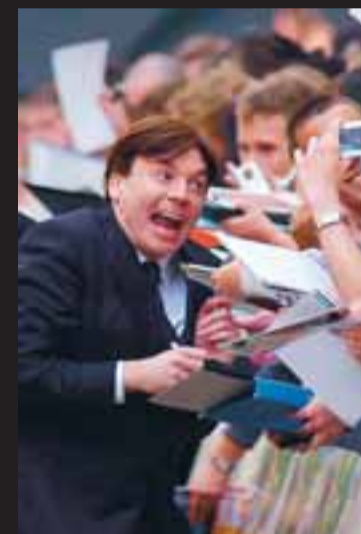
MIKE MYERS Leikarinn gaf aðdáendum sínum góðan tíma.

Cameron Diaz og Justin Timberlake sýndu og sönnuðu að þau eru góðir vinir þrátt fyrir sambandsslitin þegar þau birtust saman á frumsýningu teiknimyndarinnar Shrek 3 í London. Leikkonan var í miklu stuði á opnuninni og gaf aðdáendum sínum góðan tíma á milli þess sem hún gantaðist við meðleikara sína. Cameron og Justin höfðu verið saman frá árinu 2003 þegar fréttir skyndilega bárust af skilnaði þeirra. Mikill stjörnu-fans þrýðir teiknimyndina Shrek en auk Cameron og Justins ljá Antonio Banderas, Mike Myers og Rupert Everett söguhetjunum raddir sínar.