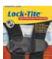
Lock-Tite Smella til að halda öryggisbeltum saman. aðeins ætlað 5p öryggisbeltum fyrir stóla upp að 18kg.