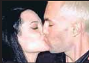
HVER MAN EKKI EFTIR ÞESSU? Kossinn sem sjokkeraði alla. Angelina og bróðir hennar James Haven.

Angelina hefur verið afar opin-ská um samband sitt við Brad og lýsir honum sem einstökum manni