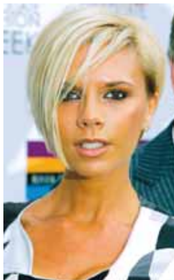
VICTORIA BECKHAM Er miklu sætari með stutt hár, en hún var orðin þreytt á því að vera endalaust með hárlengingar.