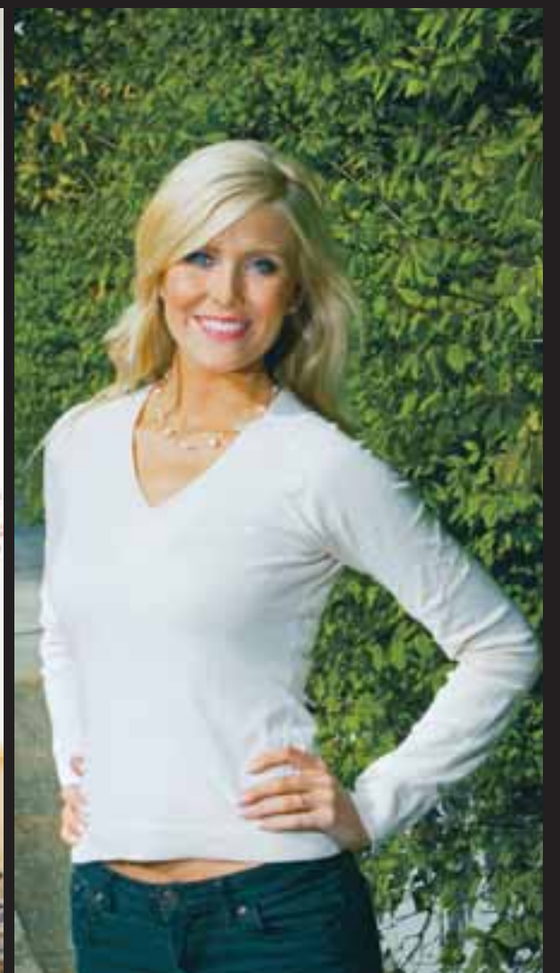
HVERSDAGS Gallabuxurnar eru frá Abercrombie og Fitch og ljósa angórupeysan er úr sömu búð.