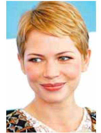
MICHELLE WILLIAMS Dawson's Creek-skvísan er lík Miu Farrow í Rosemary's Baby og það fer henni vel.