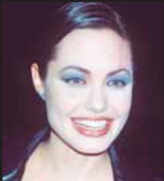
NY STJARNAN Á FERÐINI Svona leit Angelina út er hún lék í myndinni Gia sem kom henni á kortið.

M unið þið eftir gömlu góðu dögnum þegar Angelina Jolie var ung og villt? Þegar hún skipti um háralit einu sinni viku, lék sér að hnífum og gerði lítið annað en að fara í sleik við Billy Bob Thornton.