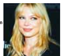
SELMA BLAIR Er alltaf sexi og getur í raun gert hvað sem er við hárið á sér.