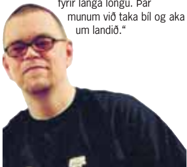
Kiddi Bigfoot plötusnúður

„Ég ætla að slappa af í sumarleyfinu og skreppa til Ítalíu en þá ferð planaði ég fyrir langa löngu. Þar munum við taka bíl og aka um landið.“