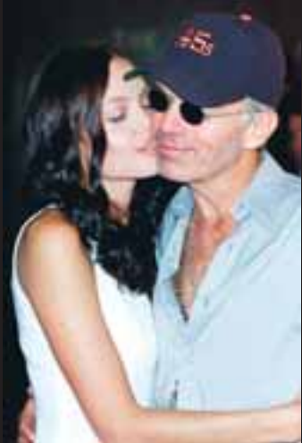
SJÚK Í BILLY BOB Angelina Jolie og Billy Bob Thornton slepptu ekki hvort öðru á meðan sambandi þeirra stóð.