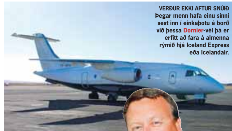
VERÐUR EKKI AFTUR SNÚID Þegar menn hafa einu sinni sest inn í einkaþotu á borð við þessa Dornier-vél þá er erfitt að fara á almenna rýmið hjá Iceland Express eða Icelandair.