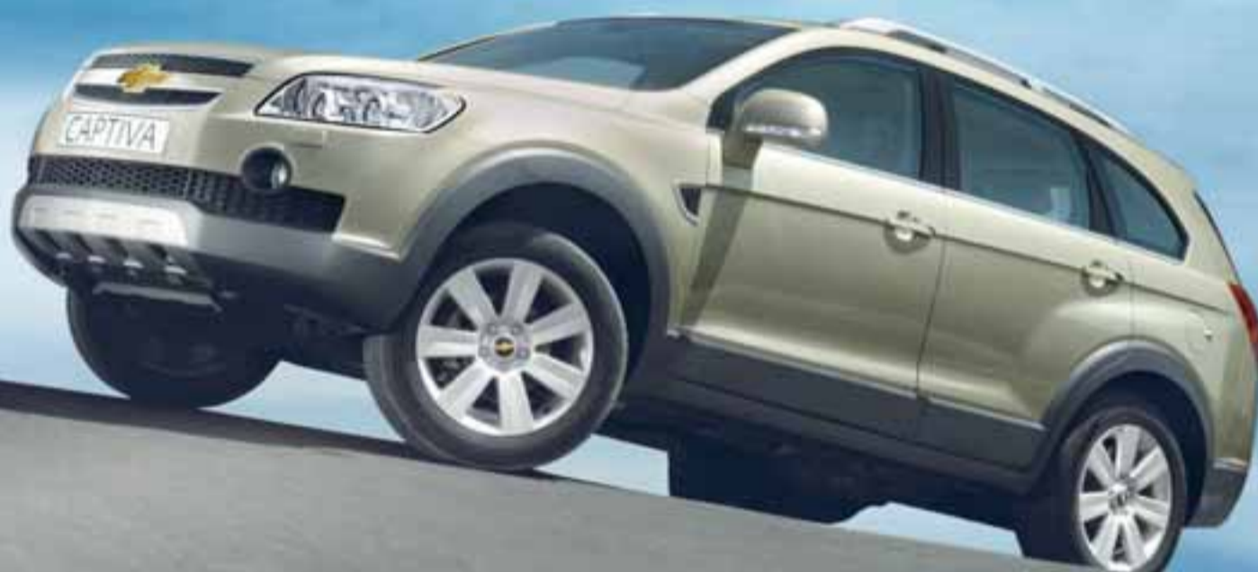
Chevrolet Captiva 7 manna sportjeppinn sem tekið er eftir