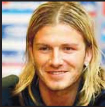
LAFDI LOKKAPRÚÐA Beckham með síða hárið var algjör snilld.