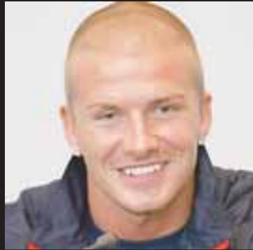
SNODADA TÝPAN Þetta fer Beckham alls ekki.