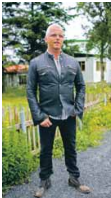
ENGIN MERKJAFRIK „Ég hef aldrei verið merkjamaður en datt hins vegar inn á Orange-línuna hjá Hugo Boss. Leðurjakkinn er úr All Saints en skyrtan og gallabuxurnar eru frá Hugo Boss.“