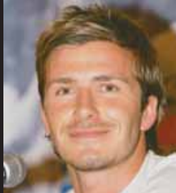
KLASSÍSK Þessi klipping hefur staðist tímans tönn.