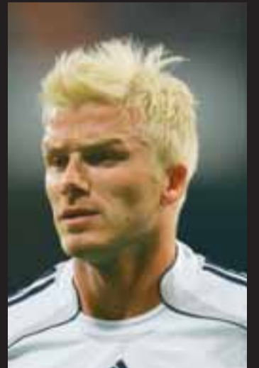
VÓ, BLONDI Beckham aflitaði hárið á sér til að vera í stíl við konuna.