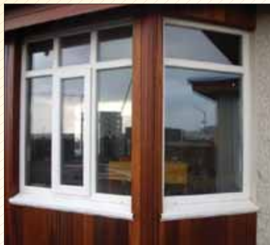
TOPLINE gluggar og hurðir