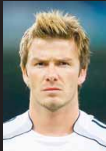
STRÍPUR Enginn nema Beckham gæti verið með svona fullkomnar stripur.