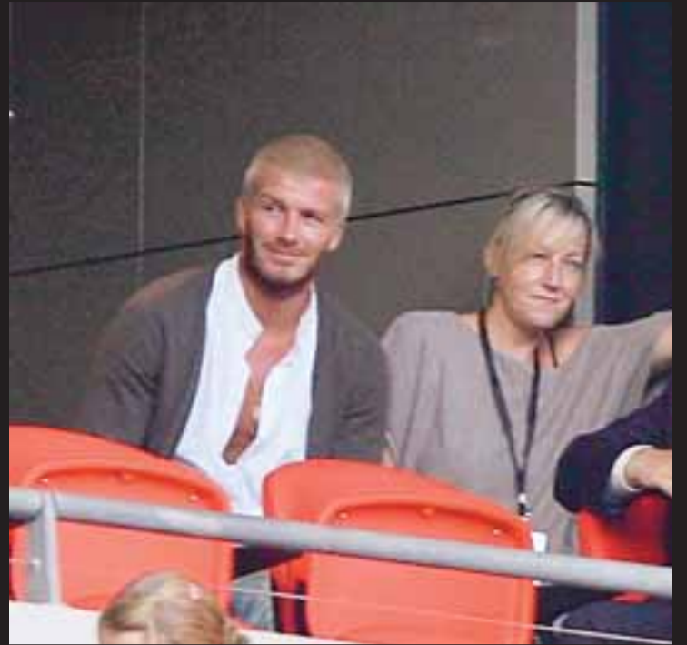
SVART OG HVÍTT Nýjasta lúkkið. Svart skegg og silfurlitað hár.