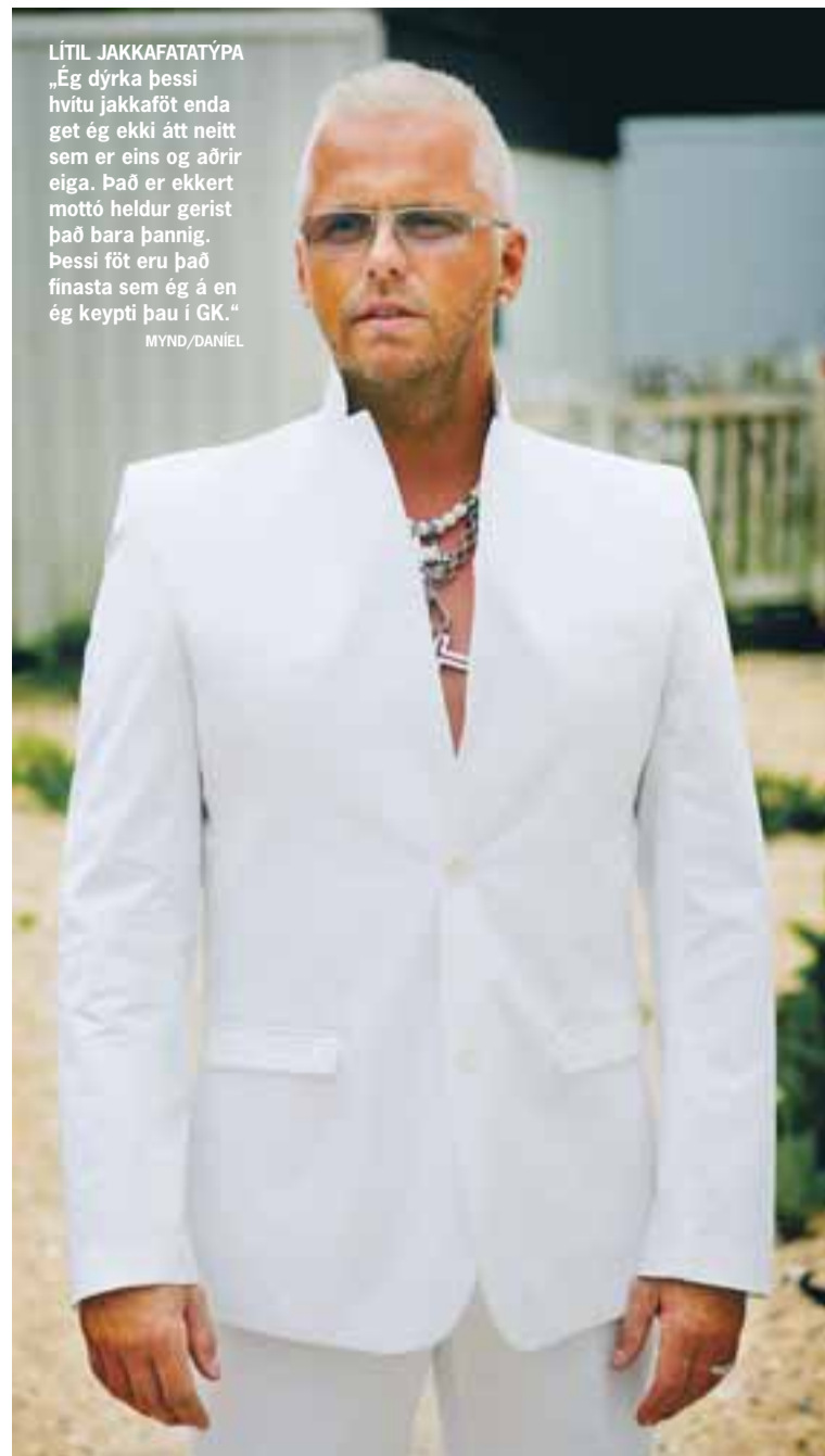
LÍTIL JAKKAFATATÝPA „Ég dýrka þessi hvítu jakkaföt enda get ég ekki átt neitt sem er eins og aðrir eiga. Það er ekkert mottó heldur gerist það bara þannig. Þessi föt eru það finasta sem ég á en ég keypti þau í GK.“