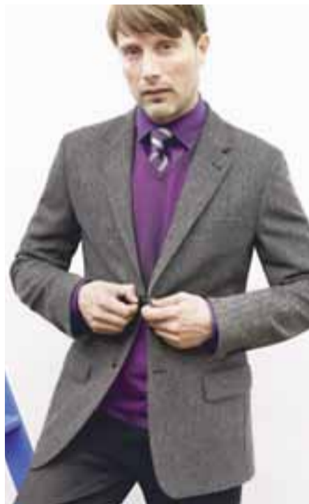
HEITUR GAUR Einn flottasti leikari Norðurlanda, Mads Mikkelsen, er módel hjá H&M þetta haustið, en hann segist hafa gengið í fötum frá fyrirtækinu síðan hann fæddist.