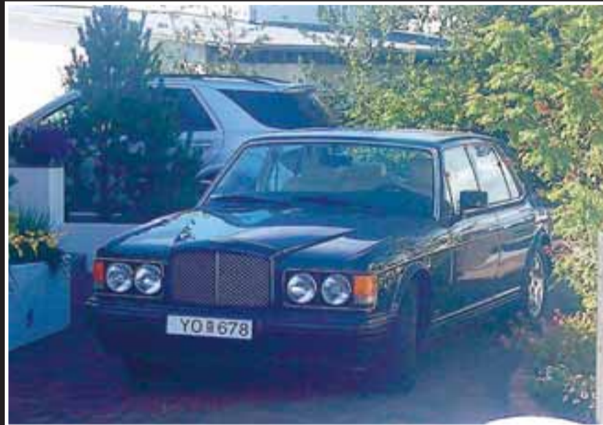
BENTLEYINN Algjört augnayndi sem stendur í heimreiðinni við Vesturbrún 22.