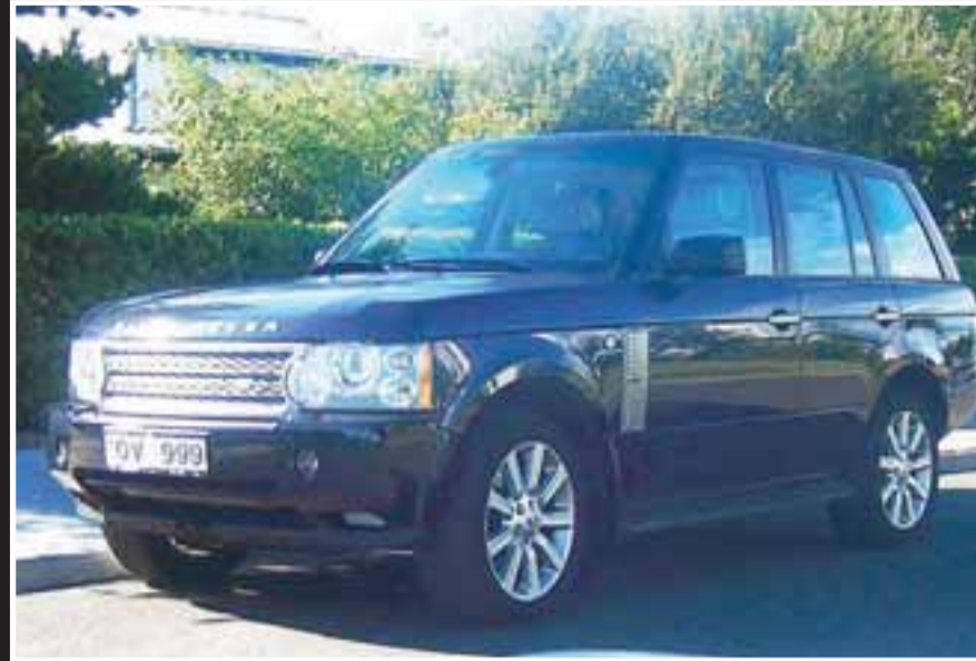
RANGE-INN Björgólfur keyrir dagsdaglega um á tveggja ára gömlum jeppa.