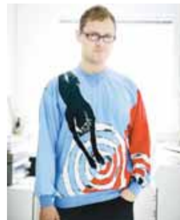
Í FOKDÝRUM FÁNALITUM „Þetta er svakaleg peysa sem ég fékk í Spúútník. Hún er í fánalitunum og annaðhvort finnst fólk hún æðisleg eða ógeðsleg.“ Ég borgaði fúlgu fyrir hana. Alltof mikið miðað við hvað maður á að eyða í föt.“