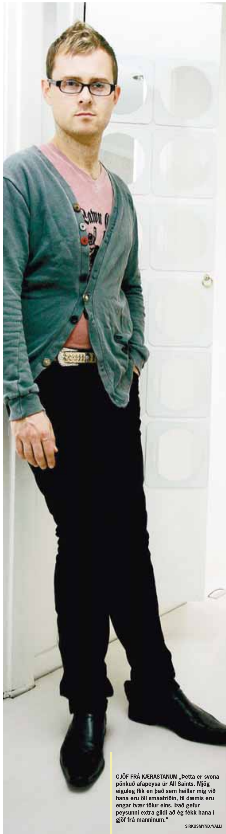
GJÖF FRÁ KÆRASTANUM „Þetta er svona pönkuð afapeysa úr All Saints. Mjög eiguleg flik en það sem heillar mig við hana eru öll smáatriðin, til dæmis eru engar tvær tölur eins. Það gefur peysunni extra gildi að ég fékk hana í gjöf frá manninum.“