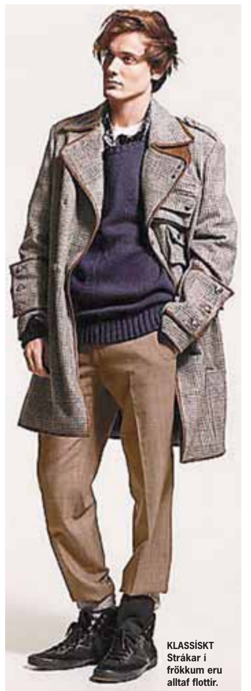
KLASSÍSKT Strákar í frökkum eru alltaf flottir.