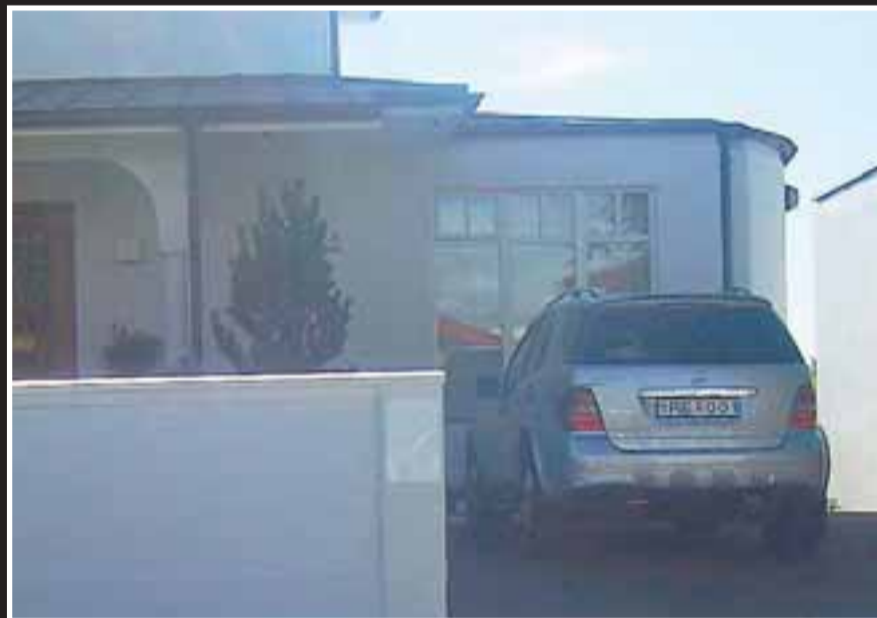
BENZINN Þóra keypti þennan Benz-jeppa fyrir skömmu.