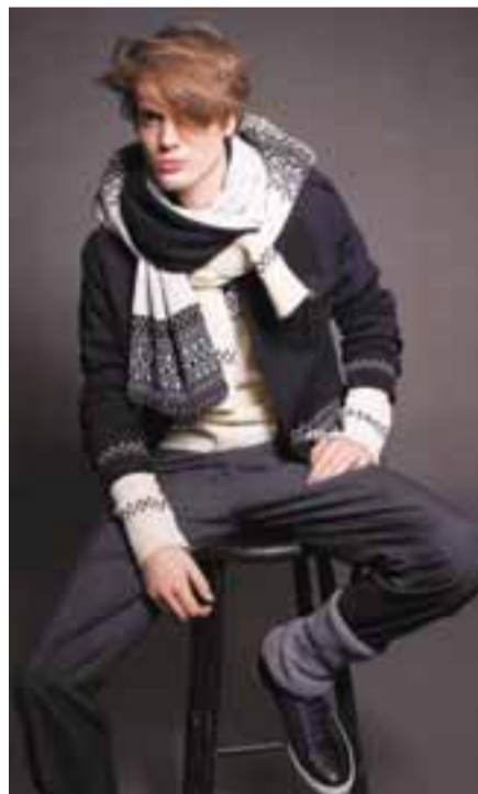
SVART OG HVÍTT Strákarnir eiga að halda sig mest við svart, hvítt og grátt samkvæmt hönnuðum H&M en þó má poppa hina svarthvítu tilveru upp með flikum í rauðu eða fjólubláu.