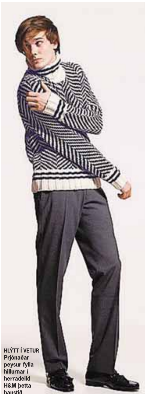
HLÝTT Í VETUR Þrjónaðar peysur fylla hillurnar í herradeild H&M þetta haustið.