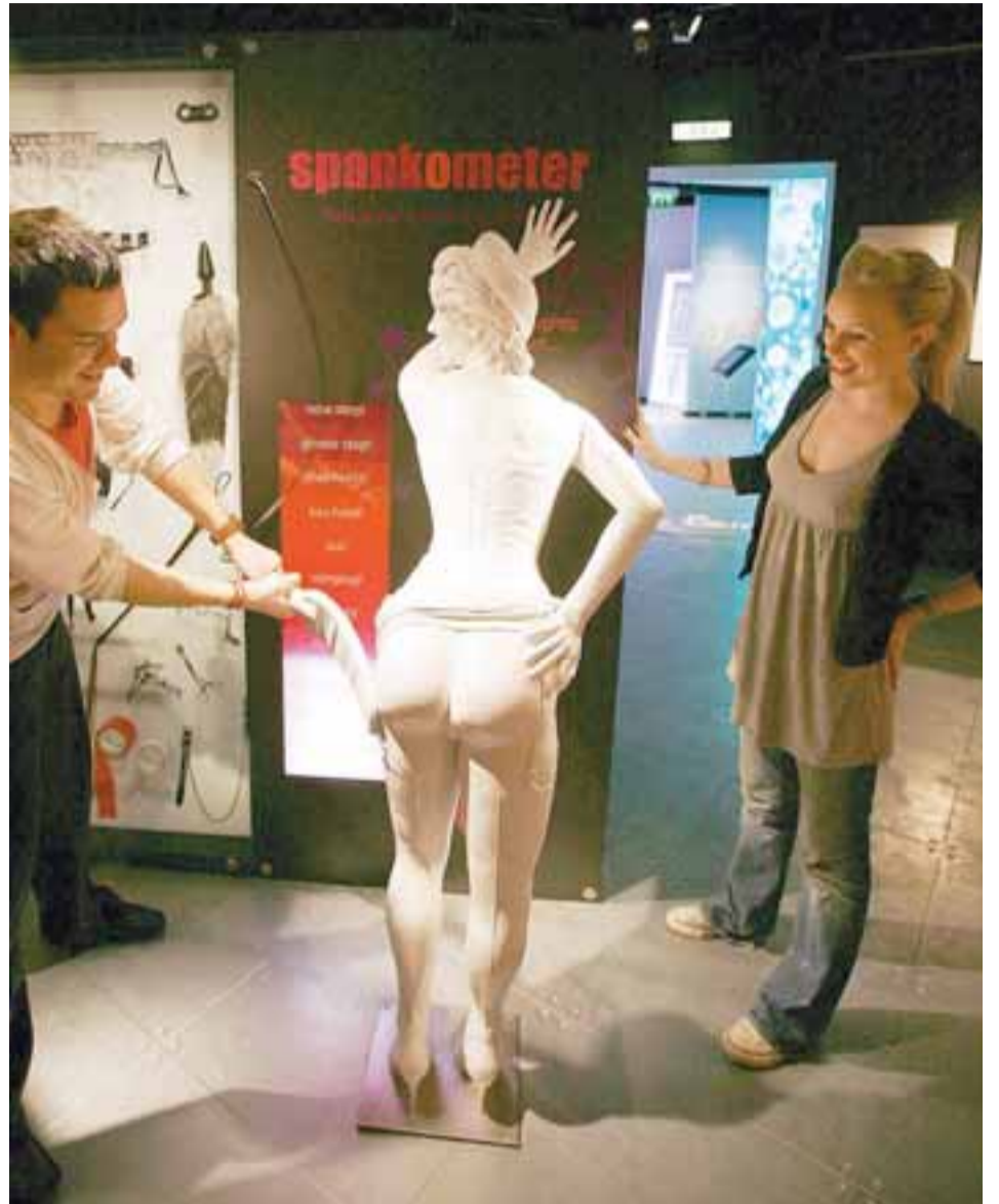
FLENGINGARMÆLIR Gestir geta mælt getu sína í flengingum í sérstökum flengingarmæli.

Öll framsetning á setrinu er afar nútímaleg og þannig gerð að gestir fá að prófa hæfni sína og kunnáttu á ýmsum sviðum. Nútímatækni er nýtt til hins ítrasta sem gerir safnið bæði spennandi, skemmtilegt og fræðandi. Á staðnum eru einnig kynlífsfræðingar sem svara gjarnan spurningum gesta og veita persónulega leiðsögn í gegnum setrið. Íslendingar á leið til London geta lesið sér nánar til um þetta einstaka fræðslusetur á heimasíðunni www.amoralondon.com en það skal tekið fram að 18 ára aldurstakmark er inn á staðinn.