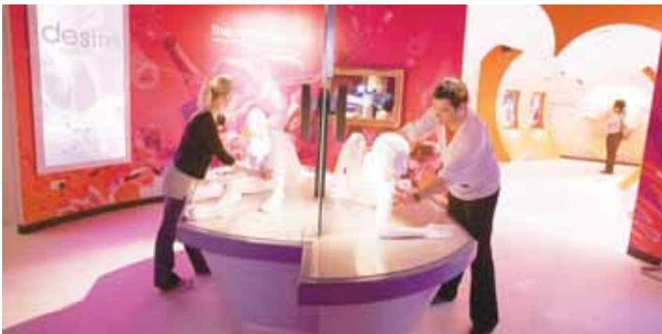
HEITASTI FERÐAMANNASTAÐUR LUNDÚNA Amora-setrið hóf starfsemi í vor og er nú þegar orðið vinsæll áfangastaður bæði heimamanna og ferðamanna sem vilja betrumbæta kynlífstækni sína.