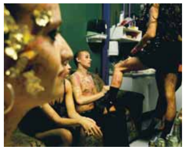
EFTIRVENTING Í LOFTINU Mikil spenna ríkti hjá keppendum áður en úrslitin voru kynnt.