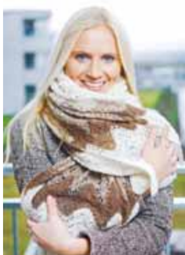
ULLARSJALIÐ HENNAR ÖMMU „Ég fékk þetta þrónaða íslenska ullarsjal að láni frá mömmu en hef aldrei skilað því aftur.“

en hef oft fundið bestu hlutina á síðustu mínúturnum í útlöndum. Þegar ég fór til Kína og Japan langaði mig í eitthvað alveg spes frá báðum stöðum. Í bæði skiptin fann ég fullkomnar