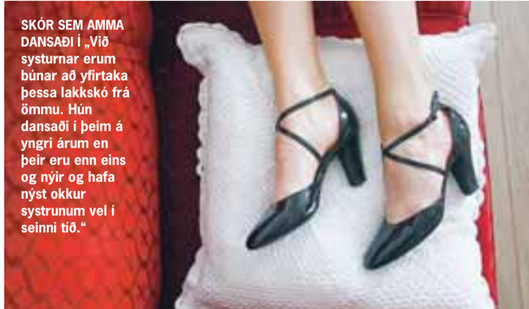
SKÓR SEM AMMA DANSaðI Í „Við systurnar erum búnar að yfirtaka þessa lakkskó frá ömmu. Hún dansaði í þeim á yngri árum en þeir eru enn eins og nýir og hafa nýst okkur systrunum vel í seinni tíð.“