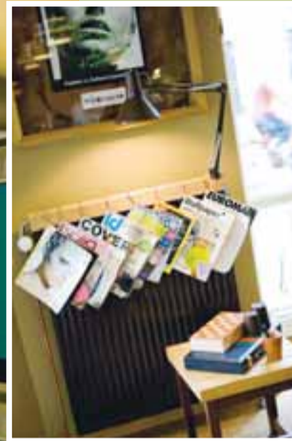
FRIKKAKAFFIHÚS Danir fila staðinn í botn en yfirleitt er hann þéttsetinn af Íslendingum sem búa í borginni.