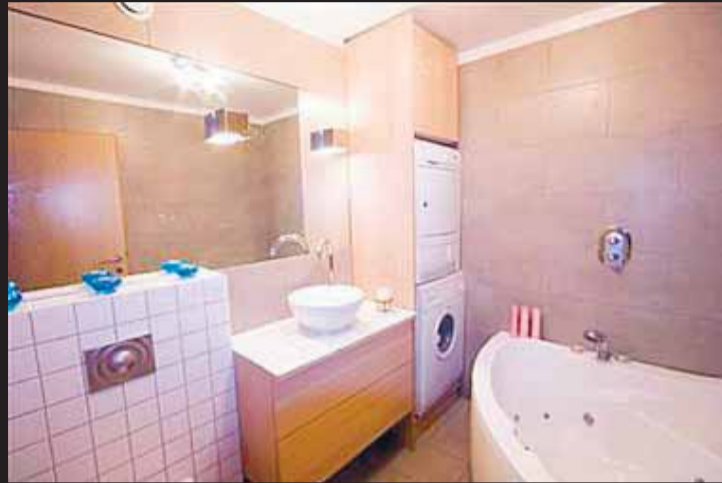
HÚSGÖGNIN GETA FYLGT MEÐ Í auglýsingunni á fasteignavefnum kemur fram að húsgögnin geti fylgt með íbúðinni.