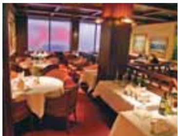
Varist vinsæla veitingastaði og bari

Það er fátt vandræðalegra en að lenda á næsta borði við fyrrverandi „félaga“ sem hefur deilt aðeins meiru með manni en einum drykk á Kaffibarnum þegar farið er á fyrsta deit. Því ber að varast 101 Reykjavík eins og heitan eldinn þegar kemur að því að ákveða stað fyrir stefnumótið. Hótelbarir eins og Loftleiðir og Hótel Saga koma sterkir inn og ætti að vera lítið mál að redda iverustað yfir nóttina ef út í það færi. Hverfisbarir eins og Kringlukráin, Nikkabar og Ölver eru vel geymd leyndarmál þar sem rómantík svífur yfir sveittum hamborgara, ódýru öli og einum Jolene slagara og ætti að vera fullkomin uppskrift að hressu stefnumóti.