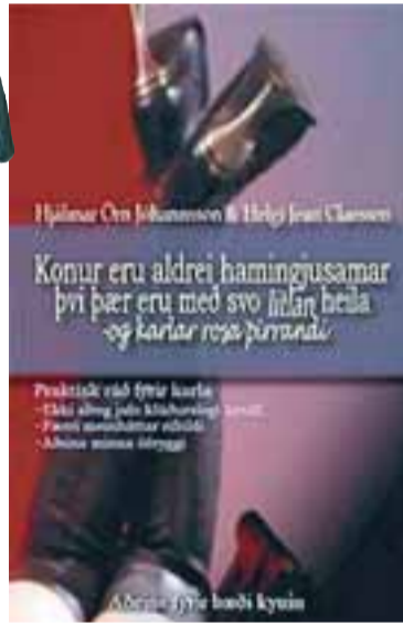
KONUR ERU ALDREI HAMINGJUSAMAR