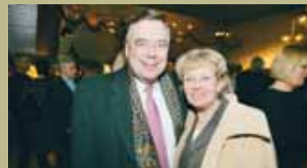
Í GLEÐINNI Forsætisráðherra Geir H. Haarde og eiginkona hans, Inga Jóna Þórðardóttir, brostu breitt og nutu þess að vera í leikhúsinu.