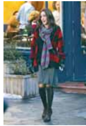
STUNDIN SEM ALLIR BIÐU EFTIR Aðdáendur Bigs eiga eflaust eftir að táfella yfir myndinni.