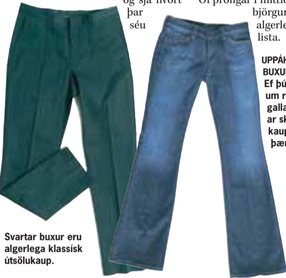
Svartar buxur eru algerlega klassísk útsölukaup.

Í JANÚAR Á MAÐUR AÐ GERA EITTHVAÐ FLIPPAD Keyptu þér gulasta toppinn í allri veröldinni og skerðu þig úr þegar allir hinir eru klæddir eins og þeir séu að fara í jarðarför.