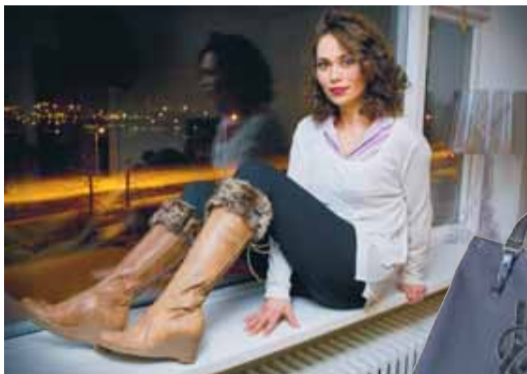
DÖMULEG Stígvélin eru sérlega falleg að aftan, reimuð og smart.

Í hvaða borg finnst þér skemmtilegast að versla? „Síðustu tíu ár hef ég verið með annan fótinn í París í vinnu og námi. Það er borgin mín. Þar er tískan áberandi og sniðug kona lærir fljótt hvernig hægt er að tolla í tískunni án þess að fara alveg á kúpu. Til dæmis á hún eina dýra og fallega tösku sem setur elegant stíl á heildina, verslar svo kannski annað ódýrara. Eins og allir vita eru Frakkar