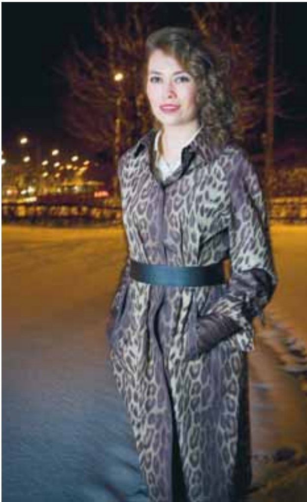
BRÖNDUKÁPA Þessi kápa kemur úr klæðaskáp ömmu hennar. Kápan er í senn dramatísk og glæsileg.