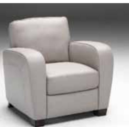
Vandað sófasett 3+1+1+ með þykkuk nautaleðri Litir : Ljóst,brúnt Verð kr. 315.000.-