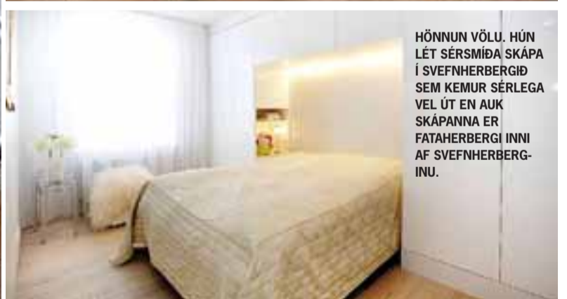
HÖNNUN VÖLU. HÚN LÉT SÉRSMÍÐA SKÁPA Í SVEFNHERBERGIÐ SEM KEMUR SÉRLEGA VEL ÚT EN AUK SKÁPANNA ER FATAHERBERGI INNI AF SVEFNHERBERGINU.