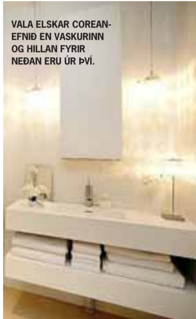
VALA ELSKAR COREAN-EFNIÐ EN VASKURINN OG HILLAN FYRIR NEÐAN ERU ÚR ÞVI.