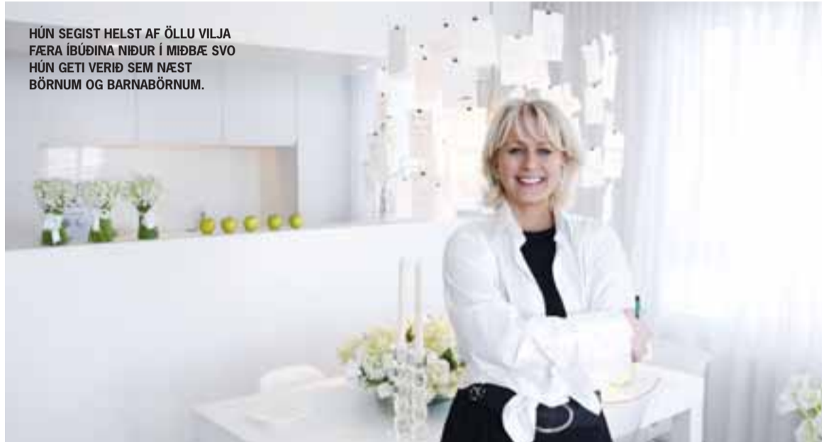
HÚN SEGIST HELST AF ÖLLU VILJA FÆRA ÍBÚÐINA NIÐUR Í MIÐBÆ SVO HÚN GETI VERIÐ SEM NÆST BÖRNUM OG BARNABÖRNUM.