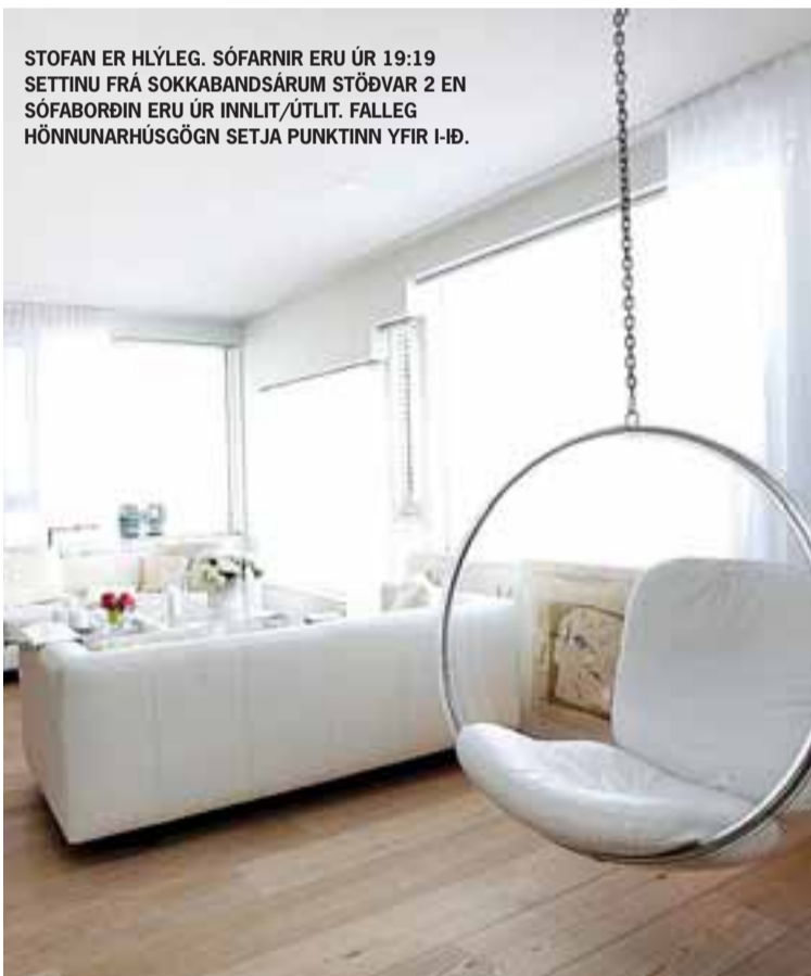
STOFAN ER HLÝLEG. SÓFARNIR ERU ÚR 19:19 SETTINU FRÁ SOKKABANDSÁRUM STÖÐVAR 2 EN SÓFABORÐIN ERU ÚR INNLIT/ÚTLIT. FALLEG HÖNNUNARHÚSGÖGN SETJA PUNKTINN YFIR I-ÍÐ.