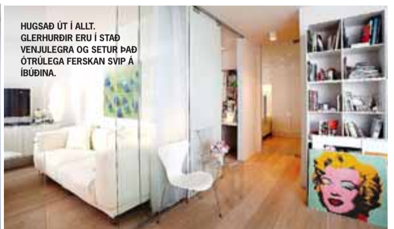
HUGSAÐ ÚT Í ALLT. GLERHURÐIR ERU Í STAÐ VENJULEGRA OG SETUR ÞAÐ ÓTRÚLEGA FERSKAN SVIP Á ÍBÚÐINA.