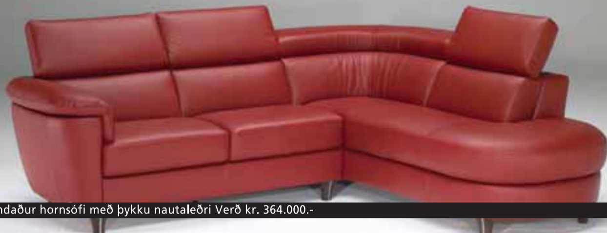
Vandaður hornsófi með þykku nautaleðri Verð kr. 364.000.-

Nýjar gerðir í breyttum og stærri sýningarsal