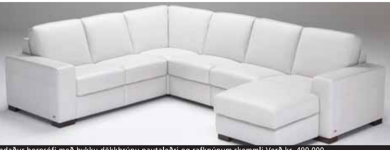
Vandaður hornsófi með þykku dökkbrúnu nautaleðri og rafknúnum skemmlí Verð kr. 490.000.-