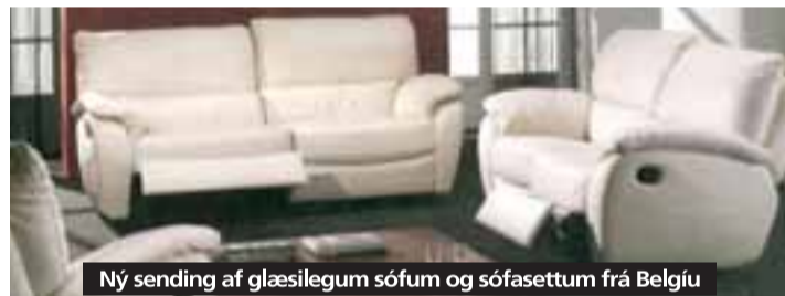
Ný sending af glæsilegum sófum og sófasettum frá Belgíu

Verð m/áklæði kr. 219.000.- / Verð m/leðri kr. 239.000.-