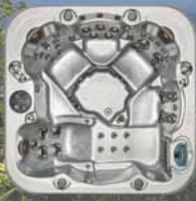
Vantage stærð 207x207x102