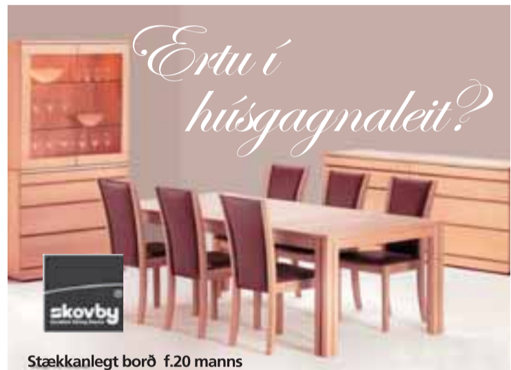
Stækkanlegt borð f.20 manns