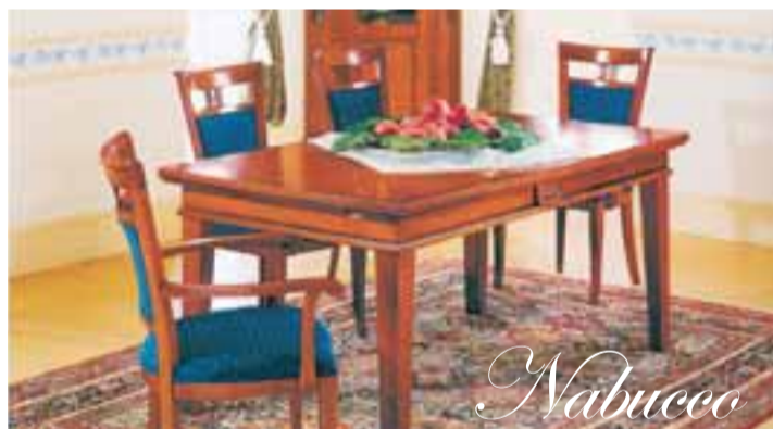
Nýkomið mikið úrval af sófasettum í leðri og áklæði