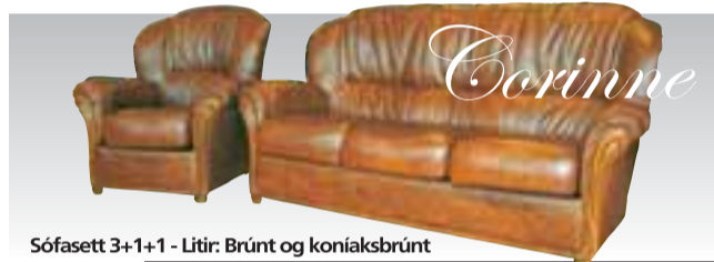
Sófasett 3+1+1 - Litir: Brúnt og koniaksbrúnt

Leðursófasett 3+2, til í rauðu, hvítu og svörtu leðri Verð kr. 370.000.-