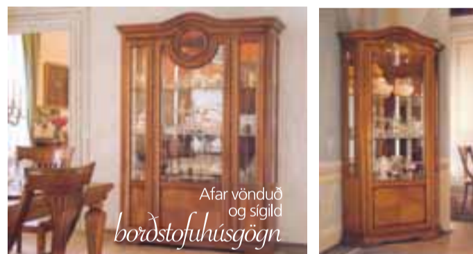
Afar vonduð og sigild borðstofuhúsgögn