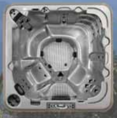
Tahiti stærð 209x209x102