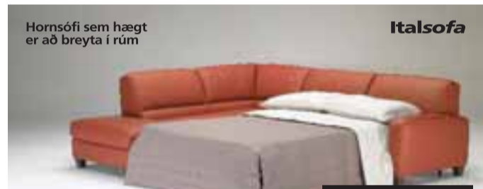
Hornsófi sem hægt er að breyta í rúm