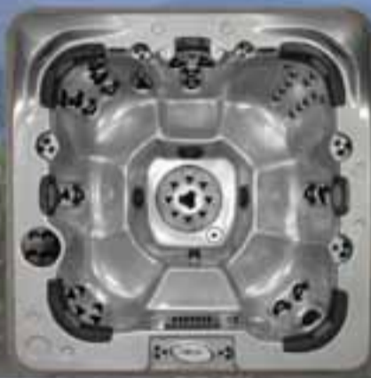
Bahama stærð 231x231x102