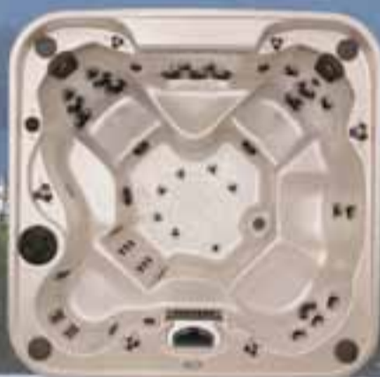
Radiance stærð 235x235x102