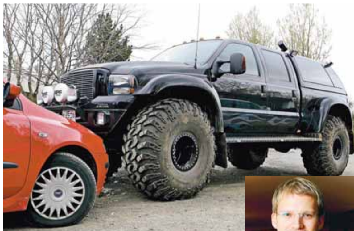
Jeppi Róberts er til sölu hjá Bílabúð Benna. Dekkin eru 1,24 metrar á hæð.

gær til að spyrja hann um ástæðu sölunnar. Í viðtali við Sirkus á síðasta ári sagðist hann hafa keypt jeppann til að fara í jöklaferðir um helgar. Jeppinn væri ekki beint