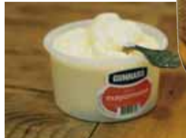
Ég get ekki verið án majones, gott með öllum mat eða bara eintómt.