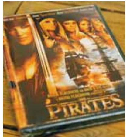
Söngvamyndir. Þær eru svo hressandi.