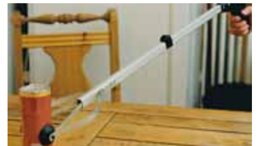
Handlangarinn á heimilinu er nauðsynlegur. Segir sig svolítið sjálf, frekar þægilegt apparat.