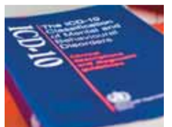
Bókin. „The Classical ICD-10 Classification of mental and behavioural disorders.“ Lífsnauðsynleg ef maður vill fræðast meira um sjálfan sig, fjölskyldumeðlimi og vini.