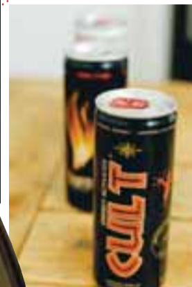
Orkudrykkir. Góðir fyrir taugakerfið og virka vel með pillum.