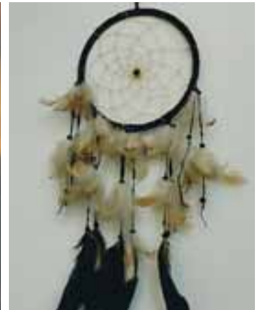
Draumafangari. Fangar fallega drauma og tortímir hinum.