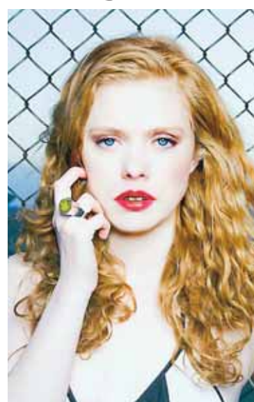
ræktaðir íslenskir skartgripir sem gefa okkur tækifæri á að bera náttúruna með okkur hvert