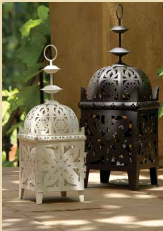
MOROCCAN LUKTIR 2 stærðir, tveir litir verð frá 1.290 535649/535625/535632/535656