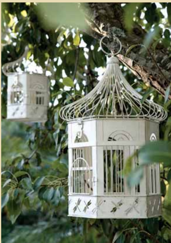
FUGLABÚR 2 saman 519342 verð 3.990