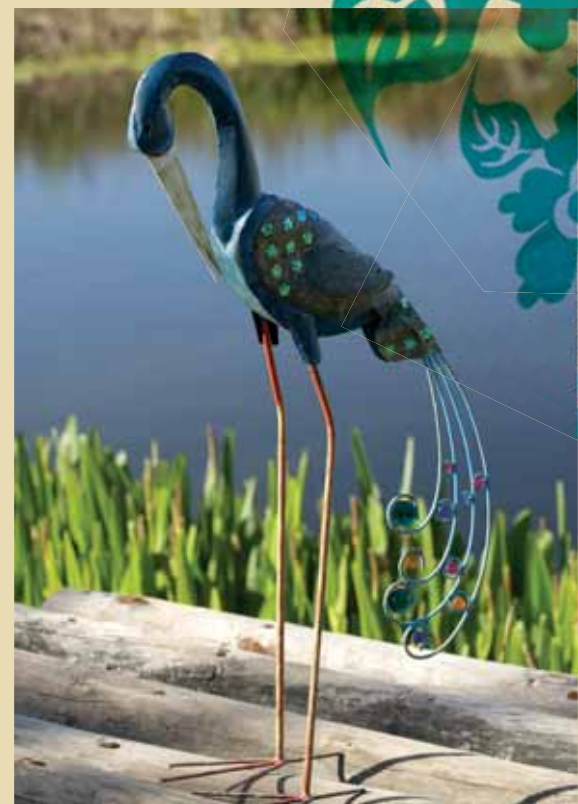
PÁFUGL með perlum, 85cm 464406 verð 7.990