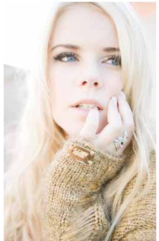
Jóhanna Guðrún segir að á nýrri plötu sinni, Yohanna, sé að finna fjölbreytni og dýpt.