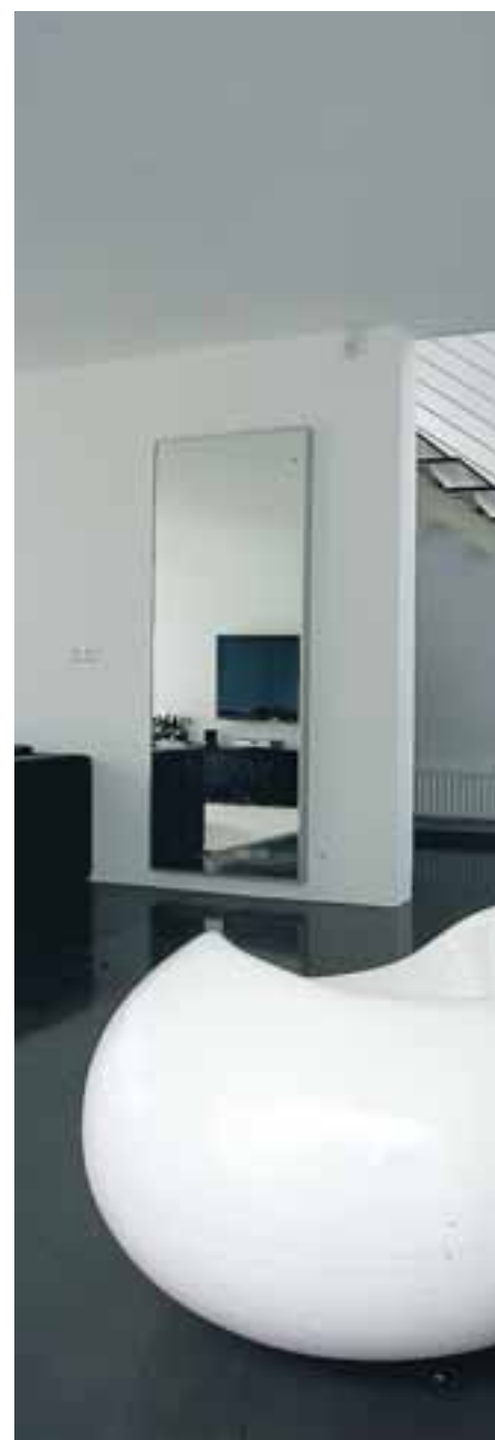
Horft úr stofunni upp á efri hæðina.