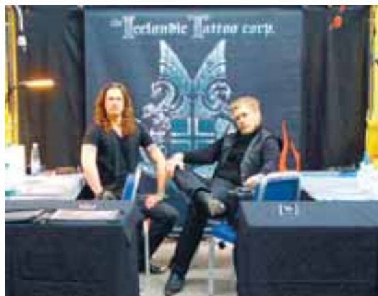
Bás Íslensku húðflúrstofunnar var valinn besti hannaði básinn á sýningunni.