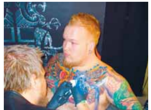
Þetta ævintýrlega húðflúr eftir Búra vann í flokknum besti nýi stíllinn.