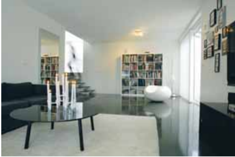
Á neðri hæðinni er aðalstofan. Út frá henni er gengið út á 40 fermetra verönd með heitum potti sem er mikið notaður á heimilinu.