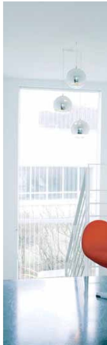
Hér opnuðu þau á milli hæða. Fyrir voru tveir gluggar og aði stigann upp en ljósinn frá Tom Dixon setja sv