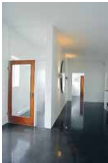
Hurðin í ganginum er upprunaleg en þau gættu þess vel að halda í það gamla á móti nýttiskuhönnuninni. Takið eftir speglinum á ganginum, hann er hringlagla og kemur sérstaklega vel út.