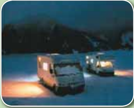
Verið frjálst og óháð í ferðalaginu.

Bylting í framleiðslu rafmagns fyrir húsbíla, hjólhýsi, fellihýsi og sumarhús.