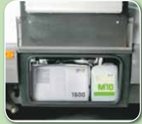
Alltaf til taks, allan sólarhringinn.