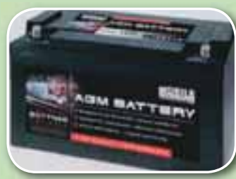
AGM Rafgeymar. Sérstaklega hannaðir fyrir notkun í ferðavögnum.