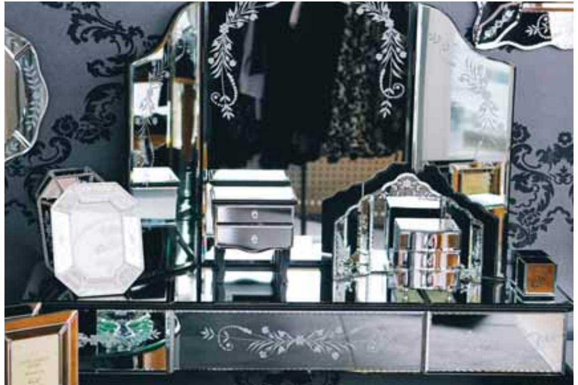
Það er svo sannarlega hægt að spegla sig hér. Munirnir eru frá Laura Ashley.