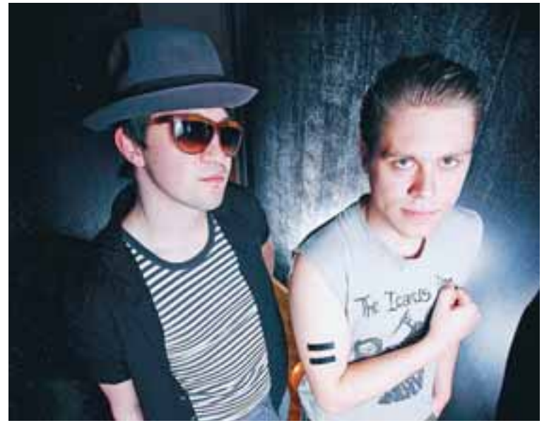
Kárius og Baktus partihaldarar.