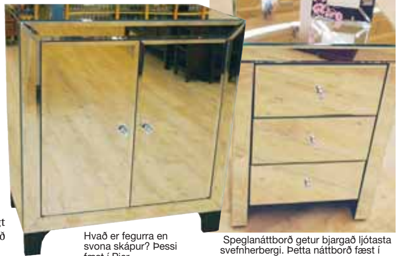
Hvað er fegurra en svona skápur? Þessi fæst í Pier.