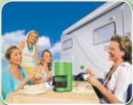
Rafmagnsvandamál úr sögunni.