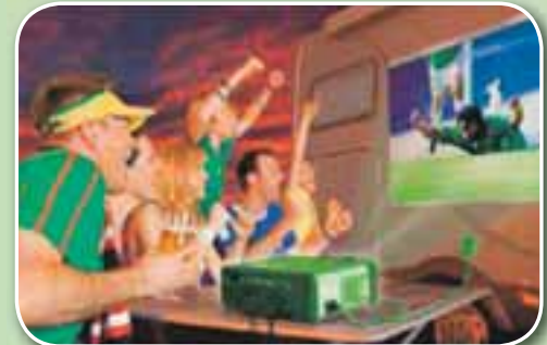
Njótið allra þæginda að heiman, í ferðalaginu.

Eigum örfá tæki á lager á gengi frá janúar 2008