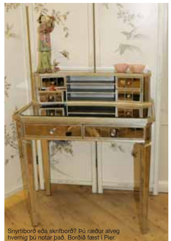
Snyrtiborð eða skrifborð? Þú ræður alveg hvernig þú notar það. Borðið fæst í Pier.