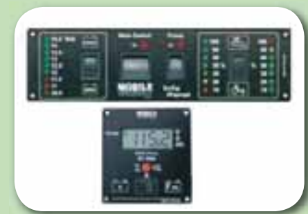
Hleðslutæki Mælar/rofar og margt fleira.