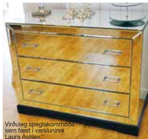
Virðuleg speglakommóða sem fæst í versluninni Laura Ashley.