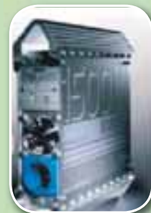
12V í 230V spennubreytar 230 Volta SINUS spenna fyrir öll 230V raftæki.