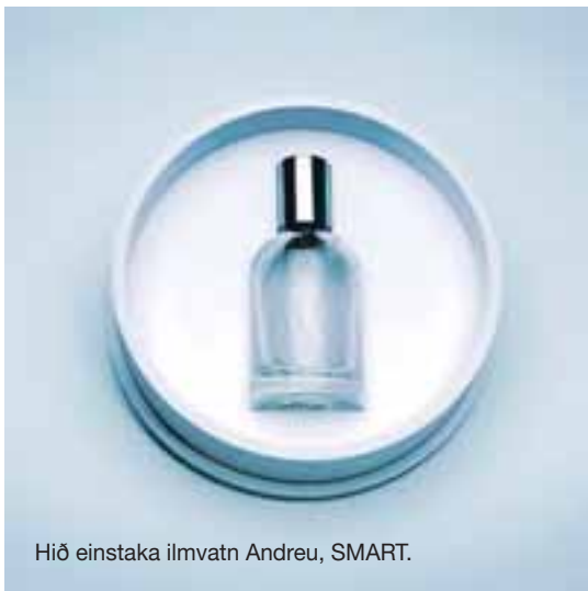
Hið einstaka ilmvatn Andreu, SMART.