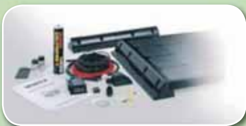
Hágæða, þýskar sólarrafhlöður. Fáanlegar í setti með öllu tilheyrandi.

Við eigum allan rafbúnað sem þig vantar í ferðavagninn