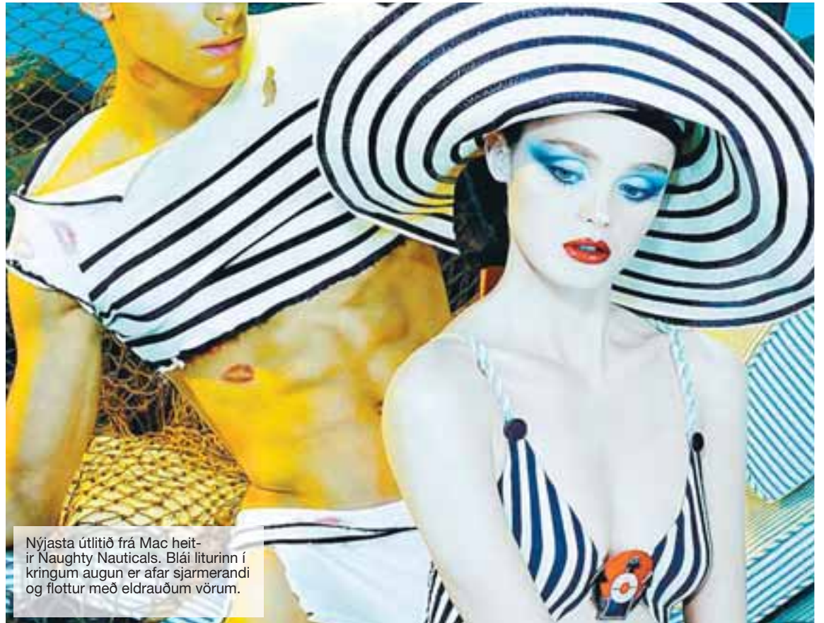
Nýjasta útlitið frá Mac heitir Naughty Nauticals. Blái liturinn í kringum augun er afar sjarmerandi og flottur með eldrauðum vörum.