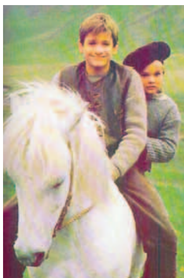
Nonni og Manni.