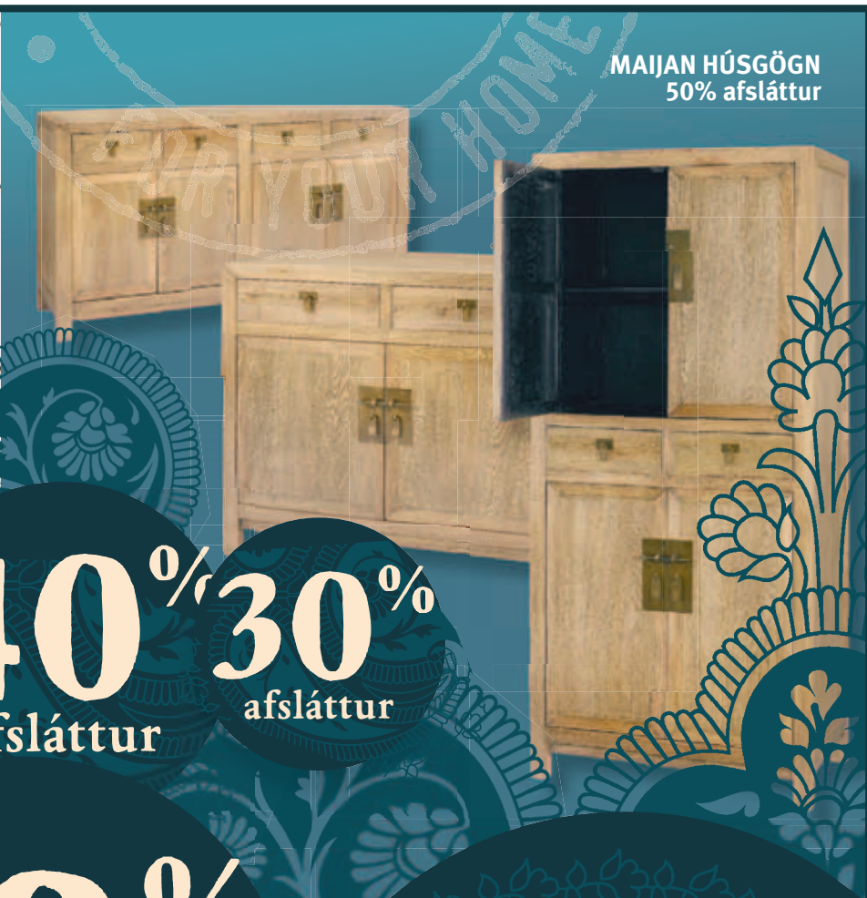
MAIJAN HÚSGÖGN 50% afsláttur