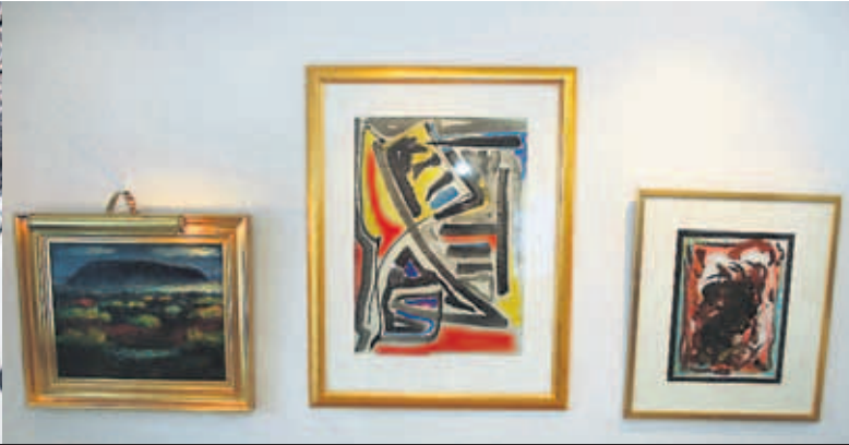
MÁLVERKASAFNIÐ MITT Ég hef sankað að mér málverkum í gegnum tíðina eftir núlifandi og látna meistarara.