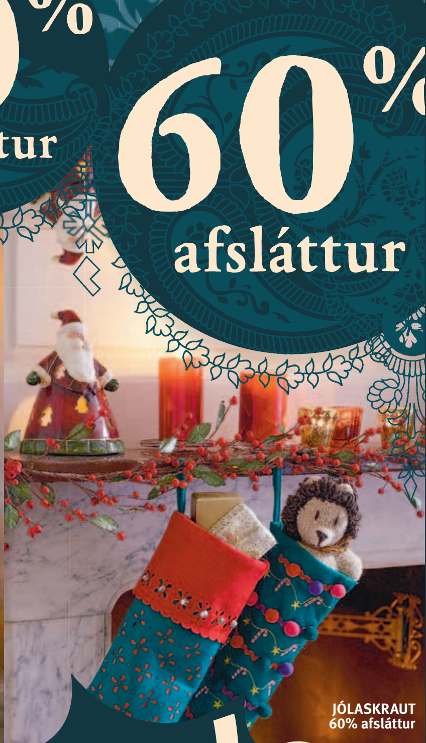
JÓLASKRAUT 60% afsláttur