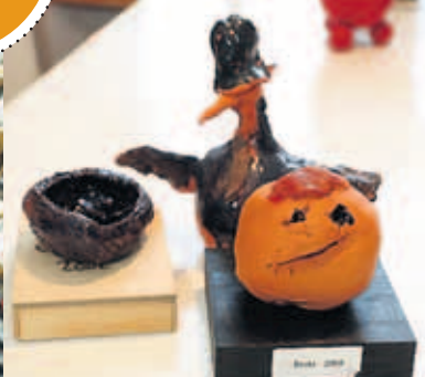
LITLU LISTAVERKIN sem börnin mín hafa búið til og hafa gefið okkur hjónum í gegnum árin.