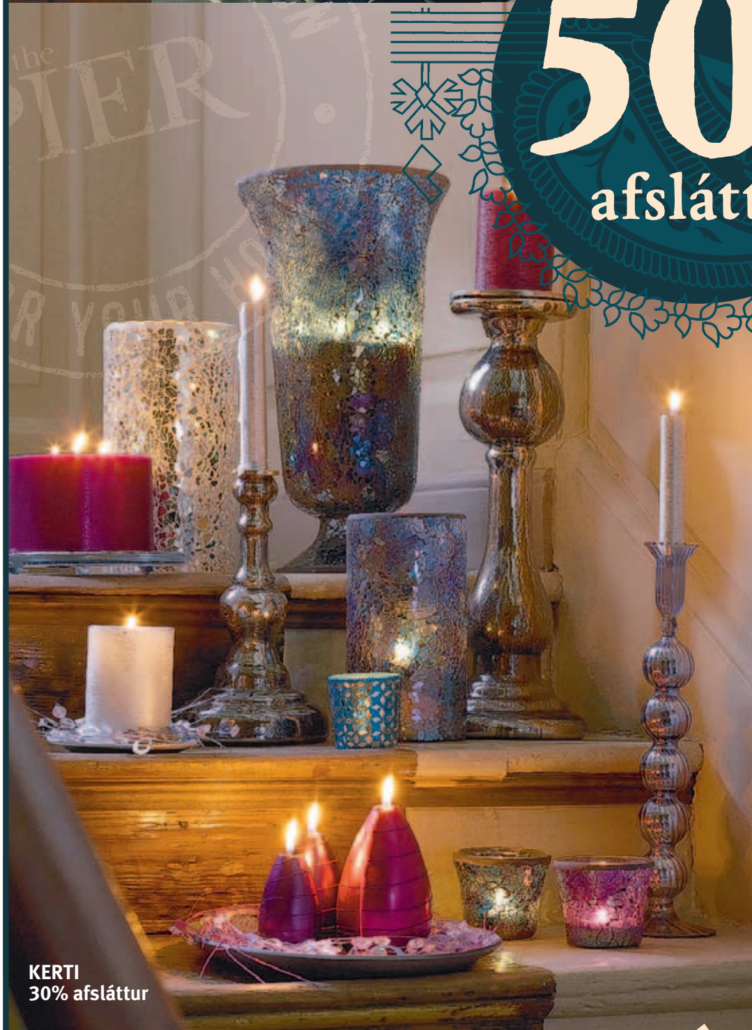
KERTI 30% afsláttur