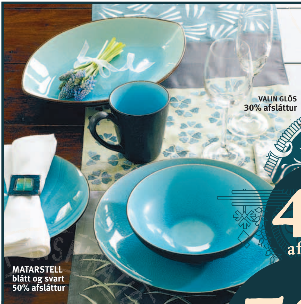
MATARSTELL blátt og svart 50% afsláttur