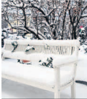
„UNDER DEN LINDEN“ Bekkurinn minn er í miklu uppáhaldi.