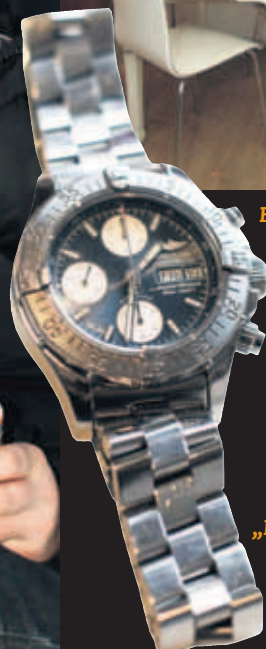
„BREITLING“-ÚRÍÐ MITT SEM ÉG TÓK UPP Í SKULD.