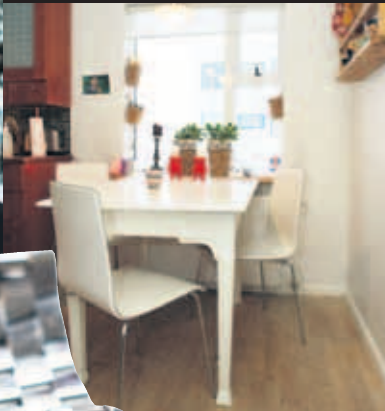
BORÐKRÓKURINN Á ARNARHRAUNINU Uppspretta góðra mómenta.